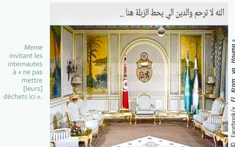
Meme invitant les internautes à « ne pas mettre [leurs] déchets ici ».

Je vous rencontre aujourd'hui afin d'examiner le sujet de l'enlèvement des déchets à Sfax. L'accumulation de causes depuis de nombreuses années, qui a donné lieu au problème environnemental que tout le monde connaît aujourd'hui, a un aspect objectif [mawdhou'i]. Mais nous devons aussi informer les Tunisiens que cette affaire