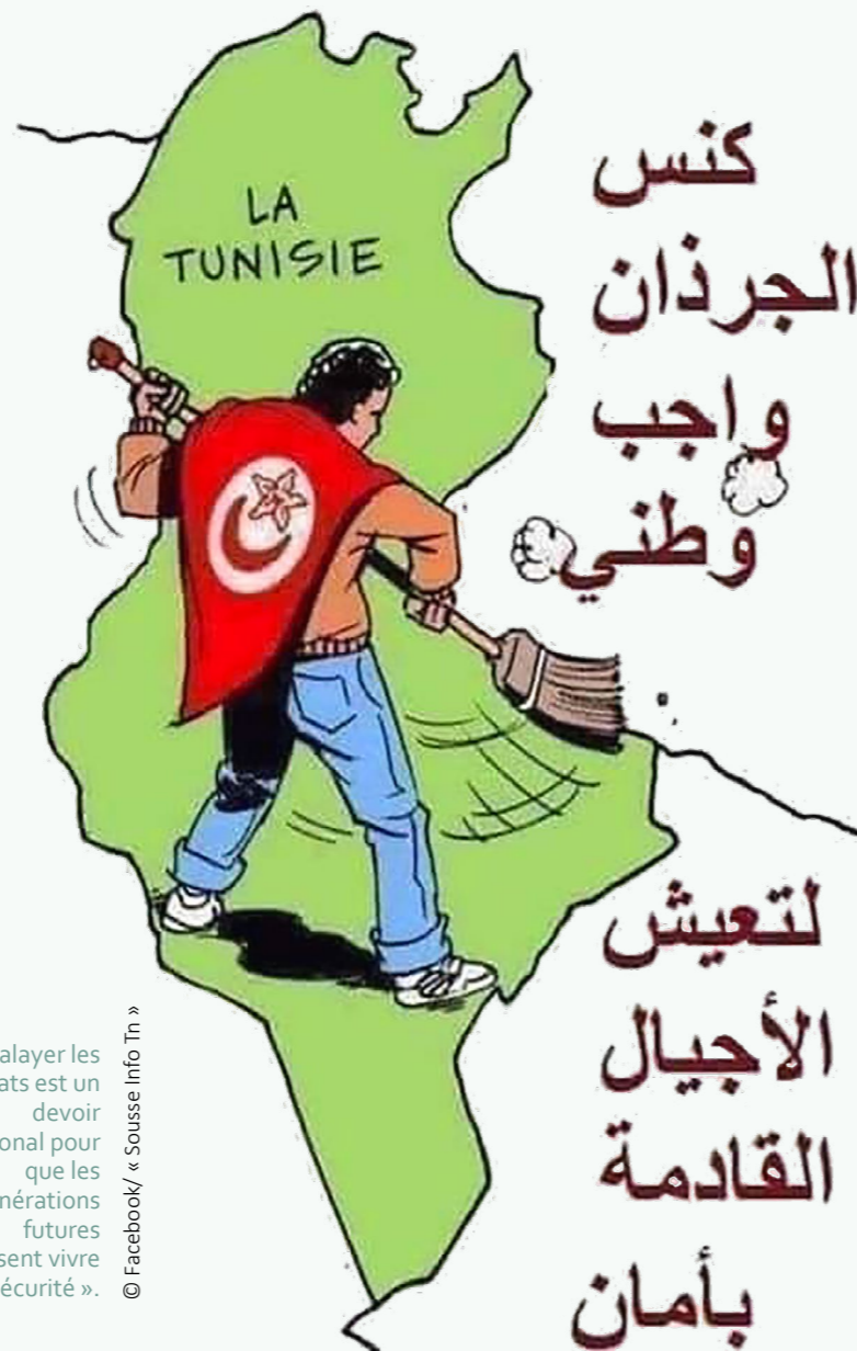
« Balayer les rats est un devoir national pour que les générations futures puissent vivre en sécurité ».