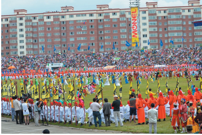
Les danseuses s'extraitent de chaque cercle pour effectuer le geste de tsatsal , juillet 2013.

pour un événement particulier (départ d'un des enfants, voyage ou entreprise risquée, mariage, etc.). Quels que soient leurs attachements religieux et leurs habitudes culturelles, il n'est pas un Mongol qui ne connaisse et reconnaisse le geste de libation tsatsal . Dans le bii biëlgee , ce geste est l'un des plus caractéristiques des danses à thème rituel. Cette danse de l'ouest pratiquée par des spécialistes, hommes et femmes, non professionnels, généralement sous la yourte nomade, possède en effet un répertoire de mimes dansés. Certains de ces mimes renvoient à des pratiques quotidiennes des éleveurs nomades des steppes, telles la préparation du feutre ou du cuir, la chevauchée, la couture, etc. D'autres donnent à voir des gestes rituels comme celui de la prière, mains jointes successivement apposées au front, aux lèvres et au thorax, ou celui de l'aspersion/libation rituelle tsatsal qui nous intéresse ici. Toutefois, il y est effectué à titre de geste dansé : la solennité dont il est empreint renvoie moins au sentiment qu'aurait le danseur d'exécuter un geste rituel qu'à la nécessité de rendre compte, dans la danse, de la solennité du rituel ainsi évoqué.