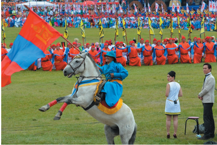
Le porteur du drapeau national fait cabrer son cheval à l'abord de la tribune d'honneur, acclamé à son passage, juillet 2013.

La danse véhicule quant à elle une illustration collective, même si elle se déploie de manière plus individuelle dans le choix des chorégraphes et metteurs en scène. Il est vrai que seuls les spectateurs mongols ou des spectateurs très bien informés sont susceptibles de reconnaître les « stars » ainsi présentées, ce qui laisse ouverte la question de leur reconnaissance par le public étranger. Cela n'empêche toutefois nullement le public international d'apprécier le spectacle ainsi que l'enchâssement des éléments emblématiques de la mongolité à différents niveaux.