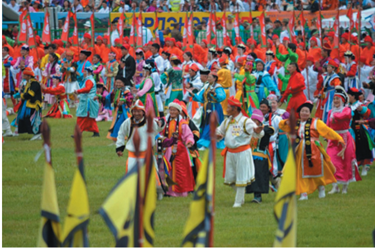
Les danseurs de bii biélgee s'avancent au centre du stade, juillet 2013.

qui s'attache à la carrière de chacun que comme une incarnation collective de la lutte mongole.