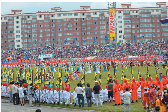
Les danseuses s'extraitent de chaque cercle pour effectuer le geste de tsatsal , juillet 2013.

pour un événement particulier (départ d'un des enfants, voyage ou entreprise risquée, mariage, etc.). Quels que soient leurs attachements religieux et leurs habitudes culturelles, il n'est pas un Mongol qui ne connaisse et reconnaisse le geste de libation tsatsal . Dans le bii biêlgee , ce geste est l'un des plus caractéristiques des danses à thème rituel. Cette danse de l'ouest pratiquée par des spécialistes, hommes et femmes, non professionnels, généralement sous la yourte nomade, possède en effet un répertoire de mimes dansés. Certains de ces mimes renvoient à des pratiques quotidiennes des éleveurs nomades des steppes, telles la préparation du feutre ou du cuir, la chevauchée, la couture, etc. D'autres donnent à voir des gestes rituels comme celui de la prière, mains jointes successivement apposées au front, aux lèvres et au thorax, ou celui de l'aspersion/libation rituelle tsatsal qui nous intéresse ici. Toutefois, il y est effectué à titre de geste dansé : la solennité dont il est empreint renvoie moins au sentiment qu'aurait le danseur d'exécuter un geste rituel qu'à la nécessité de rendre compte, dans la danse, de la solennité du rituel ainsi évoqué.