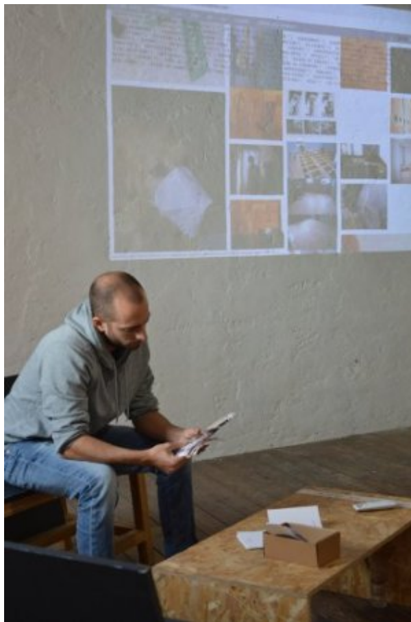
Figure 12. Visiteur regardant l'édition de « Wiki au chantier » (chienne de l'une des familles)