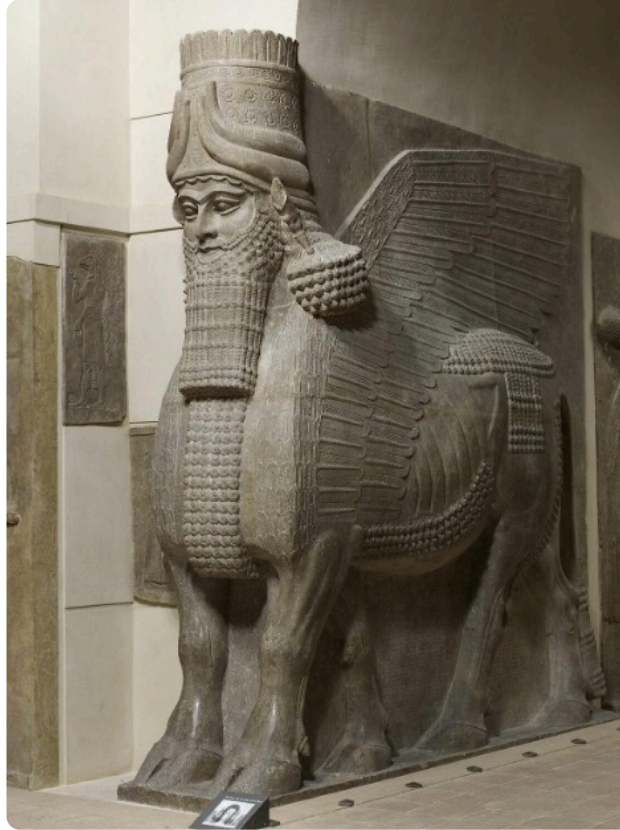
Fig. 5 : Relief inscrit représentant un lamassu (AO 19857)

Alessandro Mazzi (Università di Urbino – Italie), dans sa conférence intitulée « Humans are Hybrid : Šēdu and Lamassu as Shapeshifting Daimons crossing Cosmic Boundaries », a terminé la session consacrée à la conceptualisation du divin en présentant ses recherches autour des figures hybrides des Šēdu et Lamassu (fig. 5). Il a mis en avant la facette protectrice de ces figures qui, de par leur nature hybride, servent d'intermédiaire entre les hommes, les dieux et, plus largement, le monde surnaturel.