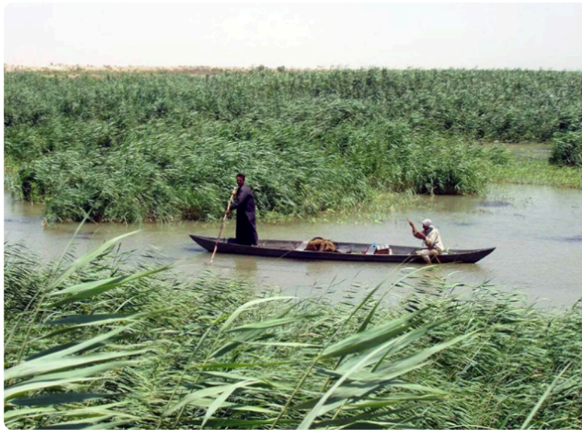
Fig. 4 : Paysages des marais du Sud de l'Iraq