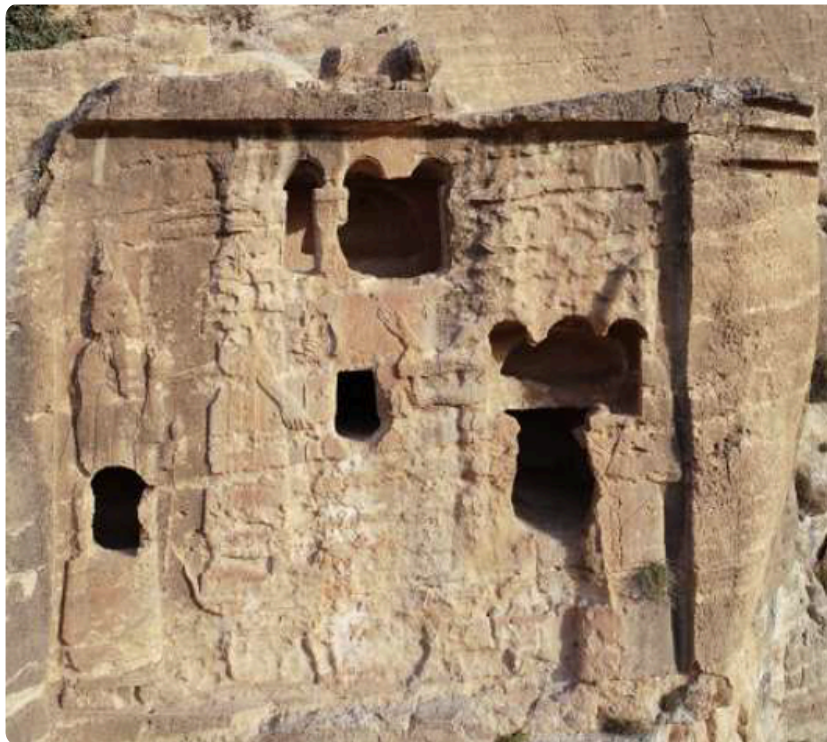
Fig. 2 : Relief de Khinis représentant le roi Sennachérib face à différentes divinités

Christopher Kramp (Allemagne) s'est quant à lui penché sur le site de Khinis/Bavian (nord de l'Iraq actuel) fondé par le roi Sennachérib (705-681 avant J.-C.). Il s'est tout particulièrement concentré sur la « Bavian-inscription » (fig. 2), située à l'intérieur de niches creusées dans la falaise et célébrant la construction d'un canal et les actes militaires du souverain. Après avoir présenté les différentes parties de l'inscription, il a interrogé la fonction de ce sanctuaire en pointant du doigt certains éléments étonnants comme la présence du dieu Marduk ou encore la volonté du roi de détruire les dieux babyloniens. Finalement, il a proposé que le sanctuaire de Khinis pourrait avoir une fonction d'auto-déification du roi se présentant comme l'égal des dieux.