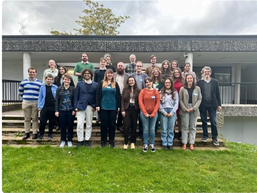
Fig. 8 : Les participants de la 12e édition de l'OPCA dans la cour du Wolfson College d'Oxford

Finalement, la démonstration de la nouvelle technologie du projet SIANE pour scanner les sceaux-cylindres a permis de s'interroger sur l'avenir de l'accès aux ressources en assyriologie et les nouvelles méthodes en devenir. Ces dernières années ont vu naître de nombreux outils numériques dans le domaine des sciences humaines ; il est désormais nécessaire de composer avec ces outils afin d'en retirer le maximum de bénéfices pour faire progresser et faciliter la recherche en études mésopotamiennes.