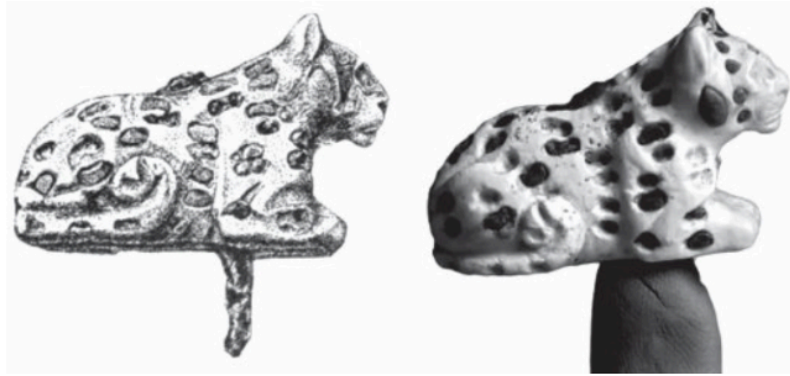
Fig. 3 : Photographie et reconstitution d'une statuette de léopard

Mónika Nyitrai (Université Loránd Eötvös – Budapest) a ensuite présenté sa communication intitulée « Leopard in Ancient Mesopotamia ». Elle a exposé certains problèmes auxquels elle est confrontée dans sa recherche, à savoir l'identification des léopards ( nemur, nimru ) dans l'iconographie des IV e et III e millénaires avant J.-C. Pour cela, elle a présenté différents objets dont l'identification reste problématique, comme des sceaux-cylindres, des statuettes ou des amulettes, montrant une pluralité de fonctions pour cet animal (fig. 3). Par ce biais, elle a également mis en exergue certains facteurs pour mieux identifier le léopard, à savoir la disposition des taches ou encore celle du corps.