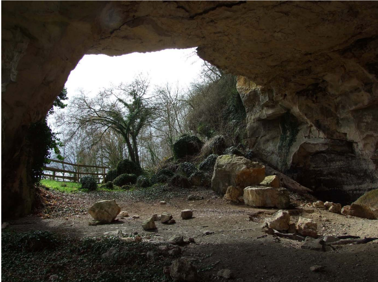
Fig. 2 – Carrière calcaire de la Falouse à Bellerey, près de Verdun.