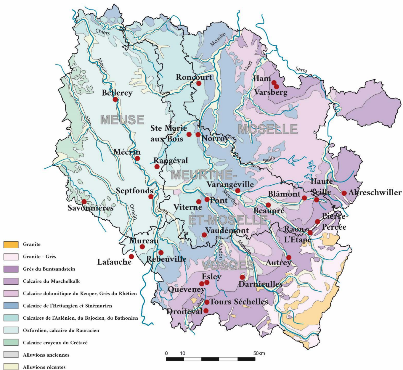
Fig. 1 – Lieux cités dans l'article sur fond de carte géologique simplifiée de la Lorraine (C. Moulis).