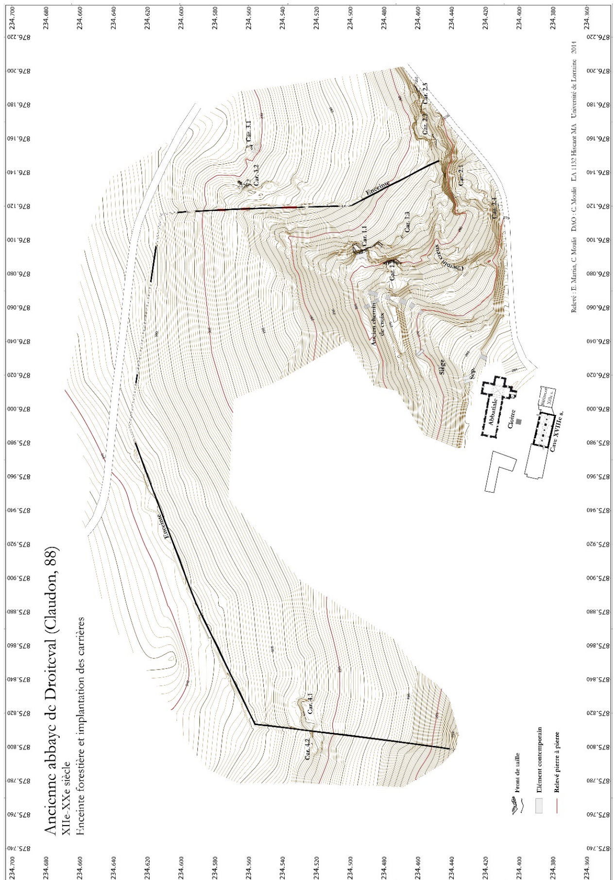
Fig. 11 – Relevé topographique des carrières aux abords de l'abbaye de Droiteval (Vosges) (C. Moulis, M. Nique).