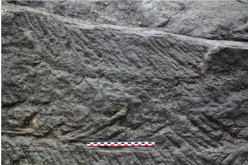
Fig. 12 – Détail d'une « encoiboiture », abbaye de Droiteval (Vosges) (M. Nique).

Le château des Tours Séchelles (Saint-Baslemont, Vosges), édifié vraisemblablement au XI e ou au XII e siècle, présente dans son fossé des traces d'extraction du grès à Voltzia. Deux techniques d'exploitation y sont décelables. La première est la technique du front de taille reculant par palier. On y recense deux emboîtures. La seconde technique, en fosse, a été mise en évidence trois fois, chacune des fosses représentant un volume extrait de soixante-dix mètres cube environ. Le volume total de l'extraction a été estimé à cinq ou six cents mètres cube (Kraemer 2018, p. 493-494).