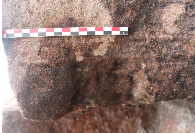
Fig. 14 – Emboîture visible sur la queue d'une pierre de grès du parement extérieur nord du donjon de Pierre-Percée (Meurthe-et-Moselle).