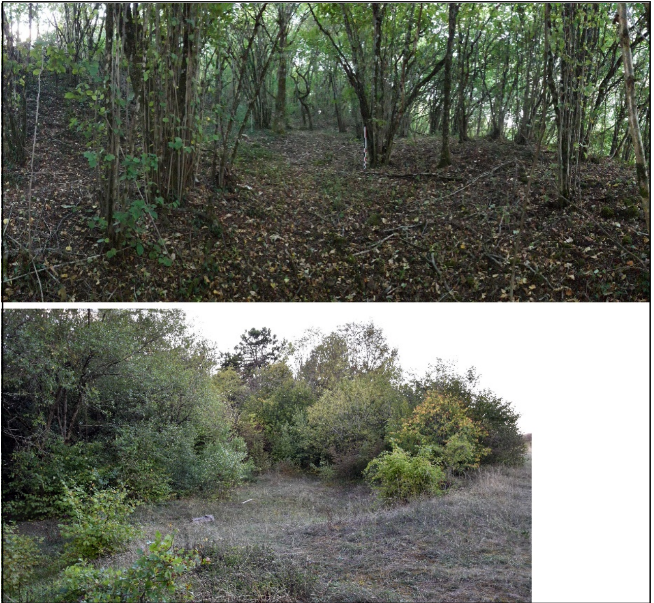
Fig. 10 – Carrière en rupture de pente (front à gauche) et carrière en front sur des calcaires Bajociens de la colline de Sion (Meurthe-et-Moselle). Les photos illustrent la difficulté de repérage et de l'interprétation des sites carriers.

dimension (quarante-cinq centimètres de long pour dix centimètres de haut), ont été dénommées « encoiboîtures » 2 et restent à l'heure actuelle uniques en Lorraine ( fig. 12 ). On retrouve enfin en zone 3 un petit stock de pierres extraites et posées en tas au-delà du front d'extraction.