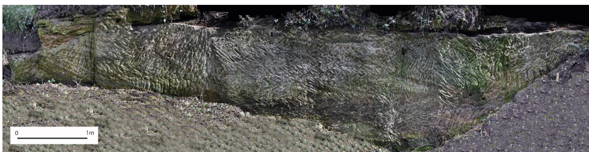
Fig. 8 – Photogrammétrie d'un front de taille dans le grès du Buntsandstein aux abords du château de Varsberg (Moselle) (C. Moulis).