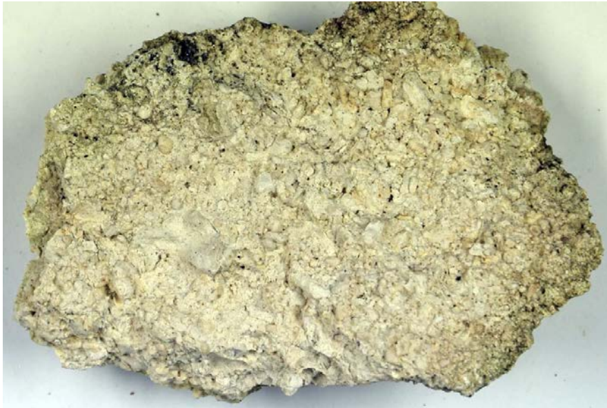
Fig. 3 – Calcaire corallien de l’Oxfordien moyen dans le secteur de Mureau (Vosges).