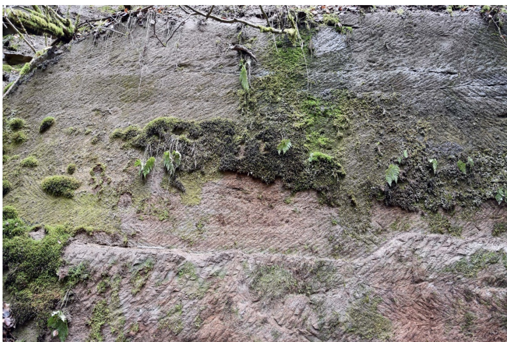
Fig. 13 – Paroi de 5 x 2,5 m recouverte de traces de redressement de paroi au pic pour les carrières de grès potentiellement destinées à l'abbaye de Haute-Seille, Val-et-Châtillon (Meurthe-et-Moselle) (C. Moulis).

(Nique 2014). Une synthèse diachronique sur les carrières en Lorraine a été réalisée récemment, mais ne reprenant que des sites déjà étudiés et rarement nouvellement découverts. L'archéologie préventive, hormis de rares cas (Brkojewitsch 2015), n'a par ailleurs pas toujours le temps nécessaire pour fouiller complètement les zones d'extraction qui peuvent être découvertes lors des opérations, ni pour les étudier en profondeur. Il serait judicieux que les cahiers des charges scientifiques produits par les SRA et validés en CTRA puissent préconiser de manière systématique le renseignement de ces données lorsque le cas se présente, ainsi que la caractérisation systématique des roches. Certains secteurs où la roche est bien connue pour ses propriétés à la construction pourraient également faire l'objet de prospections méthodiques, en s'appuyant sur la cartographie LiDAR de la région en haute définition, qui devrait être mise à la disposition des chercheurs d'ici quelques années.