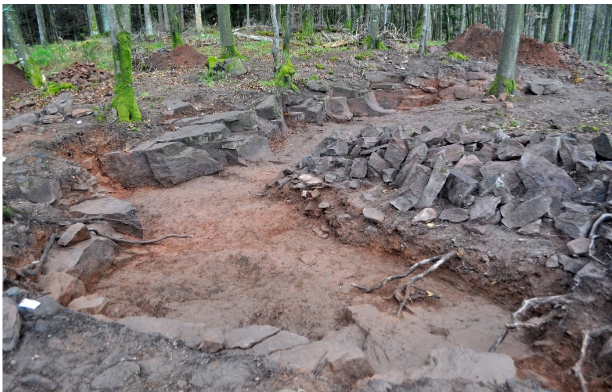
Fig. 5 – La carrière de grès du Streitwald (Moselle) en cours de fouille : le front réduit à un seul ban fait face à un tas de blocs extraits.

empreinte dans le paysage est donc minime et seule une prospection minutieuse permet de retrouver les plus petites. Une des carrières du château d'Ischeid dans les bois du Streitwald à Abreschwiller (Moselle) a ainsi pu être localisée lors d'une prospection pédestre à environ 500 m du chantier de construction (fig.5). Seuls les derniers blocs d'extraction de petite taille d'une zone de stockage surnageaient par-delà l'humus. Cette carrière a d'abord été associée au parcellaire antique qui composait les lieux avant l'apparition de la couverture forestière. C'est la fouille qui a permis de confirmer son caractère, sa datation et sa destination (Heckenbenner, Moulis et alii . 2018, p. 509-510).