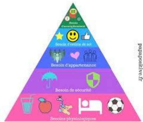
La pyramide de Maslow à commenter

Au début du dernier entretien, on présente aux parents une représentation illustrée à destination des enfants de la pyramide de Maslow 11 sur les besoins humains, afin qu'ils la commentent devant leur enfant et, ce faisant, explicitent ce que signifie la notion d'appartenance.