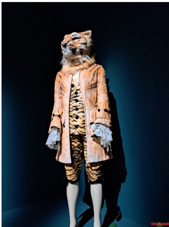
Nature et culture (philharmonie 2022)

29.mai.2024 | par jean-marie.barbier | Outils d'analyse | 39 visites | 0 commentaire