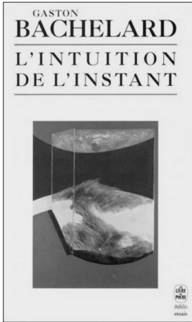
Illustration de Frantisek Kupka

Or, pas plus que Bergson, Bachelard n'a compris que la notion de simultanéité perdait tout sens dans le cadre de la relativité einsteinienne. À la durée bergsonienne, donnée immédiate de la conscience dépendant à la fois de l'observateur, du lieu et du temps, il oppose un « instant » censé ne se dérouler ni dans l'espace, ni dans le temps – et se ridiculise lorsqu'il se revendique de l'autorité d'Einstein pour réintroduire ainsi la simultanéité.