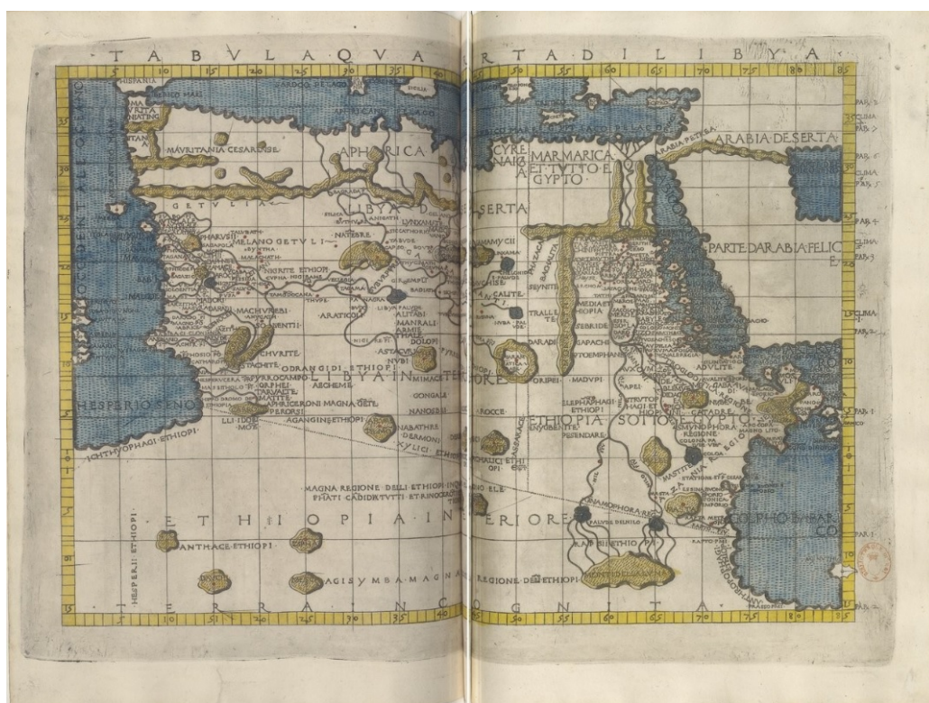
5. Tabula quarta di Libya