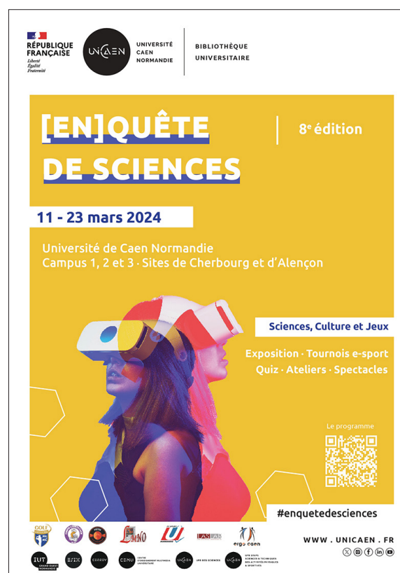
Figure 4. Affiche de l'édition 2024 réalisée par les étudiant-es du département information-communication, université de Caen Normandie

une autre dédiée à la production de contenus digitaux, avec la réalisation de vidéos-interviews des groupes d'étudiant-es, la préparation de posts pour les réseaux (X, Instagram, Facebook, LinkedIn), et la dernière en charge de la production écrite (communiqués de presse, agenda...), aux relations publiques et aux relations presse. Chacun des membres du groupe devait, enfin, venir couvrir une action du festival, pour assurer les publications sur les réseaux sociaux, mais aussi documenter l'action.