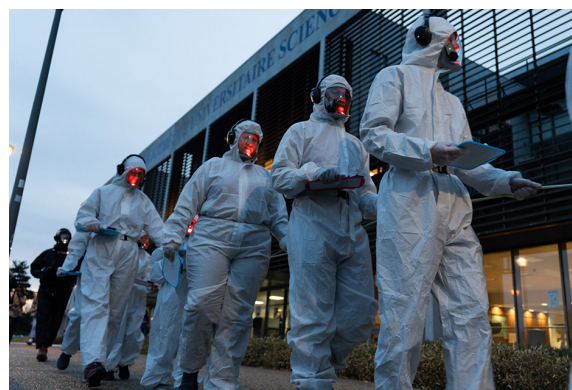
Figure 1. Spectacle performance #ExoTerritoires, compagnie Le Clair Obscur