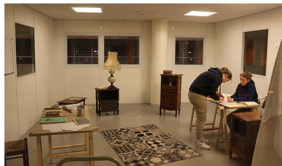
Figure 3. Escape Game « Imitation game », 2023