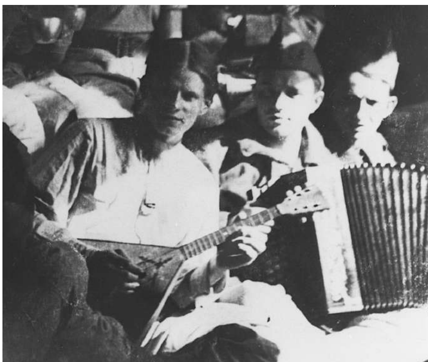
André Leroi-Gourhan jouant de la balalaïka avec ses amis russes. Vers 1926-1927