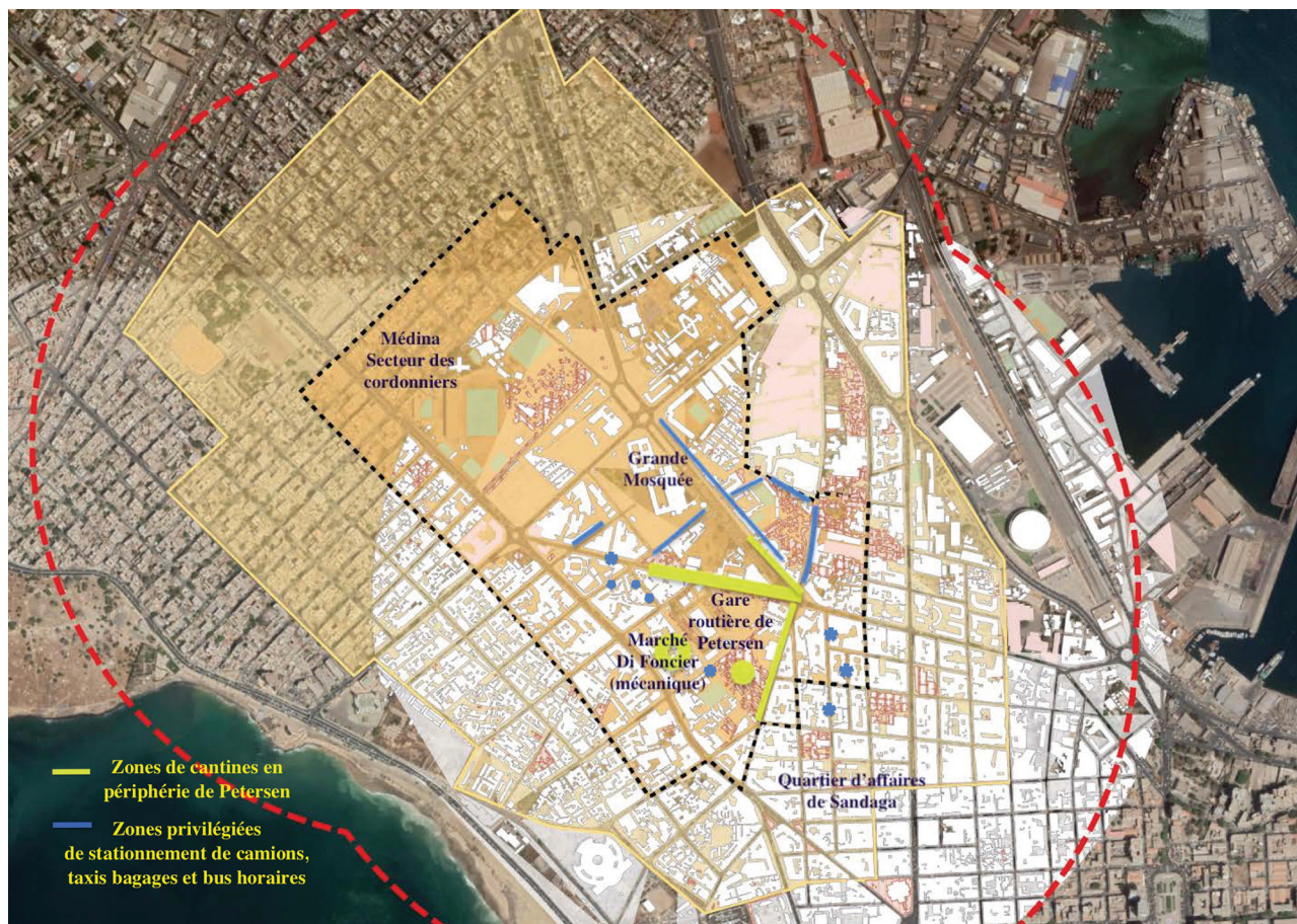
Figure 1 : Situation géographique du marché-gare de Petersen et périmètre de l'étude visant à l'aménagement du « quartier bas carbone »