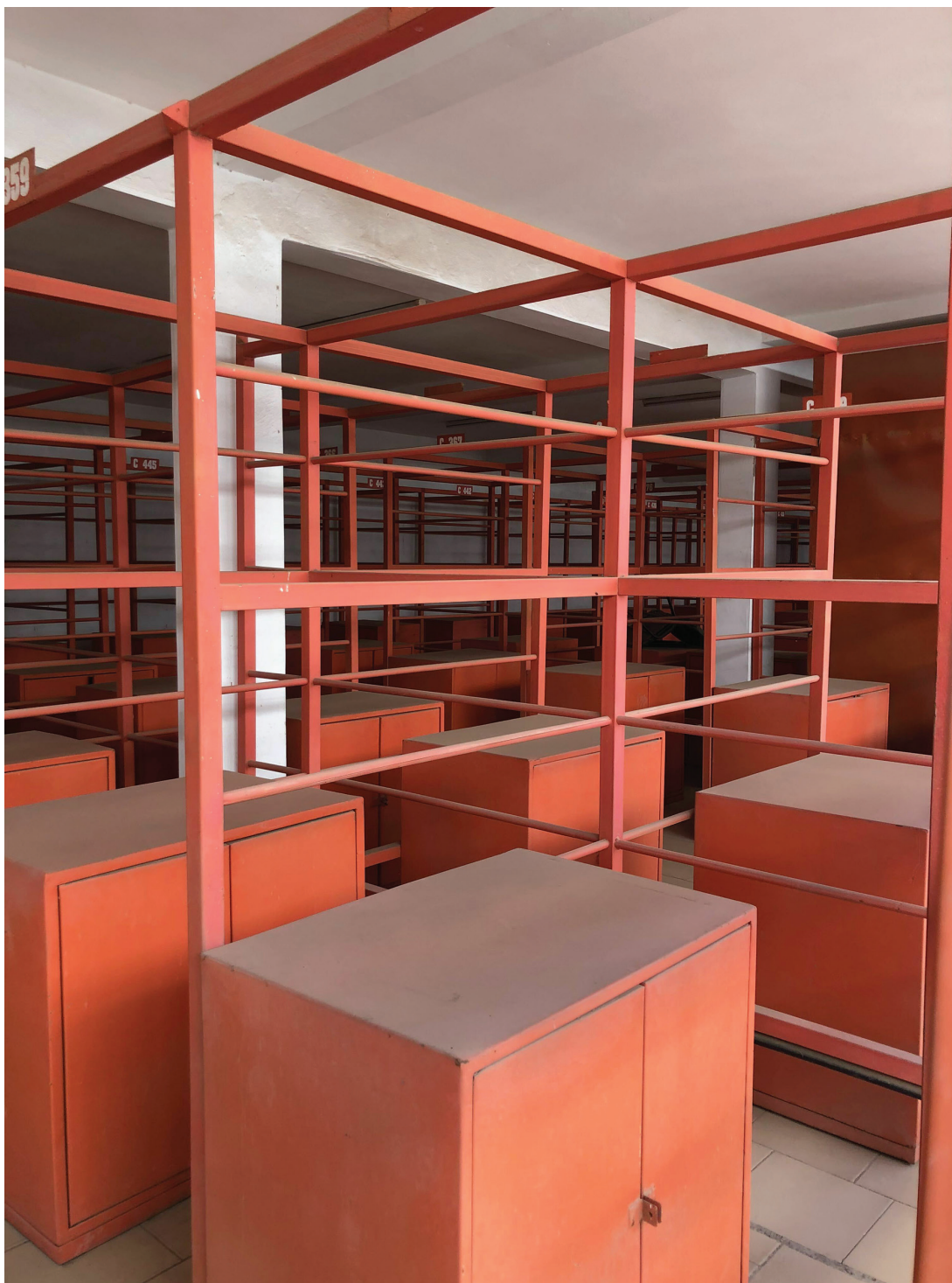
Figure 3 : Le centre commercial Felix Eboué, déserté