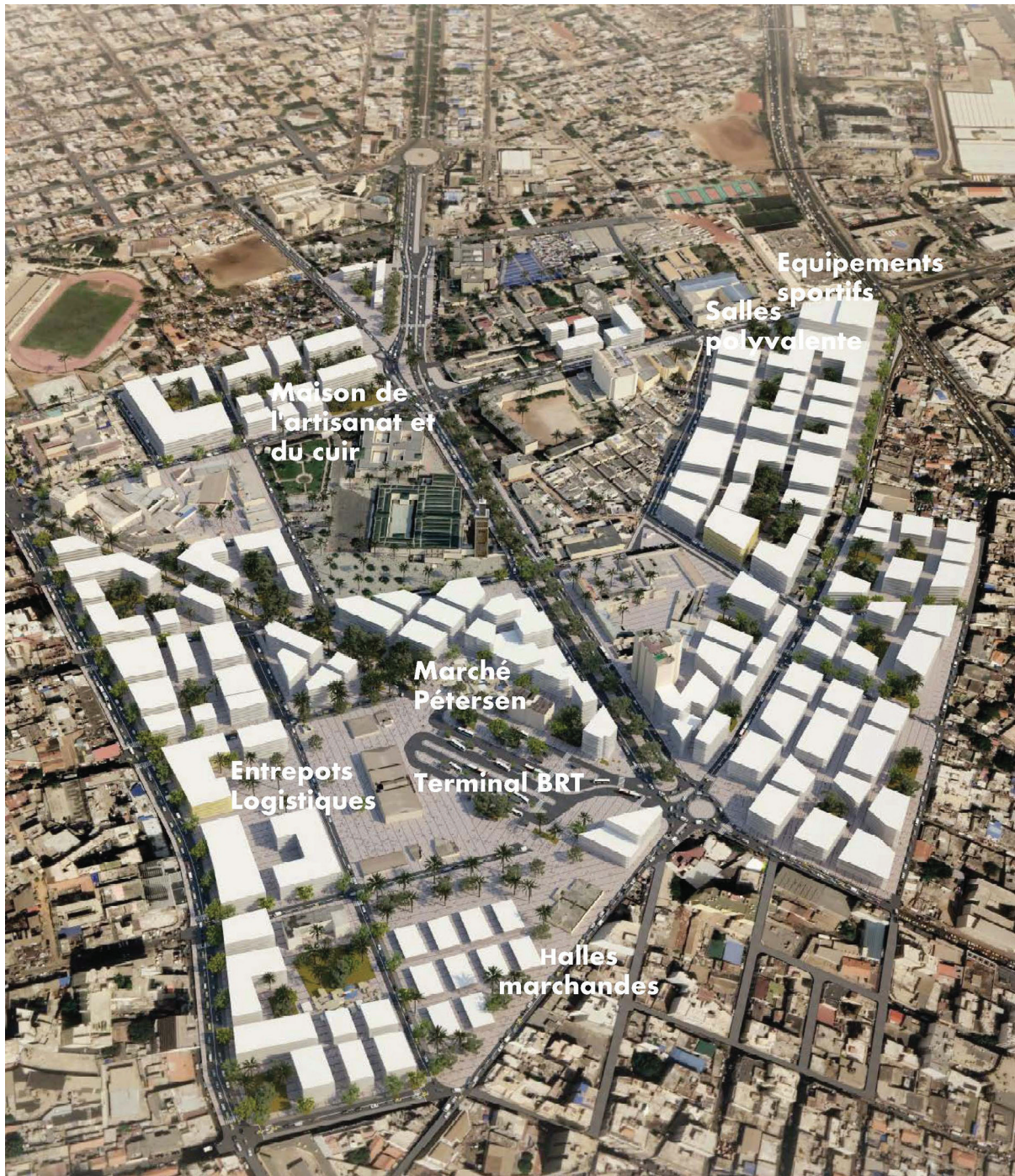
Figure 6. Projection du futur quartier Petersen