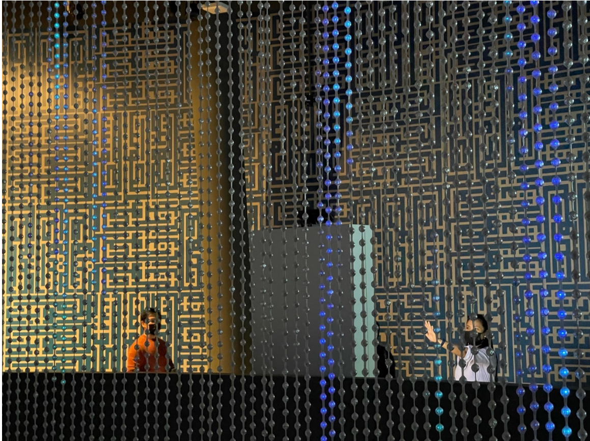
14. Dubaï Expo 2020 s'est caractérisée par l'omniprésence des écrans. Ici, un rideau/écran géant où chaque ampoule représente un pixel. Les motifs très particuliers font penser au dessin d'une puce électronique dans laquelle les visiteurs semblent hypnotisés, enveloppés, voire prisonniers de cette structure de lumière arachnéenne (M. Benchetrit, 2022)