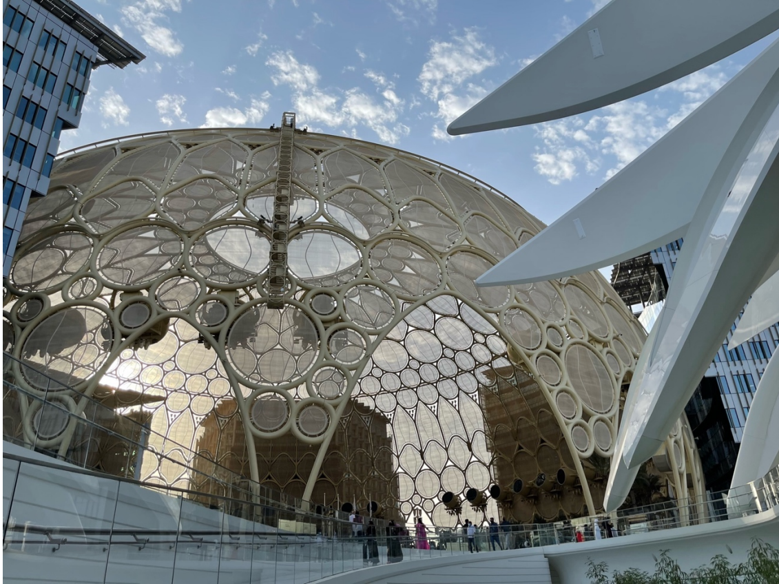
11. Al-Wasl [la connexion], forum magistral voué à une expérience sensorielle immersive (pour ne pas dire envoûtante) de la ville. Dôme de 67 mètres de haut en acier, icône architecturale du site de Dubaï Expo 2020, Al-Wasl accueille aujourd'hui un spectacle quotidien et nocturne de sons et lumières projetées par 252 lasers (Fig. 12) (M. Benchetrit, 2022)

Au Caire comme à Dubaï, le megamall est pensé à ciel ouvert, où un ensemble de rues commerçantes relie les espaces clos de la galerie commerciale, du magasin Ikea et des hôtels. Une marina (à Dubaï) et un amphithéâtre à ciel ouvert (au Caire), en constituent les lieux centraux reprenant les codes d'un espace public fantasmé, normé et occidentalisé. Cette nouvelle « typologie du forum » n'est pensée que pour maximiser les profits des enseignes qui l'entourent. Les espaces de Festival City sont, de ce point de vue, de vastes « îlots de consommation et de branding » (El Husseiny et Kesseiba, 2018).