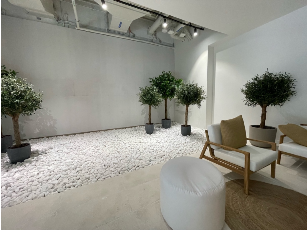
19. Villa témoin du projet Expo Valley, logée dans un ancien Pavillon national de Dubaï Expo 2020 (M. Benchetrit, 2023)

Tous ces logements sont disponibles à la vente sur plan depuis le début de l'année 2023, avec facilités de paiement sur trois ans, de manière à alimenter la spéculation – les plans de financement, aux ÉAU, peuvent être revendus plusieurs fois avant le début des travaux 9 . Le géant de l'immobilier Emaar a quant à lui prévu de livrer l'indispensable mall sur le site, tandis que l'animation de ce nouveau quartier sera assurée par des clubhouses , restaurants et hôtels qui devraient s'installer dans les anciens Pavillons nationaux, mais aussi des salles de sports, cinéma en plein air et aires de jeux, tous reliés par un « green link » qui mènera au cœur du site de Dubaï Expo 2020.