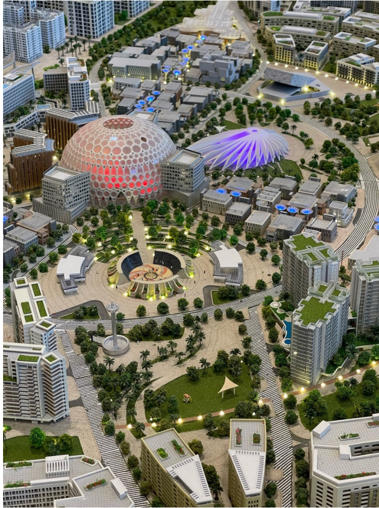
2. Maquette de Dubaï Expo 2020 et du projet Mangrove Residences d'Expo City (au premier plan de l'image) ; au centre de l'image, la cascade d'eau [ dancing fountain ] ; en rouge, le dôme Al-Wasl ; en violet, le Pavillon des ÉAU. La maquette est située dans le hall du Sales center du promoteur Dubai Expo Group ; autour d'elle se négocient sur plan les appartements avec vue sur Dubaï Expo 2020