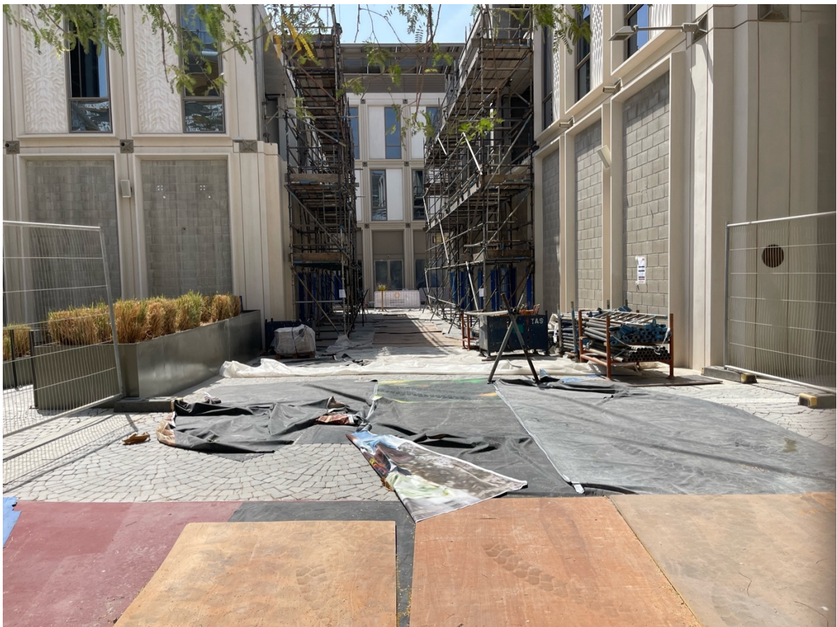
24. Arrachage des bâches publicitaires recouvrant les façades des anciens Pavillons de Dubaï Expo 2020. Les murs de parpaings aveugles ont ici fonction de panneau d'affichage (Benchetrit, 2023)

Sur un même site viennent donc se matérialiser les deux piliers de la production urbaine à Dubaï, d'une part la ville nouvelle, enclave autorégulée dans le désert, produit d'un urbanisme spéculatif ayant contribué à façonner l'archipel métropolitain local. D'autre part, l'enchaînement Exposition universelle/COP 28 traduit la multi-événementialité urbaine dans laquelle souhaite s'installer la ville-Émirat de Dubaï. Dans sa quête permanente d'attractivité et de compétitivité, Dubaï fait du grand événement le ressort principal de sa métropolisation. Elle semble aujourd'hui en mesure de parier sur la succession d'événements internationaux visant à recréer le monde dans et à travers la ville (Roy et Ong, 2011). Organisés à intervalles réguliers, ils permettraient de pérenniser le temporaire, dispensant in fine les autorités d'avoir à planifier à long terme le réemploi de sites événementiels, tout en donnant quelques gages en matière de durabilité urbaine : c'est le cas avec « l'écoquartier » Expo City en projet, qui permet cependant et avant toute chose, d'entretenir l'économie immobilière.