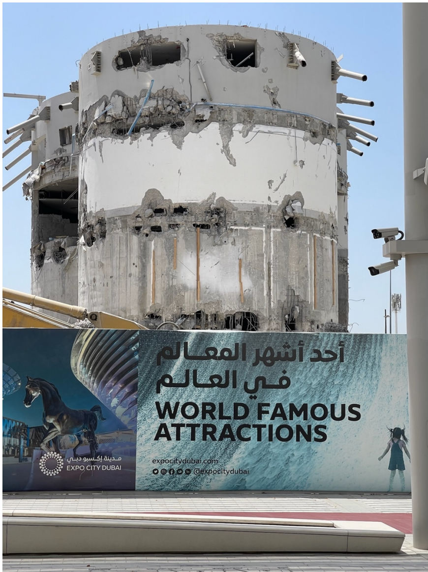
15. Expo City en projet sur le site de l'Exposition universelle de Dubaï en cours de démantèlement : ici, le squelette du Pavillon du Sultanat d'Oman (M. Benchetrit, 2023)

À Dubaï, on s'attend rarement à trouver une ville derrière une city . Le terme est très souvent utilisé pour désigner plutôt un nouveau quartier, en forme de cluster , dont Dubaï a fait la marque de fabrique de sa politique de zonage engendrant un développement fragmenté (Internet City, Media City, Studio City, Sports City, Motor City, Sustainable City, International City, etc.).