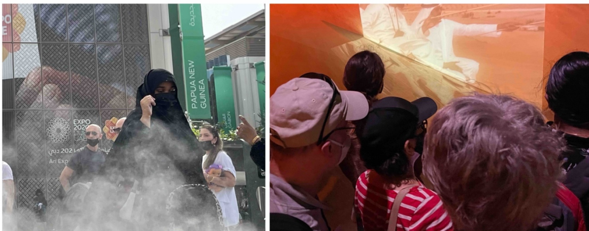
3. A droite : visiteurs de l'Exposition universelle agglutinés et absorbés par l'image projetée sur cet écran du Pavillon des ÉAU. La scène représente des émirs dans le désert (M. Benchetrit, 2022)