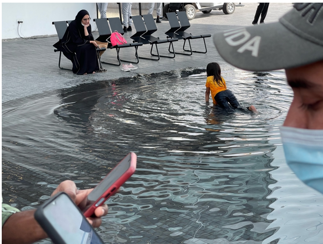
9. Sous le Pavillon du Brésil, un petit étang urbain fait sensation, l'occasion de photographier et de partager sur les réseaux sociaux ce micro-événement incorporé à Dubaï Expo 2020 (M. Benchetrit, 2022)