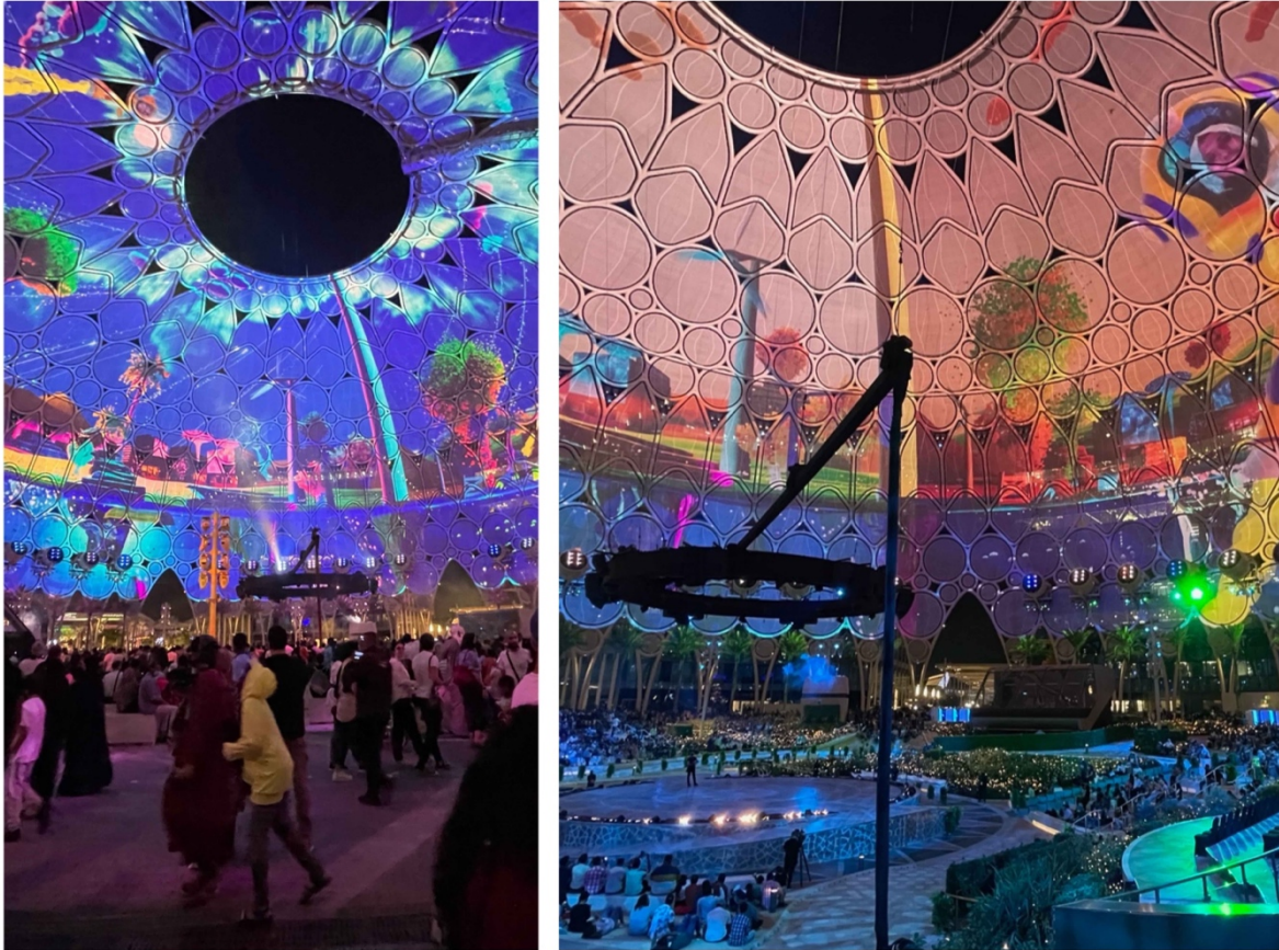
12. Spectacle « sons et lumières » projeté sur le dôme d'Al-Wasl (M. Benchetrit, 2022)

Mais, Festival City ne serait rien sans la mise en spectacle et en événement permanente dont elle fait l'objet. La « fontaine dansante » [ dancing fountain ] joue un grand rôle dans ce processus 5 . Dubaï se targue d'en posséder la plus grande du monde, située au pied de Burj Khalifa – le plus haut gratte-ciel jamais construit – et conçue par l'entreprise Wet Design, qui en a installé plus de 200 dans le monde 6 . La « fontaine dansante » de Festival City se déclenche automatiquement toutes les demi-heures et provoque le regroupement instantané de centaines de personnes. Elle s'anime alors comme par magie, s'illumine et projette des jets d'eau sur le rythme des grands concertos ou des hymnes nationaux. Le spectacle dure quelques minutes seulement, à la suite desquelles le public peut reprendre son activité consommatoire et/ou déambulatoire. Il opère une pulsation qui révèle la volonté de faire événement en rythmant les flux : la foule s'arrête pour regarder le spectacle et reprend son effervescence ensuite.