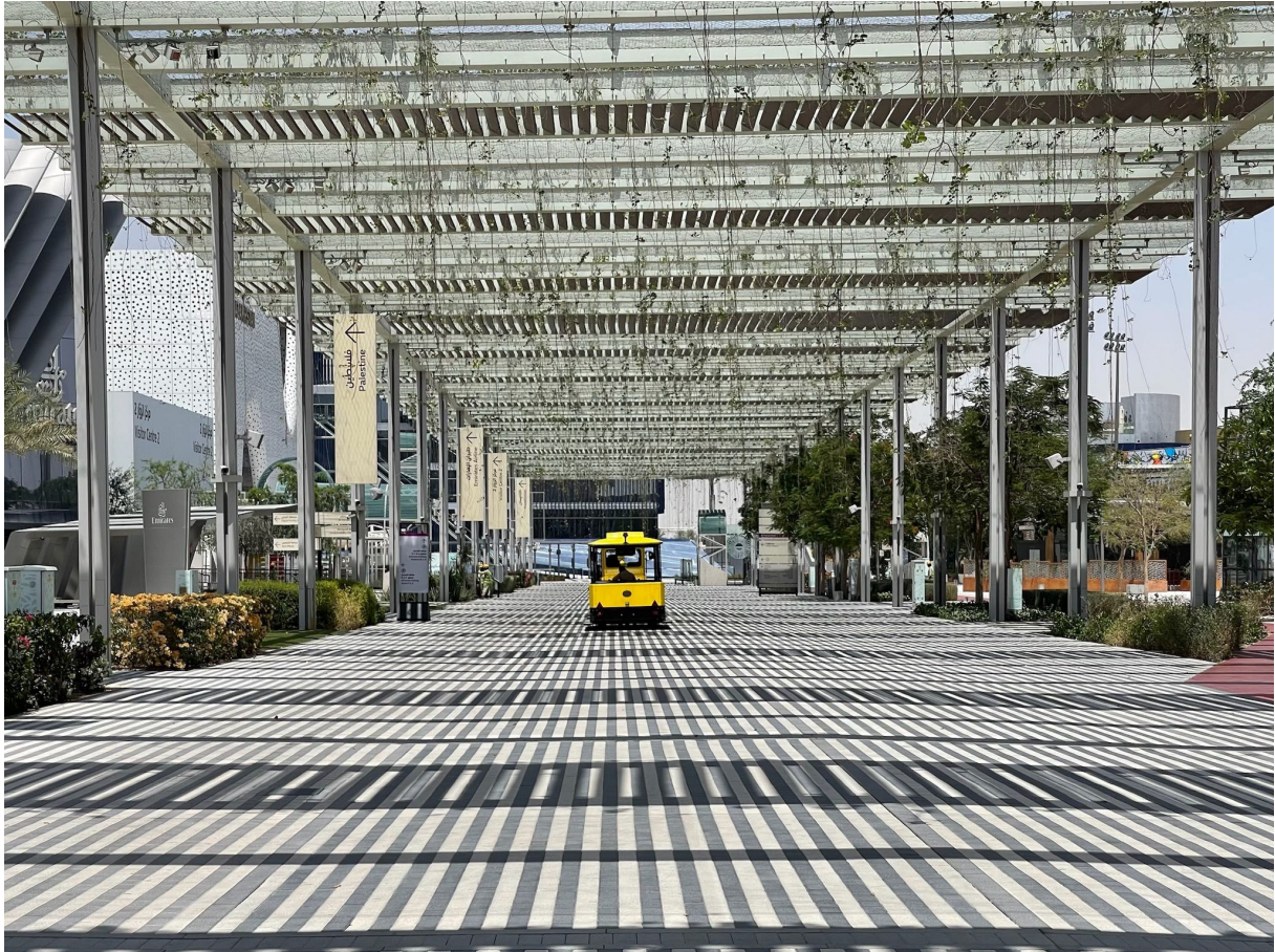
16. Dans les allées centrales de Dubaï Expo 2020 fermée au public, petits trains électriques et buggys offrent un tour gratuit aux futurs investisseurs/résidents d'Expo City

La relance récente de gros chantiers en suspens depuis la crise financière de 2008 – l'aéroport Al-Maktoum, qui ambitionne d'être le plus grand du monde d'ici 2050, une seconde île-palmier artificielle pour laquelle un nouveau schéma directeur a été validé en 2023, le tout au contact de Jebel Ali, le plus grand port artificiel du monde – produit en effet une certaine effervescence sur ces franges de la ville. Désormais desservi par le métro (Fig. 17), le site bénéficie déjà d'une assez bonne intégration urbaine, laquelle n'était pas systématiquement garantie dans le cas de précédents aménagements ex nihilo du même type. La ville-événement fait ainsi progresser les fronts d'urbanisation et renforce finalement l'offre urbaine, touristique et immobilière à laquelle Dubaï a conditionné son développement et la diversification de son économie imposée par la réduction des énergies fossiles (Ponzini, 2019) 7 .