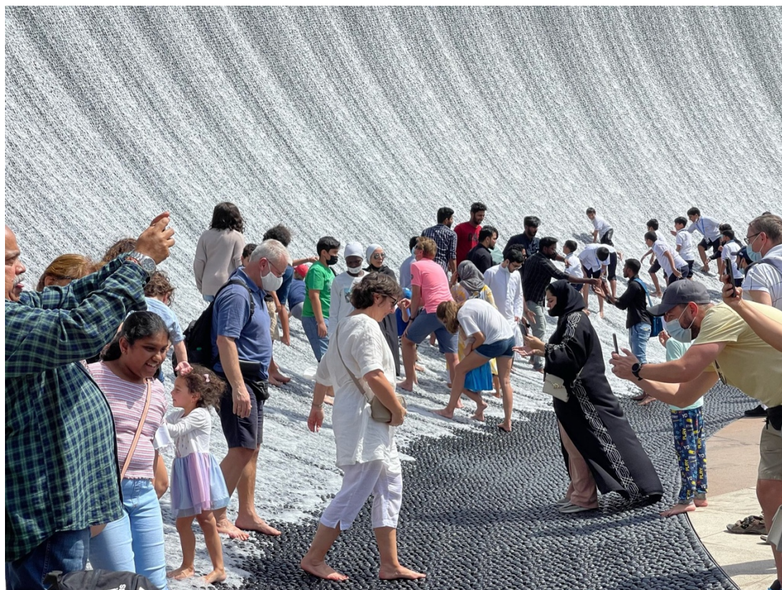
8. La cascade en forme de vague de 18 mètres de haut, événement/attraction phare imbriqué dans celui de l'Exposition universelle, a largement agglutiné quantité de populations résidentes et internationales. La prolifération de prises de vue candides et de selfies renforce l'idée d'une « pratique d'occasion et occasion de pratique » (Bourdieu et al. , 1965), qui a littéralement inondé les réseaux sociaux (M. Benchetrit, 2022)