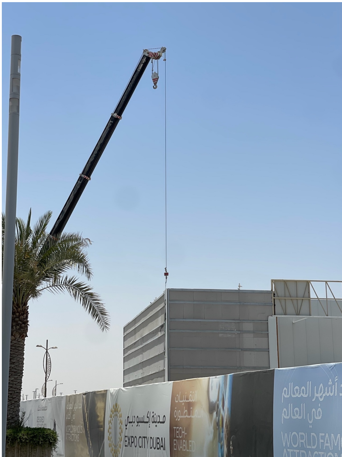
6. Urbanisme d'image à Dubaï Expo 2020 en reconversion : les murs restent, mais les images se superposent

Ces photographies, comme les précédentes de notre corpus conjoint (cf. supra ), se veulent plus globalement être une contribution à la visualisation des formes de l'urbanisation rapide aux ÉAU et, plus largement, dans les pays du Golfe et du Moyen-Orient.