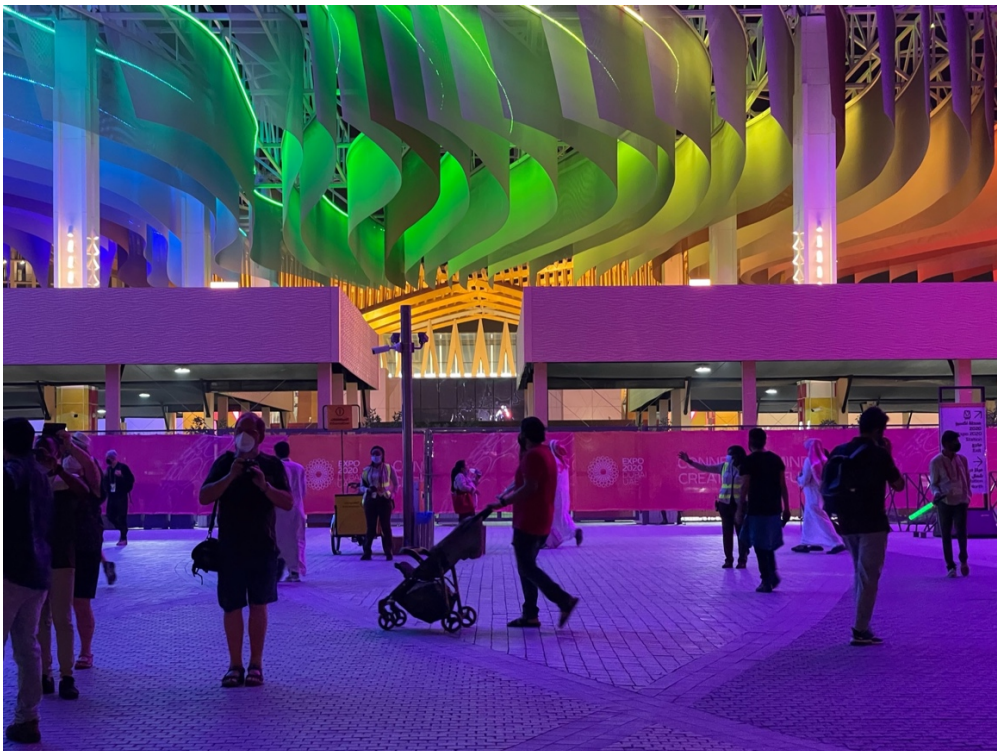
10. Ondulations de béton et de lumières à l'entrée du site de Dubaï Expo 2020. La scénographie lumineuse constitue l'un des artifices majeurs de la mise en expérience de la ville (M. Benchetrit, 2022)

Majid al-Futtaim produit ce que l'on pourrait appeler des méga quartiers- malls événementiels qui repensent le principe du mall , en l'ouvrant plus volontiers sur la ville, en traitant et en paysageant les espaces extérieurs, dans une esthétique portée sur le « style de vie » (Berdet, 2013), en augmentant la dimension spectaculaire et en y multipliant les événements. Le slogan « Great moments, for everyone, everywhere » met l'accent sur le moment plus que sur le lieu, mais aussi sur « l'expérience » du produit commercial plus que sur le produit lui-même.