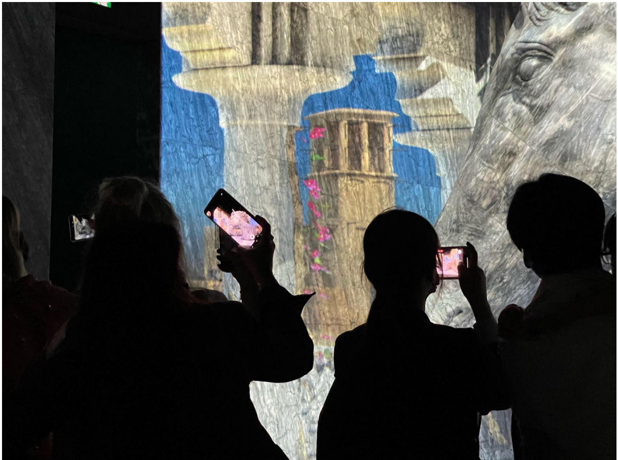
Couverture : Dubaï Expo 2020, Pavillon de la Vision (M. Benchetrit, 2022)

Pour citer cet article : Stadnicki R. et Benchetrit M., 2024, « Faire ville ou refaire événement : le dilemme de Dubaï Expo 2020 », Urbanités , #19 / Urbanités événementielles, en ligne .