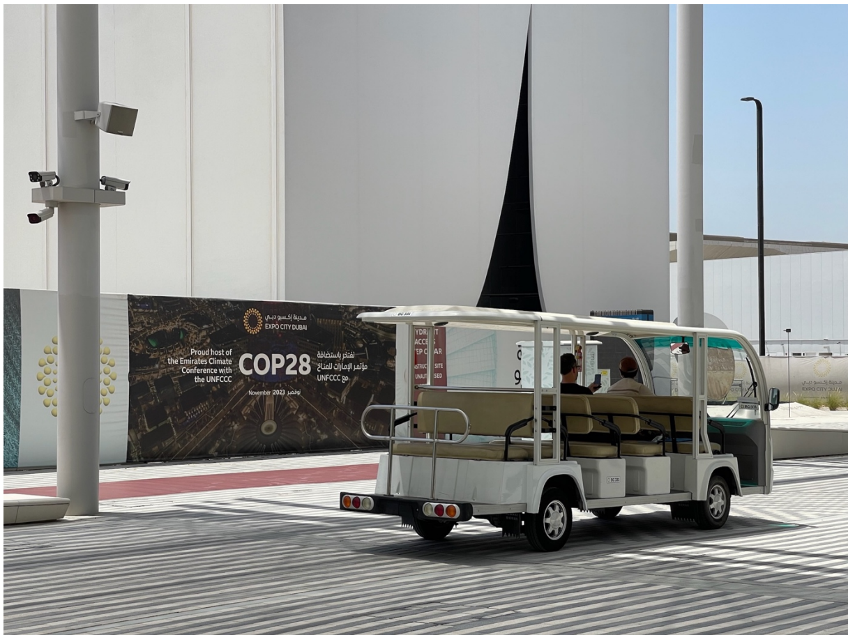
22. Entr'ouverture sur la COP 28. Un nombre important de voitures buggy de la ville seront réquisitionnées (M. Benchetrit, 2023)

Expo City ne devrait pas exister indépendamment de l'événement, elle lui semble même entièrement dédiée, comme le révèle le site internet officiel . La conservation des grands équipements de l'Exposition – le Dubai Exhibition Center, les parkings, la plupart des Pavillons – permet en effet de planifier de futurs événements tels que la COP 28. Le Pavillon Opportunity a déjà été transformé en centre de conférences composé de nombreux auditoriums, qui ont notamment accueilli les manifestations de la Journée mondiale des océans le 8 juin 2023.