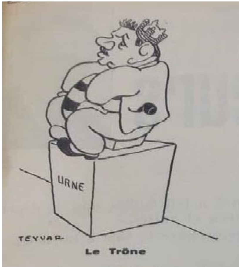
Caricature de Teyvar, L'Avenir Socialiste , 4 mai 1935

par un échec puisqu'elle ne réunit que quelques centaines de personnes contre plusieurs milliers pour la manifestation unitaire, dont de nombreux radicaux [14].