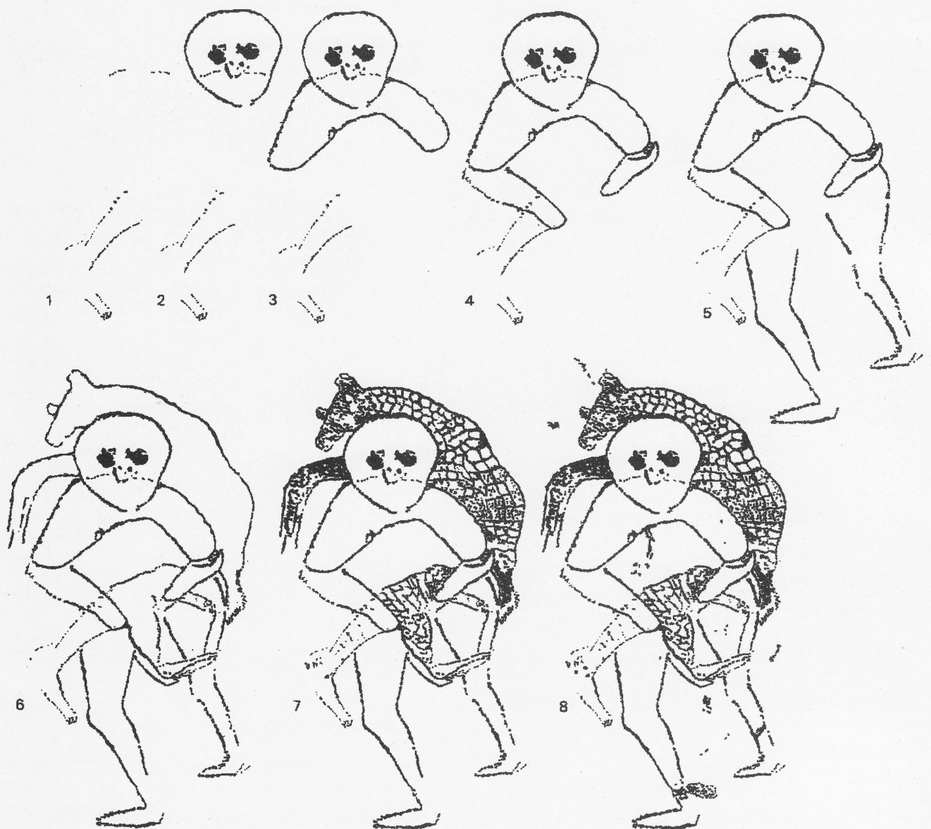
Fig. 4. La construction de la gravure en 8 étapes : 1 - Les restes probables de l'esquisse préparatoire ; 2 - Le masque et, peut-être dans un même élan, les cavités oculaires et l'arc de cercle à l'endroit du nez ; 3 - Les bras ; 4 - Le bracelet et les avant-bras ; 5 - Le fessier, les jambes et les pieds ; 6 - Les silhouettes des animaux ; 7 - Les détails internes ; 8 - Les yeux et les autres trous obtenus par pointillage.

visait pas forcément à suggérer par cet artifice l'existence de détails d'arrière-plan puisque les traits délimitant la tête et le cou de la girafe portée à hauteur de ventre sont, eux aussi, à peine marqués alors qu'ils constituent des éléments de premier plan. Ces tracés superficiels font plutôt penser au reste d'une esquisse ayant permis au graveur de cadrer sa composition ; esquisse qui aurait ensuite guidée en grande partie les percussions plus appuyées de son outil au cours de la finition.