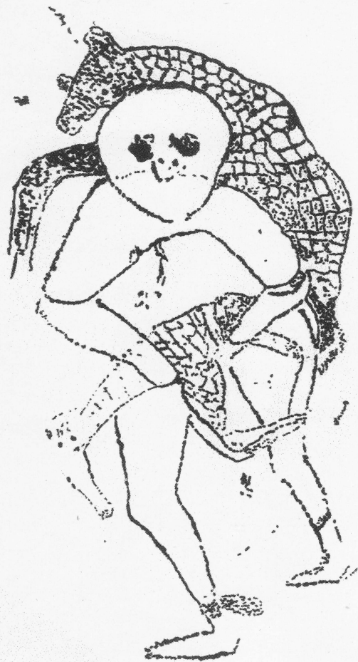
Fig. 3. Personnage masqué se déplaçant avec deux girafes à son contact.

l'orientation et la position de la gravure suggèrent qu'il n'a ni glissé, ni basculé ; auquel cas le graveur n'eut qu'à s'accroupir ou se pencher vers l'avant pour piqueter le granit à grains fins qui se trouvait devant lui à portée de main. Précisons enfin que l'inclinaison de la paroi alliée à la pente du versant rend illisible son œuvre dès lors que l'on s'en écarte seulement de quelques mètres. Ce constat suggère que la préoccupation première de l'artiste fut l'acte même de piqueter la roche et non pas de satisfaire à l'observation immédiate de spectateurs, à supposer seulement qu'il y en ait eu.