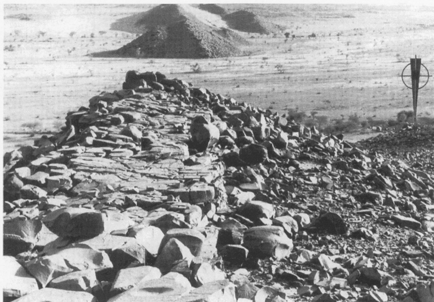
Fig. 2 . Les éperons rocheux d'Issamadanen dominant et barrant en partie la large vallée d'Egharghagh. La flèche indique la position de la gravure faisant l'objet de la présente étude.

avant de s'épandre à l'ouest dans le large fossé du Tilemsi, ancien affluent du Niger, à hauteur de Gao. Les marigots d'Issamadanen qui se forment en ces circonstances sont les derniers de la vallée à s'assécher en raison des seuils rocheux qui, à ce niveau, bloquent les coulées d'eau souterraines. Leur tarissement n'intervient souvent qu'en décembre, soit trois mois après les dernières pluies, alors que la prairie alentour s'est déjà en grande partie desséchée.