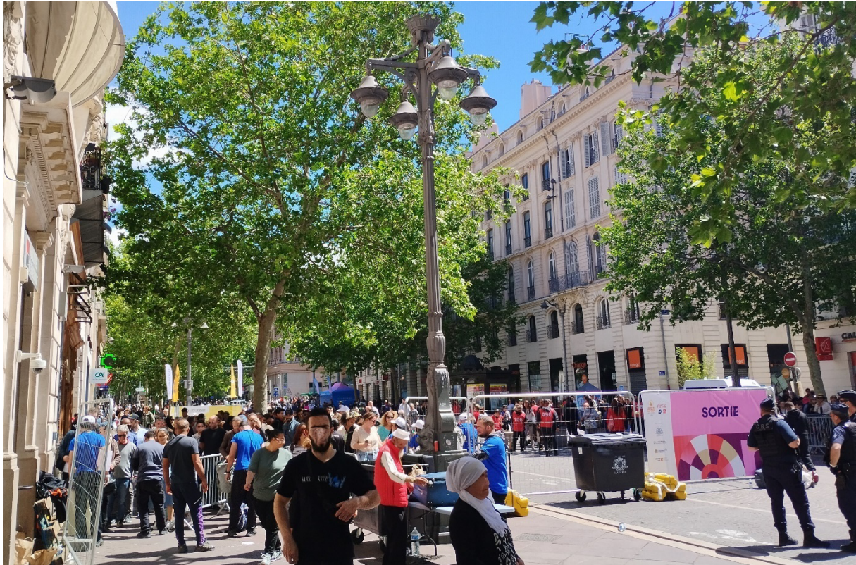
1. Contrôle d'accès sur la Canebière, 8 mai 2024, arrivée de la Flamme Olympique à Marseille