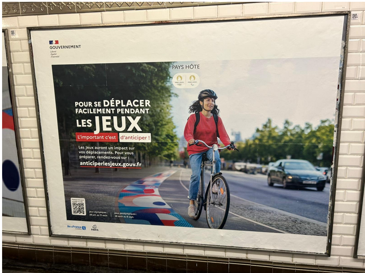
3. Le campagne du gouvernement pour anticiper les déplacements pendant les Jeux olympiques (C. Ruggeri, 2024)

D'après vous, quelles conséquences ces dispositifs mis en place lors des grands événements pourraient-ils avoir à plus long terme sur les espaces publics des villes, et sur les populations qui les fréquentent ?