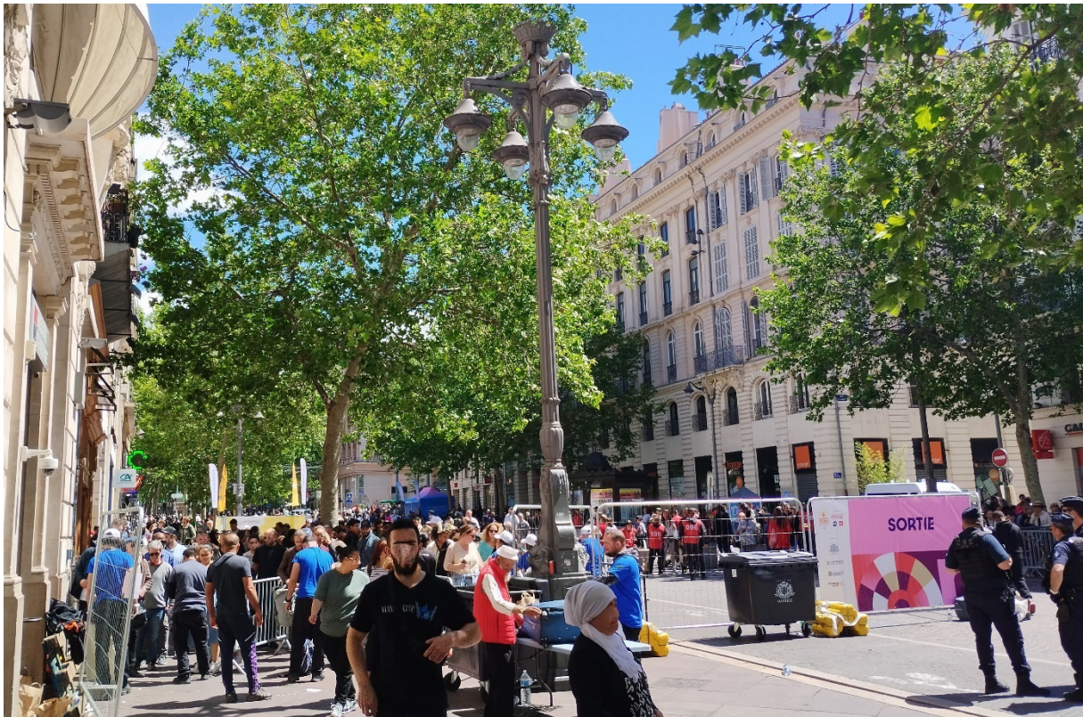
Contrôle d'accès sur la Canebière, 8 mai 2024, arrivée de la Flamme Olympique à Marseille

Entretien avec Myrtille Picaud, par Séverin Guillard, Marie Bonte et Charlotte Ruggeri