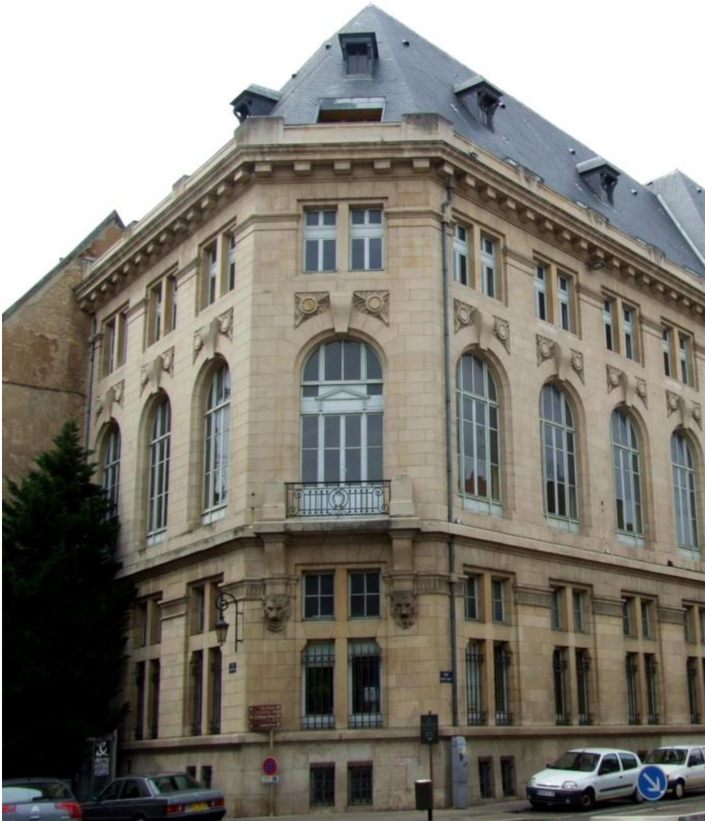
Bâtiment rue Chabot-Charny, 21000 Dijon

La première université en Bourgogne est une école de droit créée en 1722 (ouverte en 1723), qui, après son abandon lors de la période