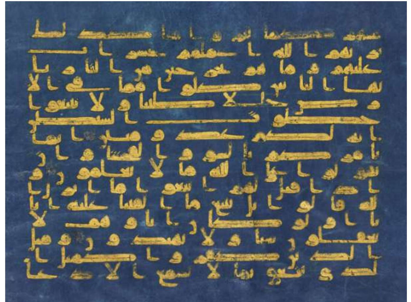
Coran bleu de Kairouan (feuillet).

Perpétuer cette trace est un moyen de nous relier à nous-mêmes : cette liaison dans le temps nous aide, croyons-nous, à faire société ; en nous rattachant au trésor de la culture humaine, elle nous donne de notre passé une image plus heureuse et ce bien-être n'est pas pour rien dans notre désir de vivre les uns avec les autres. Il faut seulement situer dans son contexte la trace ainsi perpétuée, pour éviter l'ironie d'une tentation révisionniste qui guette toujours les meilleures intentions.