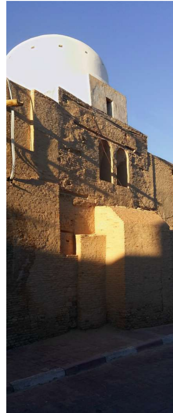
Mosquée de Bled el-Hadhar, construite en 1193 à Tozeur, dans la région du Jérid (Tunisie).

Le courant historiographique dans lequel s'inscrit L'oubli de la cité entendait mettre en relief une réalité historique plus complexe. Inspirée par ce qui fut sans doute un moment majeur de la réflexion en sciences sociales, une génération de jeunes chercheurs franco-maghrébins des années 1980 et 1990 3 s'est