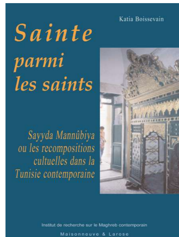
Sainte parmi les saints. Sayyda Mannūbiya ou les recompositions culturelles dans la Tunisie contemporaine, de K. Boissevain (2005), en accès freemium sur OpenEdition.

passant par la sécularisation et la mise à distance, sinon le retrait, du religieux. Les grilles de lecture développementalistes du passé perdaient de leur pertinence si l'on voulait s'attacher à saisir le Maghreb contemporain à travers la loupe des sciences sociales, ce qui était l'objet de l'IRMC. Et l'institut, créé en 1992, a très vite fonctionné comme une caisse de résonance de ces mutations, avec la montée en puissance de programmes et d'activités scientifiques se rattachant de diverses manières à l'étude du religieux.