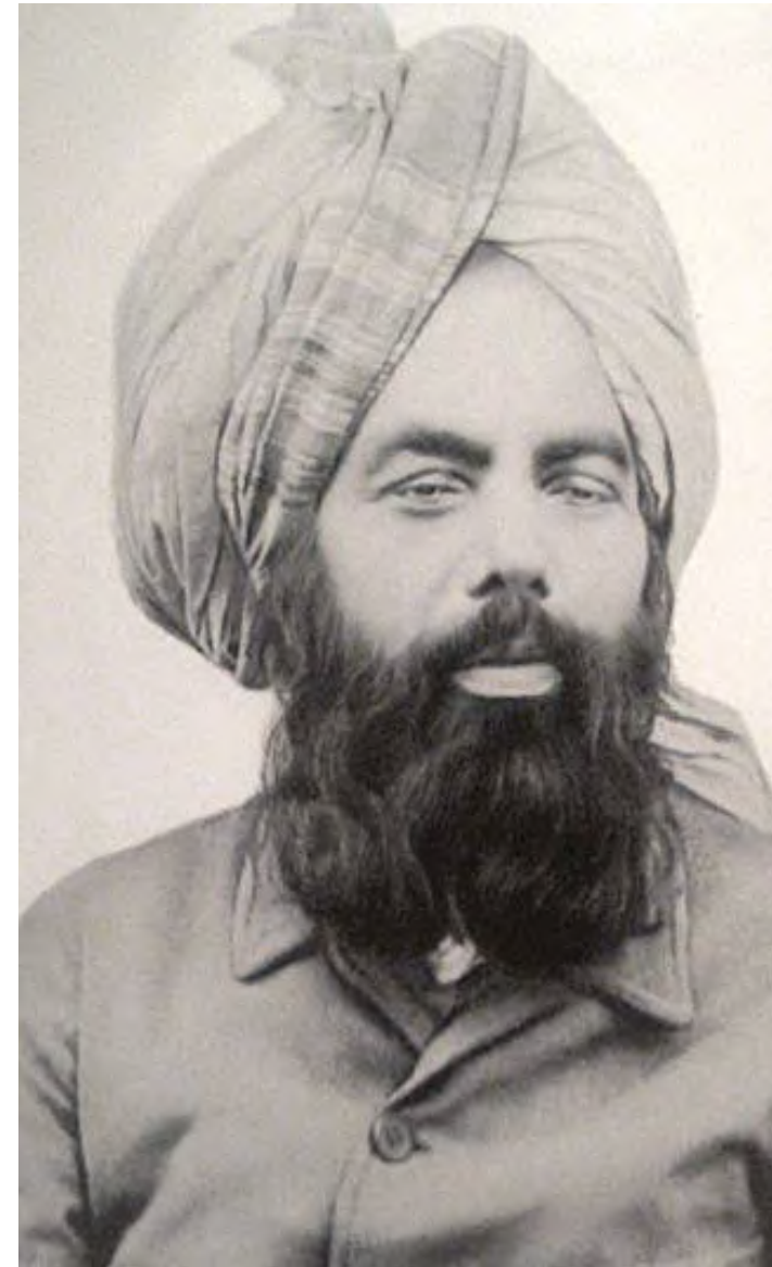
Mirza Ghulam Ahmad, fondateur du mouvement ahmadi.

Je me suis attelée à analyser les dispositions du droit interne algérien, aussi bien public