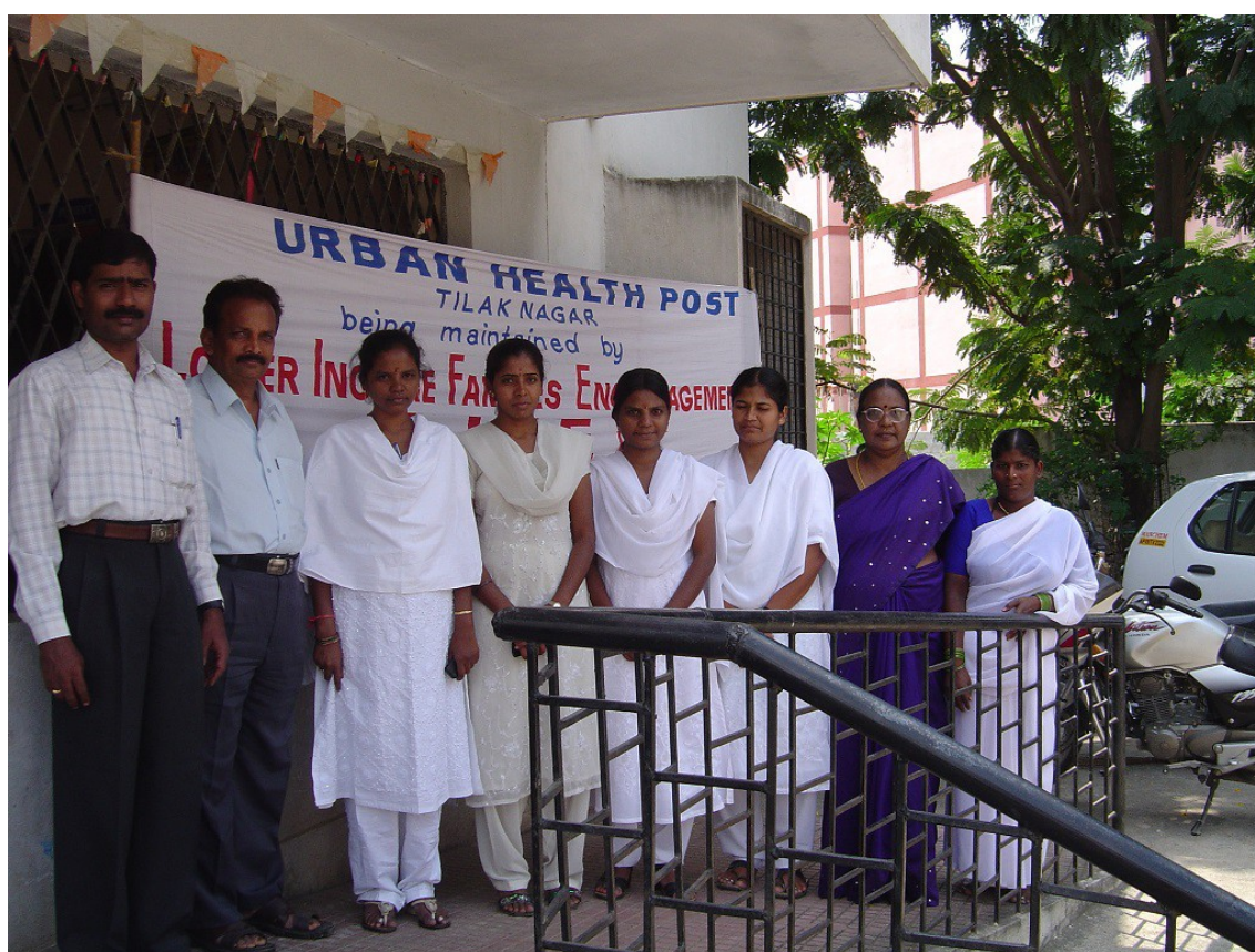
Photo 1 : Clinique à Tilak Nagar à Hyderabad, gérée par une ONG (Kennedy, 2006)

ONG ont alors pris la pleine responsabilité de la gestion des cliniques, y compris l'embauche des infirmières et des médecins sur le « marché » (pas des effectifs fonctionnaires). Par ailleurs, dans le cadre du programme IPP-VIII, les ONG de la ville ont également été mobilisées pour identifier et former des « volontaires » ( link volunteers ) parmi les femmes vivant dans les bidonvilles, une composante centrale du programme. Ces plus de 5 500 femmes ont été chargées d'informer les résidents des bidonvilles des services de soins préventifs et de contraception proposés par la municipalité et de fournir un retour d'expérience aux responsables du service de santé de la municipalité.