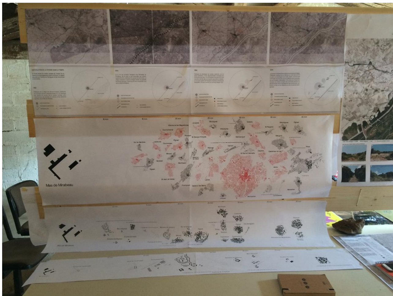
Figure 1 : Restitution de l'approche cartographique du territoire, Fabrègues (34).

Suite à cet ancrage commun sur la question pédagogique en école d'architecture, et à travers des rencontres et des préoccupations propres, un certain nombre de thématiques ou objets d'étude guident les approches de projets. Ainsi, le territoire rural ou péri-urbain, envisagé notamment à travers les mutations agricoles ou la désertification des centre-bourgs, est devenu le support des projets étudiants sur les quatre années passées. Cette orientation est aussi un positionnement par rapport au phénomène de métropolisation. Ainsi, les thématiques de re-territorialisation (avec notamment des affinités pour le mouvement des Territorialistes), de pratiques émergentes et d'économie faible, irriguent notre enseignement.