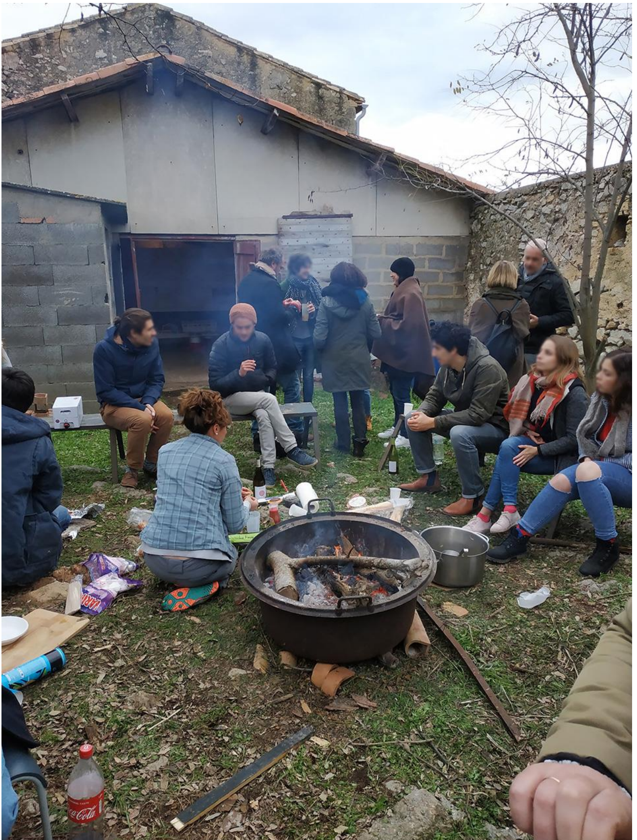
Figure 3 : Installation au Mas de Mirabeau, Fabrègues (34), 2018.

Atelier Hors les murs - Domaine d'études Situation-s à l'ENSA Montpellier.