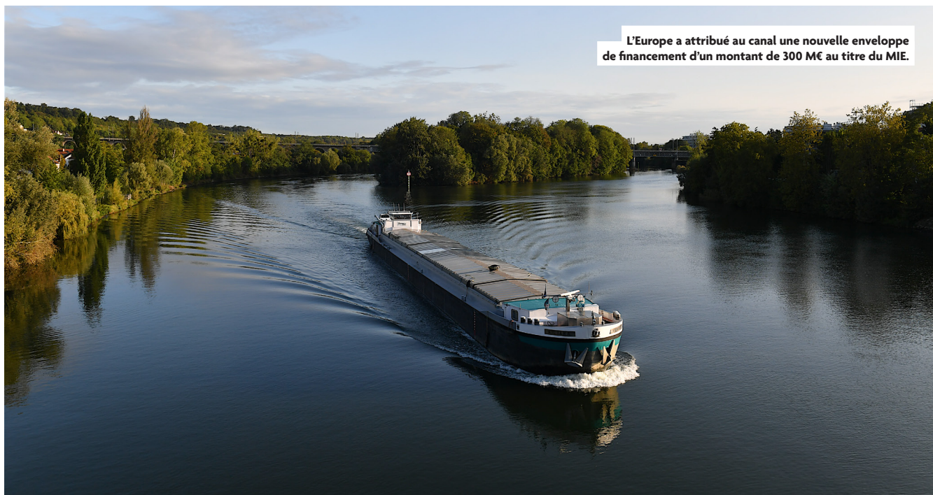
L'Europe a attribué au canal une nouvelle enveloppe de financement d'un montant de 300 M€ au titre du MIE.