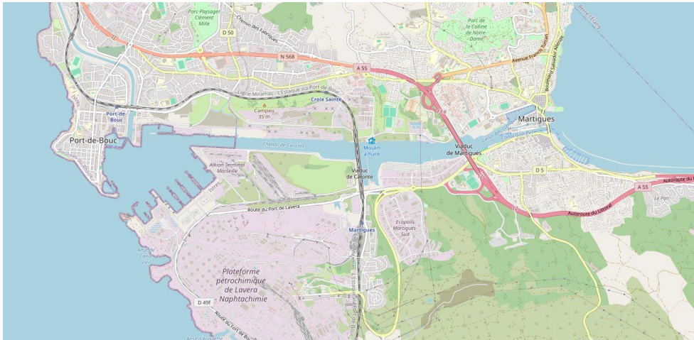
Figure 2. Carte de localisation du chenal de Caronte, entre Port-de-Bouc et Martigues