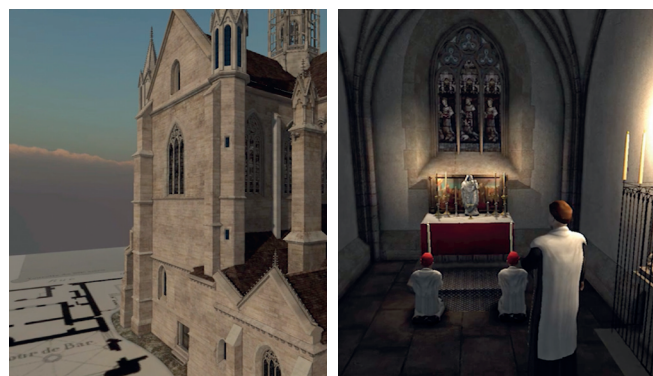
Une capture d'écran de la maquette 3D de la Sainte-Chapelle de Dijon

L'application permet de découvrir toutes ces pièces musicales des XV e et XVI e siècles dans une acoustique spatialisée reproduisant la propagation du son dans l'édifice en fonction des déplacements de la caméra (virtuelle) et des protagonistes.