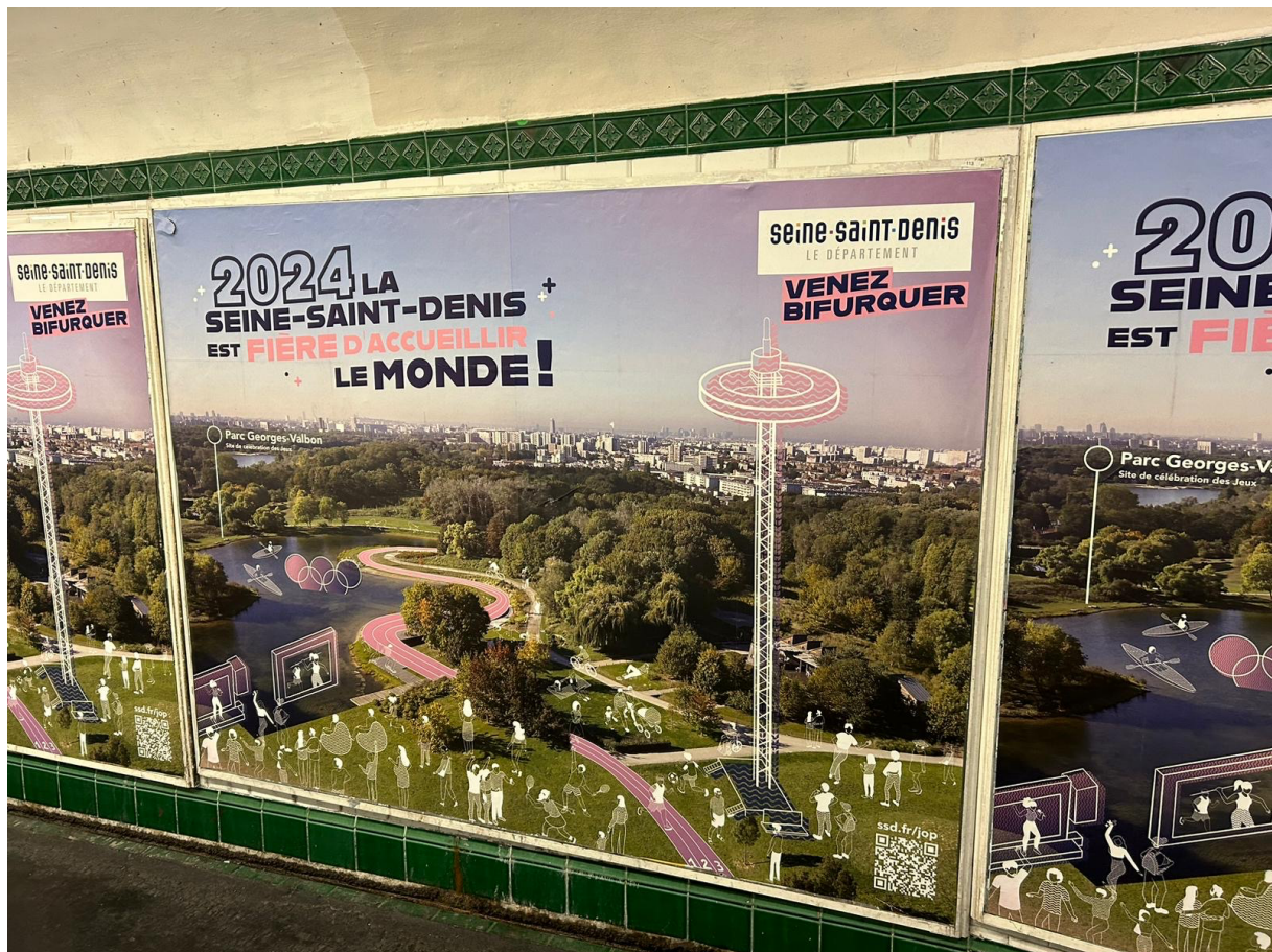
4. Campagne du département de la Seine-Saint-Denis sur l'accueil des Jeux olympiques (C. Ruggeri, 2024)

Cela se fait aussi en parallèle des projets ANRU (Agence nationale de la rénovation urbaine), comme le quartier Franc-Moisin et le centre-ville. On assiste donc à une accélération massive des projets, ce qui est d'ailleurs revendiqué par les élus comme une « chance » .