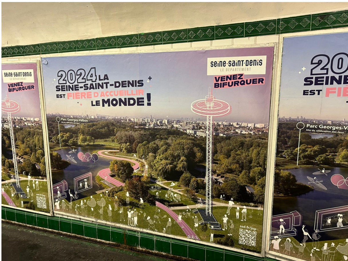
4. Campagne du département de la Seine-Saint-Denis sur l'accueil des Jeux olympiques (C. Ruggeri, 2024)

Cela se fait aussi en parallèle des projets ANRU (Agence nationale de la rénovation urbaine), comme le quartier Franc-Moisin et le centre-ville. On assiste donc à une accélération massive des projets, ce qui est d'ailleurs revendiqué par les élus comme une « chance » .