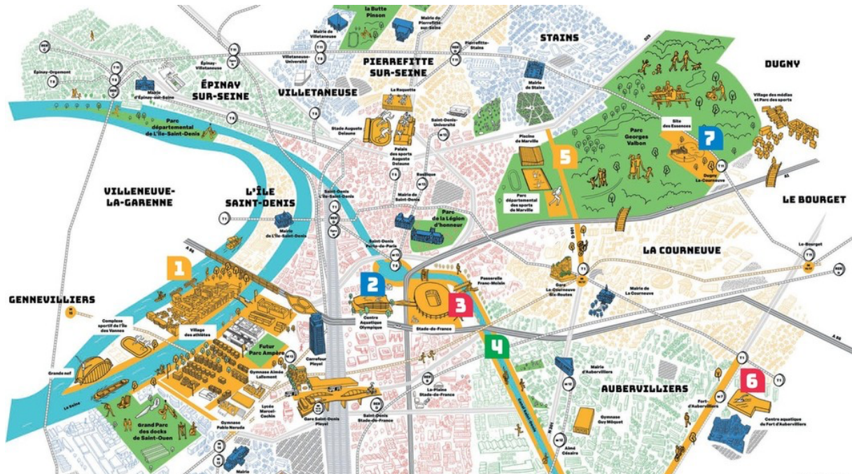
2. Les sites olympiques à Saint-Denis et dans les communes du nord de la Seine-Saint-Denis

Ce village est desservi par un nouvel échangeur autoroutier, financé à hauteur de 95 millions d'euros par la SOLIDEO (Société de Livraison des Ouvrages Olympiques). Il est considéré par le directeur de la SOLIDEO comme indispensable pour relier le village des athlètes aux sites de compétition. Mais il représente une pollution supplémentaire dans le quartier Pleyel. Ce quartier est situé un peu à l'écart du reste de la ville, dont il est séparé par l'A86 et le faisceau ferré nord. De ce point de vue, il se situe davantage en continuité avec Saint-Ouen. Un autre quartier, dont le projet est encore flou, est prévu autour du Centre Aquatique Olympique à l'horizon 2030. Sa maîtrise d'ouvrage revient à la Métropole du Grand Paris, qui inaugure là son activité d'aménagement.