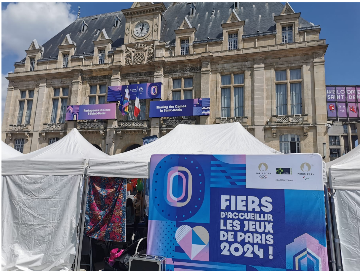
Couverture : Campagnes de promotion pour les Jeux olympiques de Paris 2024, à l'occasion de la fête des enfants, devant la mairie de Saint-Denis