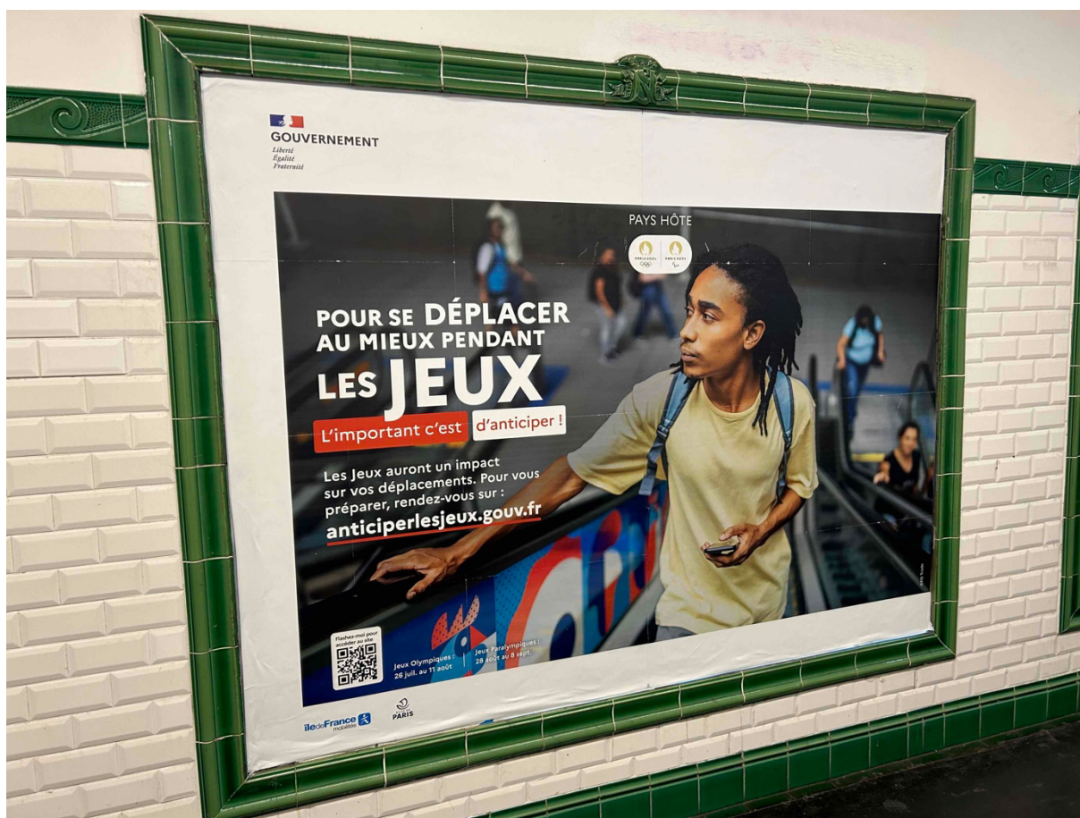
3. Campagne de publicité du gouvernement pour « anticiper » les déplacements pendant les Jeux olympiques (C. Ruggeri, 2024)

Une partie de la ville sera interdite à la circulation, avec différentes zones dont certaines quasiment inaccessibles aux véhicules et avec QR codes pour les résidents (autour du village des athlètes dans le quartier Pleyel et aux abords du Stade de France). Les transports vont être complètement saturés par le public des Jeux olympiques ce qui est une source d'inquiétude majeure pour les habitant·es de Saint-Denis qui travailleront et qui statistiquement partent beaucoup moins en vacances que les autres Francilien·nes. On s'attend en quelque sorte à une forme d'assignation à résidence, laquelle pouvant par exemple déjà se lire dans les affiches que l'on voit dans les couloirs du métro, où les travailleur·ses sont incité·es à « anticiper » ou « télétravailler ».