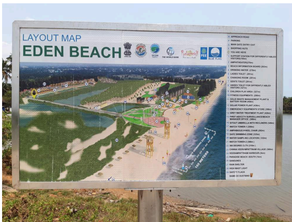
Illustrations 3: Eden Beach

Photos : Anthony Goreau-Ponceaud, 30 mars 2022.