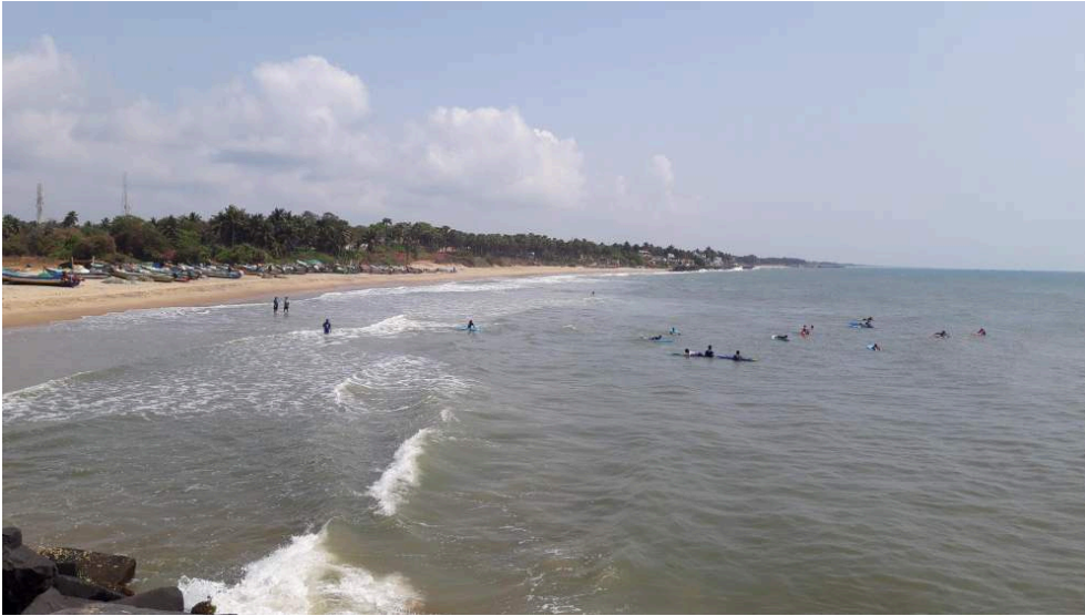
Illustration 1 : Nord de Serenity

Photos : Anthony Goreau-Ponceaud, 29 mars 2022.