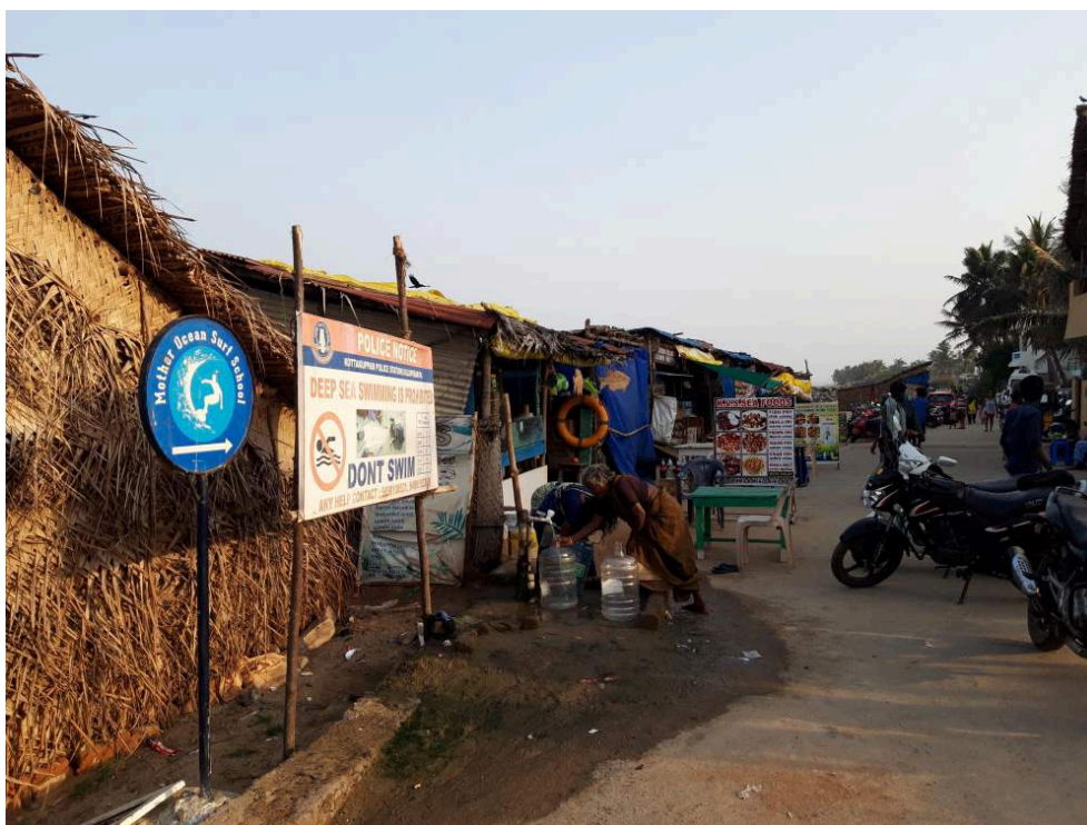
Illustration 5 a