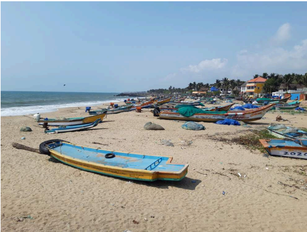
Illustration 2: Sud de Serenity