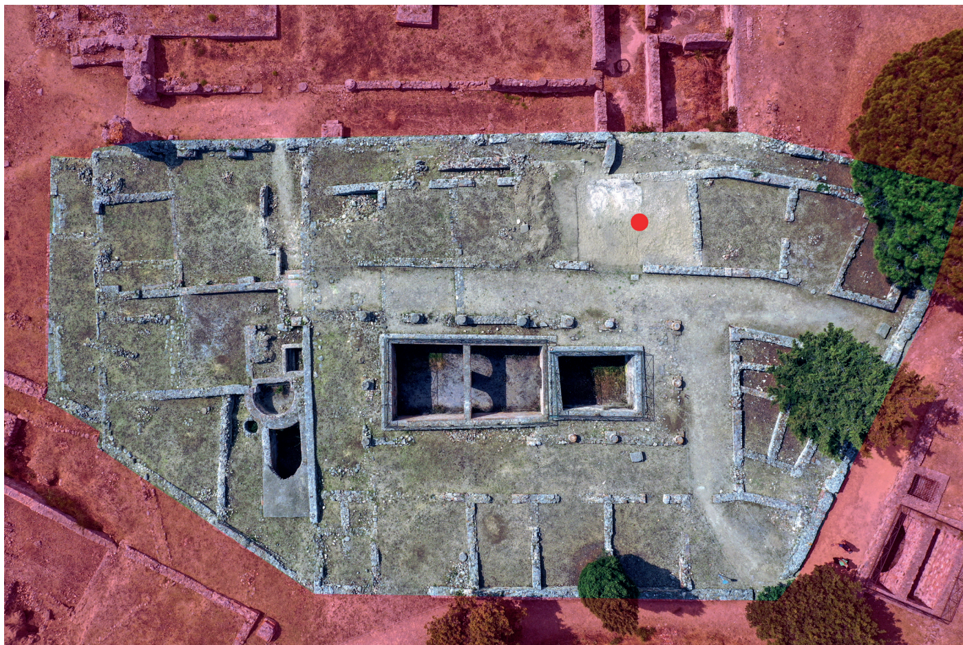
Fig. 2. La domus au balneum / ensemble archéologique n°04. Le point rouge indique la pièce 10034.

que ce pavement recouvrait le mur méridional de la pièce (MR 1102). Il ne fait donc aucun doute que le plan proposé est inexact et que la pièce se prolongeait vers le sud dans l'espace 10039, situé entre l'aile méridionale de la domus et le « prétoire ». Il faut donc se réinterroger sur le plan de cette pièce.