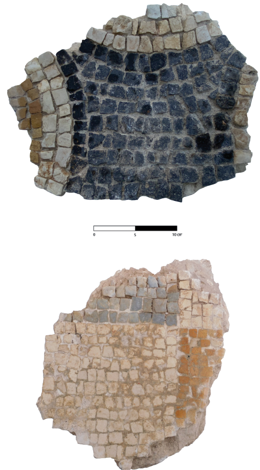
Fig. 5. Fragments de mosaïques conservés dans la réserve du pénitencier de Casabianda.

À l'issue de cette première mission, l'équipe a recommandé de renforcer les bordures de la mosaïque de la domus au Balneum par des solins, puis de la recouvrir d'une couche de sable et d'un géotextile en attendant sa dépose, que l'on espère rapide eu égard à l'état de conservation alarmant.