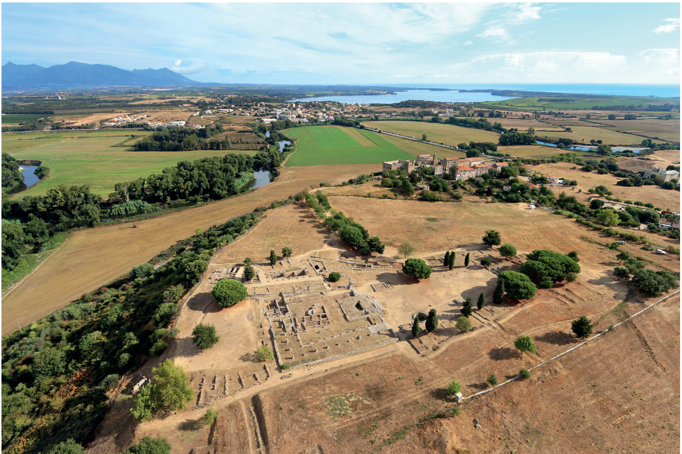
Fig. 1. Vue aérienne d'Aléria.

nombreux remaniements. Plus récemment, depuis 2011, celle-ci fait l'objet d'un programme de recherche dont l'objectif est de réaliser une nouvelle base documentaire axée sur son bâti et son urbanisme 2 .