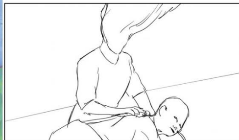
Violaine Baraduc, Tout les oblige à mourir : L'infanticide génocidaire au Rwanda en 1994 (Paris : CNRS Éditions, 2024). Couverture du livre et esquisse préliminaire.