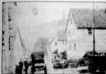
Illustration 11b. La rue de village photographiée à travers une grille