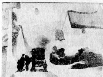
Illustration 11c. La même rue de village pour l'œil d'une mouche