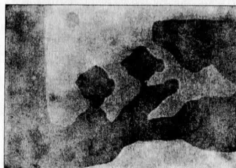
Illustration 11d. La rue de village pour l'œil d'un mollusque