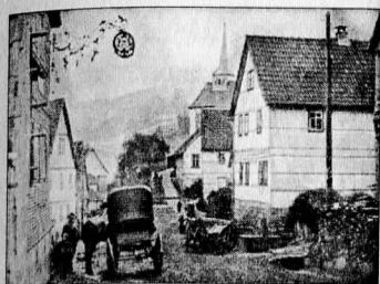
Illustration 11a. Photographie d'une rue de village