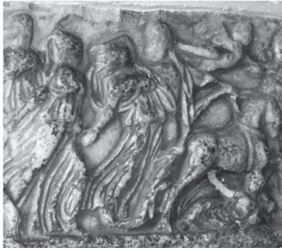
Fig. 3 – Détail du même sarcophage (cf. partie encadrée dans la fig. 1) : le rapt de Proserpine par Pluton sur son char.

À l'endroit où la plupart des autres sarcophages de ce groupe arborent la silhouette de Déméter tenant une torche sur un bige (extrémité gauche, entourée dans la fig. 1), le sarcophage de Mazara del Vallo présente un semeur miniaturisé (proportion hiérarchique devant le distinguer des personnages divins), accomplissant le geste typique des semailles avec son bras droit et précédé, au registre supérieur, par un laboureur qui accompagne deux bœufs traînant la charrue (fig. 2). Cela crée une résonance évidente et signifiante avec le rapt, figuré à l'extrémité opposée du sarcophage (encadrée dans la fig. 1), qui est par là assimilé à l'enfouissement des semences dans la terre.