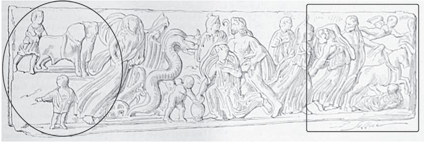
Fig. 1 – Dessin du sarcophage de la cathédrale de Mazara del Vallo, tiré de Daremberg et Saglio 1877, s.v. Ceres , « X. L'enlèvement de Perséphone/Proserpine ». À droite (encadré, cf. fig. 3), Pluton enlève Proserpine depuis son char ; à gauche (entouré, cf. fig. 2), un petit semeur enseme un champ en suivant un laboureur accompagné de deux bœufs.