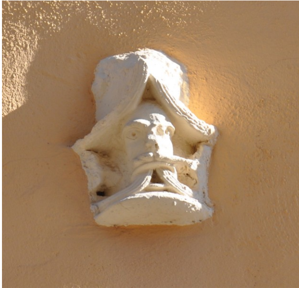
Fig. 17a : Aniane, fragment de chapiteau en remploi.