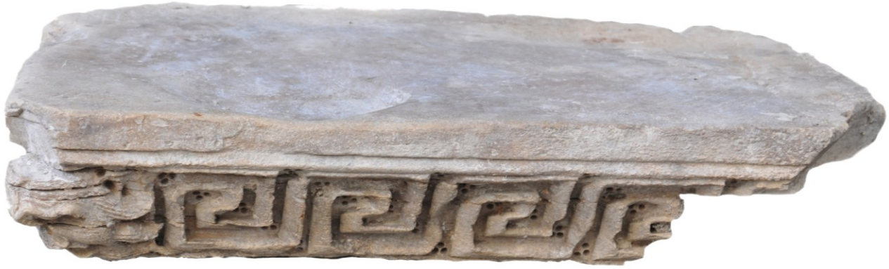
Fig. 2a : Le tailloir d'Aniane, face A : frise grecque et décor au trépan. On remarquera l'usure de la table supérieure et le creusement d'une cupule, imputables au remploi de l'œuvre.

Recherches et d'Études du Clermontais soit enfin retransférée et finalement stabilisée au sein du « pôle patrimonial » de l'ancienne abbaye d'Aniane, selon un projet attendu depuis plus d'une décennie désormais 6 . L'enjeu n'est pas mince si l'on considère que d'autres œuvres ont trouvé leur place, outre Atlantique à Manhattan mais aussi en Pennsylvanie. Elle a été présentée par ailleurs au public, à Aniane même, lors des Journées Européennes du Patrimoine en 2022 et plus récemment encore au musée archéologique Henri Prades de Lattes et de la métropole de Montpellier dans le cadre de l'exposition « Septimanie. Languedoc et Roussillon de l'Antiquité au Moyen Âge » 7 .