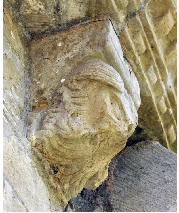
Fig. 7 : Abbaye de Saint-Papoul (Aude). Modillon du chevet (Cliché L. Schneider 2023)

Enfin, indice que des carnets de modèles pouvaient circuler autant que les artistes eux-mêmes, on remarquera que des transferts plus lointains ont pu s'opérer. Ainsi le linteau sous le tympan dit de la « Transfiguration » de la Charité-sur-Loire (Nièvre) comporte lui aussi une longue frise grecque. Et celle-ci est très proche de celle du tailloir d'Aniane, d'autant qu'y figure précisément ce motif des trois points réalisés au foret et disposé en lignes diagonales dans les délaissés du ruban 14 . Le linteau sous le tympan de la Vierge décline lui aussi une décoration au trépan associée à une frise de grecques 15 .