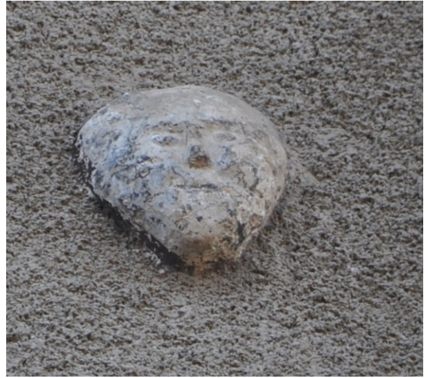
Fig. 23a : Aniane, 9 rue Vieille.

erratiques longtemps inaperçus appartiennent à un second cloître (hypothétiquement situé entre la basilique Sainte-Marie et l'abbatiale Saint-Sauveur), sinon à un agrandissement ou une réfection du cloître du XII e s. Quoiqu'il en soit, ces éléments témoignent de nouvelles dynamiques et de nouveaux chantiers ouverts à Aniane, d'un changement d'esthétique et de modèle économique aussi. Ils révèlent et soulignent dans le processus de récupération qui nous occupe d'autres trajectoires, plus locales. Ici le démontage organisé est manifeste car on a pu inventorier plus d'une vingtaine de colonnes durant ces dernières décennies. Les œuvres remployées, plus modestes, ont surtout servi à l'aménagement de nombreuses pergolas, celles-ci manifestant ce goût anianais pour les jardins de ruines et la mémoire de l'abbaye ( Fig. 24 ). Elles ont échappé de fait à la prédation des marchands. Mais