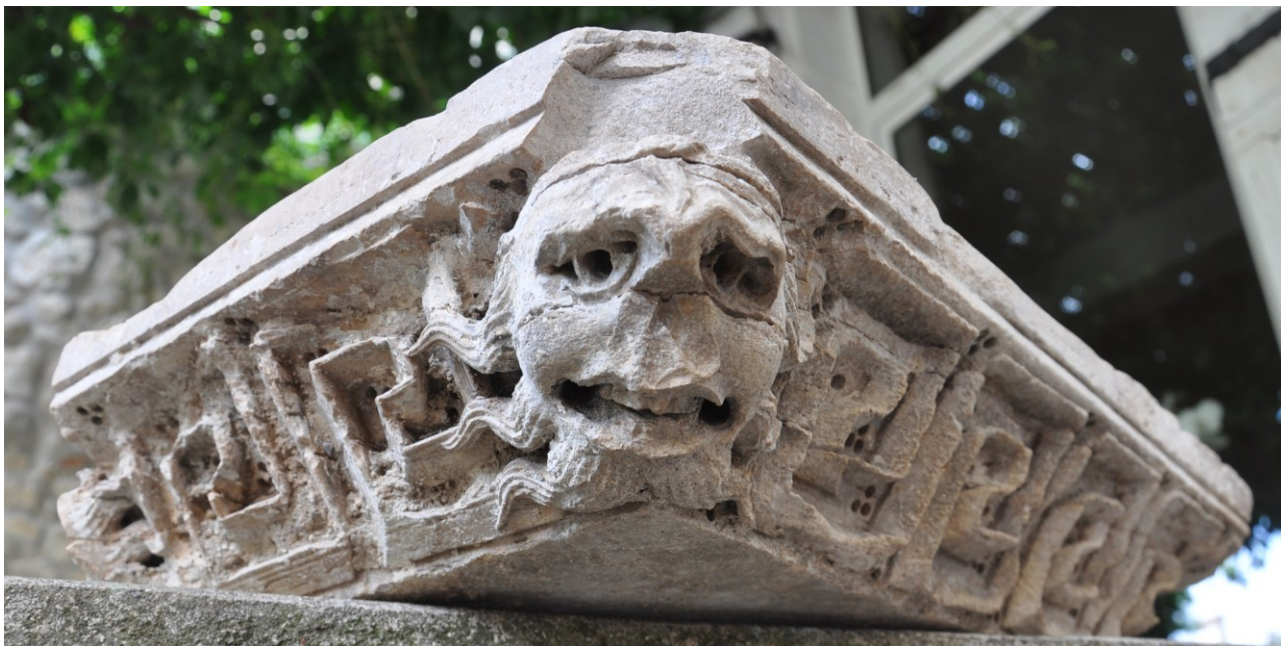
Fig. 1 : Le taillor de la place de la mairie à Aniane.

En juillet 2022, l'EPCI 1 Vallée de l'Hérault a fait l'acquisition, grâce au soutien du Ministère de la Culture et du département de l'Hérault, d'un taillor roman mis à la vente dans une galerie parisienne des quais de Seine mentionnant simplement la ville de Ganges dans l'Hérault, comme origine de provenance.