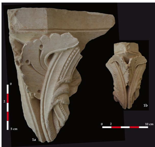
Fig. 13 : Aniane, ancienne abbaye. Fragment de chapiteau n°23212-1 (Doc. CNRS, L. Schneider 2013).

Pour la première fois un contexte archéologiquement stratifié et documenté a pu être identifié à Aniane. Les œuvres, mêmes fragmentées et mutilées, montrent l'éclat et la diversité de la production anianaise 21 : entrelacs, rinceaux végétaux, chapiteaux d'acanthes, chapiteaux et plaques à décor narratif... (Fig. 10, 11 et 12). Des fragments d'autres chapiteaux à rinceaux sophistiqués de lianes ou de vignes rappellent par ailleurs une œuvre conservée outre Atlantique, cette fois-ci au sein de la collection Pitcairn du Glencairn Museum de Bryn Athyn en Pennsylvanie 22 . Achetée à Henri Daguerre marchand d'art parisien en 1920, la pièce est attribuée là encore à Gellone. Elle montre cependant un traitement des lianes identique à ceux fragmentaires désormais découverts en contexte à Aniane (Fig. 13). On notera tout particulièrement ces fines ciselures en dents de scie présentes sur les fragments anianais mais également sur le ruban des grecques du tailloir de la rue de la Mairie. Par ailleurs, le traitement de la coiffure godronnée de l'un des personnages noyés dans la composition végétale de ce très beau chapiteau évoque lui aussi, une tête humaine associée à un autre chapiteau découvert à Aniane (Fig. 14).