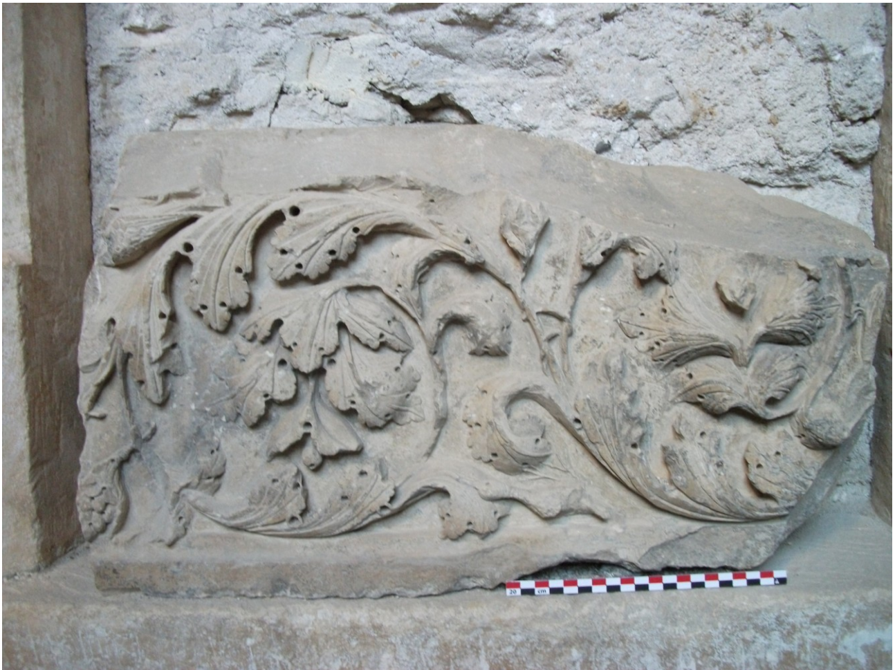
Fig. 17b : Aniane, bloc ouvragé découvert en remploi rue du Mazel. Inscrit au titre des monuments historiques (n°1HOM1624).

Cette maison, localement surnommée « le petit cloître » car il s'agit d'un hôtel particulier à galerie du XV e s. se situe dans le prolongement de la rue droite (aujourd'hui de Montpellier). Sise à proximité de l'abbaye, elle bordait au XV e s. l'ancienne place de la basilique Sainte-Marie et l'une des portes de l'abbaye. Frédéric Mazeran nous a signalé ici, la présence d'un bloc ouvragé de très belle facture qui a été inscrit au titre des Monuments Historiques le 11 septembre 2011. Le propriétaire que nous avons rencontré nous a présenté l'œuvre deux ans plus tard et signalé que celle-ci avait été découverte lors de la réfection d'une marche d'escalier des galeries de la cour 29 . Il s'agit d'un fragment de pilastre (ou de linteau ?) (90 x 60 x 40 cm). Le décor