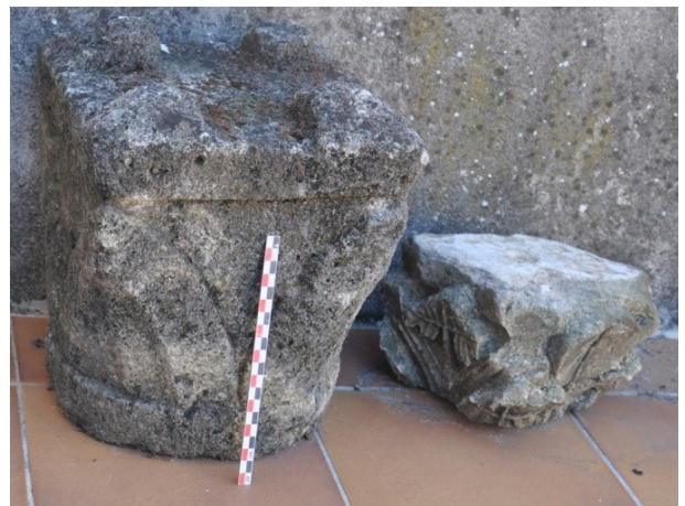
Fig. 32 : Aniane, chapiteau de la rue E. Sanier.