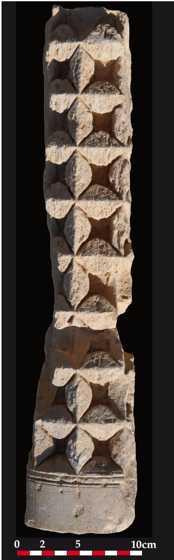
Fig. 16 : Aniane, ancienne abbaye. Fragment de colonnette à décor géométrique recherché n°23213-2 et 4. (Doc. CNRS, L. Schneider 2013).