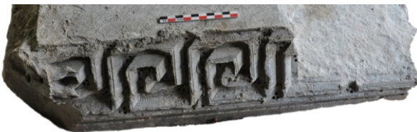
Fig. 4a et 4b : Le tailloir d'Aniane, face C