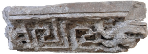
Fig. 3a et 3b : Le tailloir d'Aniane, face B

Sur ce petit côté les mèches de la barbe et de la chevelure du vieillard ou du personnage ensauvagé s'enchaînent sur de nouvelles grecques présentées en deux panneaux. Le ruban est ici surligné par des fils incisés qui prolongent, se confondent et rappellent le détail des mèches de la barbe et de la chevelure. La paroi non restaurée est encombrée du ciment lié au remplissage de la pièce, mais l'on distingue sans peine les diagonales du motif triangulaire à trois points réalisées au trépan.