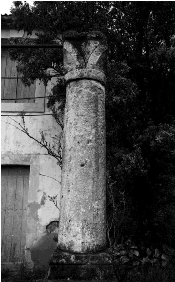
Fig. 30 : L'une des colonnes du mas de la route de la Boissière avec chapiteau massif.

On peut rattacher là encore ces œuvres, obtenues dans un calcaire grisâtre, tendre et très coquillier, aux séries précédentes : chapiteaux à corbeille quadrangulaire, habillée de feuilles d'eau aux angles, abaque carré et astragale circulaire. D'une hauteur de 25 cm, ces chapiteaux adoptent néanmoins un aspect plus massif, renforcé par le traitement en bandeau de l'astragale et de l'abaque qui atteignent 5 cm de hauteur (Fig. 30 et Fig. 28 n° 21, 24 à 29).