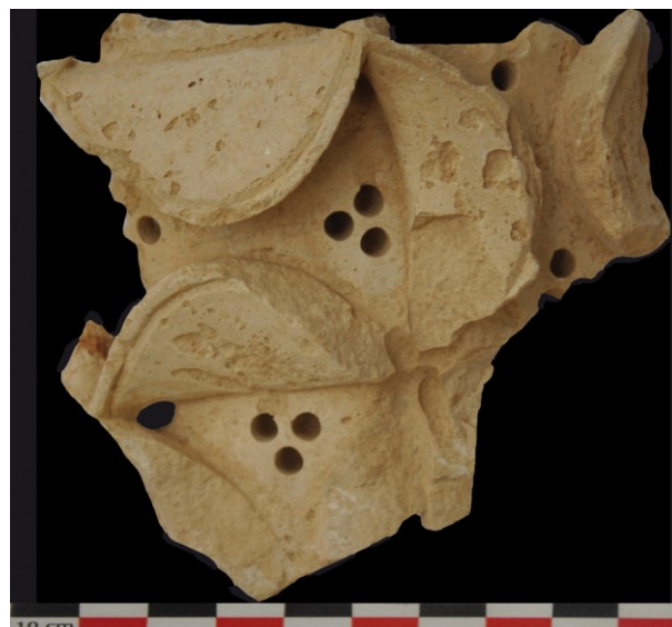
Fig. 15 : Aniane ancienne abbaye. Fragment de colonne gainée (Us.30820) déclinant un motif triangulaire réalisé au trépan (Doc. CNRS, L. Schneider 2013).

Mais c'est un plus modeste fragment de sculpture qui apporte encore une contribution possible, sinon essentielle, à une recontextualisation plus générale.