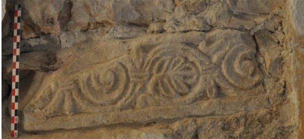
Fig. 8 : Aniane ancienne abbaye. Bloc préroman ou roman sculpté remployé au XVII e s. dans une maçonnerie de l'établissement mauriste.

aussi que des blocs et des pierres diverses ont pu être employés dans les nouvelles constructions (Fig. 8), que d'autres demeuraient enfouis dans les sols tandis que des parties de l'ancien complexe monastique ont été sécularisées durant le dernier tiers du XVI e s. Cela est évoqué notamment par l'installation de familles de potiers qui ont construit leurs fours dans les décombres, entre la basilique Sainte-Marie et l'abbatiale du Sauveur notamment 19 .