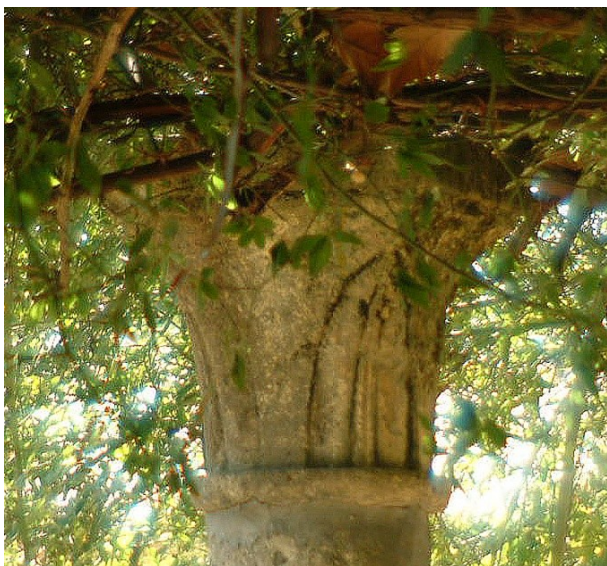
Fig. 26 : Détail de l'un des chapiteaux de la pergola dites de la « Vigne Ramon » (Cliché L. Schneider 2004).