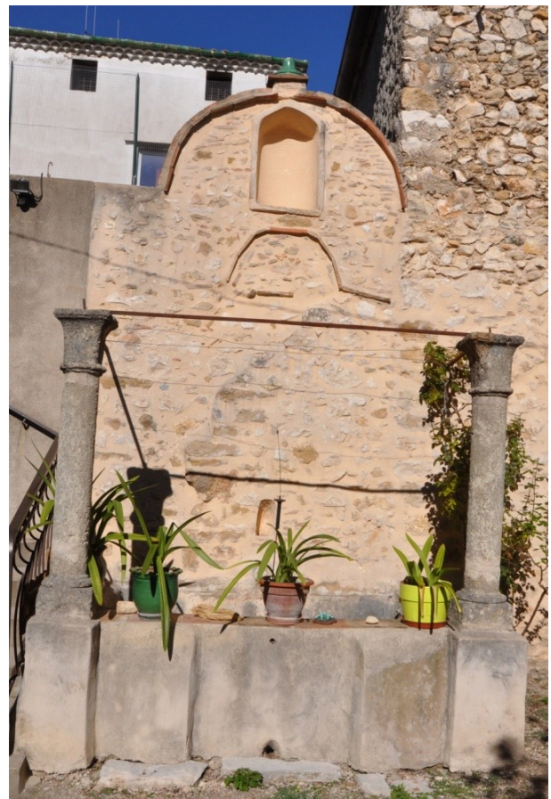
Fig. 27 : Aniane, rue du Fesc, aménagement de jardin remployant colonnes et chapiteau à feuille d'eau.

On retient en premier lieu, une recomposition qui associe deux colonnes, chapiteaux et bases à l'aménagement d'un bassin de fontaine ( Fig. 27 et Fig. 28, blocs 12 à 17 ). Les chapiteaux d'une hauteur de 33 cm sont formés d'une corbeille quadrangulaire à galbe concave, habillée aux angles de feuilles d'eau lisses, taillées dans le corps du chapiteau. L'abaque de forme carrée (30 cm), de faible hauteur (3 cm) est précédé d'une petite lèvre de 1 cm.