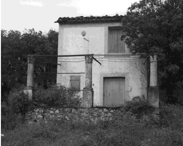
Fig. 29 : Aniane, mas de la route de La Boissière.

À la fin des années 1980, un petit mas situé route de La Boissière, non loin de l'ancienne chapelle Saint-Lazare était encore associé à une pergola de trois colonnes avec bases et chapiteaux que nous avons pu voir (Fig. 29). Elles ont été démontées depuis et réinstallées en partie dans un pavillon, chemin de Saint-Rome.