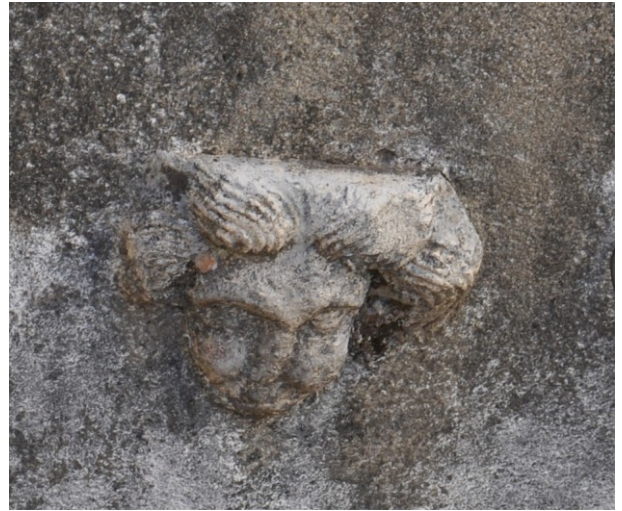
Fig. 23b : Aniane, cour privée, tête juvénile.