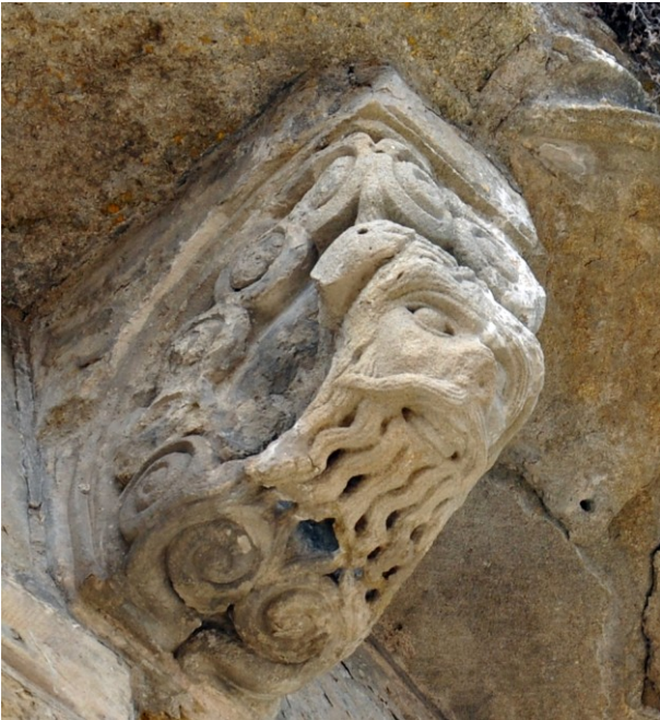
Fig.6 : Abbaye de Saint-Papoul (Aude). Modillon du chevet

Une autre œuvre possiblement attribuée au « Maître de Cabestany », soit un modillon de l'abbaye de Saint-Papoul dans l'Aude offre d'autres éléments de comparaison et d'influence 11 . Ici la sculpture est érodée mais l'on distingue sans peine une tête d'homme à barbe abondamment longue organisée en mèches distinctes, une chevelure longue également, des sourcils pileux proéminents, un usage de creusement pour surligner l'écoinçon des yeux, mais surtout des dents apparentes qui ne sont pas si fréquentes dans la sculpture méridionale sinon sur des félins, des monstres et des visages diabolisés. Un second modillon moins bien conservé décline une autre figure masculine à barbe en mèches longues qui se confondent avec la chevelure. Elle alterne avec des têtes monstrueuses, gueule ouverte. (Fig. 6 et 7).