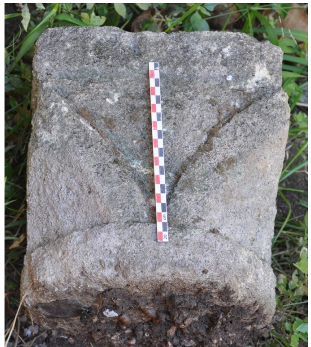
Fig. 31 : Aniane, chapiteau de la rue E. Sanier.

Deux autres chapiteaux de la même série, que nous avons pu photographier en 2013 servaient d'ornementation et de souvenir local dans un jardin de cette rue (Fig. 31 et 32). Il s'agit là encore d'œuvres obtenues dans un calcaire blanc grisâtre, coquillier, habillées de feuilles d'eau aux angles, tout à fait comparables à celles du Mas de La Boissière ou de la cour de la rue du Fesc, moins élégantes de fait que celles de l'ancienne vigne Ramon.