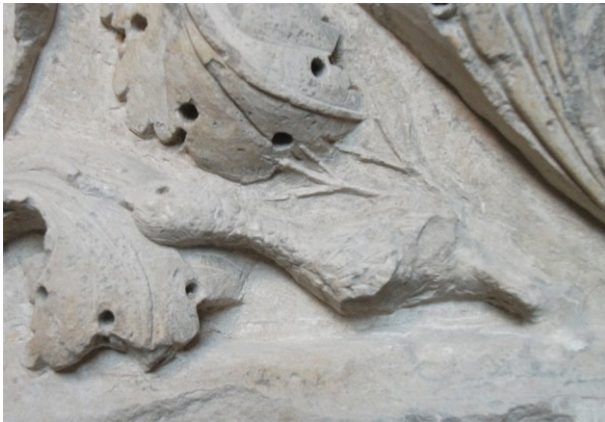
Fig. 17c : Bloc de la rue du Mazel. Détail de la composition.

déploie des enroulements sophistiqués de feuilles proéminentes. Il rappelle inmanquablement l'un des pilastres conservés au musée lapidaire de Gellone, valorisé dans une récente anastylose. De fait Dominique Labrosse 30 considère que l'œuvre anianaise proviendrait de Gellone. Le décor au trépan y semble néanmoins plus abondant et, malgré la mutilation de la pièce, on signalera qu'une bordure ou plinthe, constituée d'un bandeau plat, délimite le chant des panneaux contrairement à la pièce aujourd'hui présentée à Saint-Guilhem. Plus originale est la représentation de petits volatiles (12 cm), qui viennent se nicher ou picorer dans le feuillage (Fig. 17c). On peut là encore établir des rapprochements iconographiques avec des enroulements sophistiqués de végétaux de la priorale de Souvigny 31 . La complexité du dessin fait une fois encore envisager à la suite de Ph. Plagnieux, que des carnets de modèles ont circulé et donné lieu à des transcriptions graphiques dans de nouveaux foyers artistiques, disposant autour d'Aniane et de Gellone de leur propre tradition.