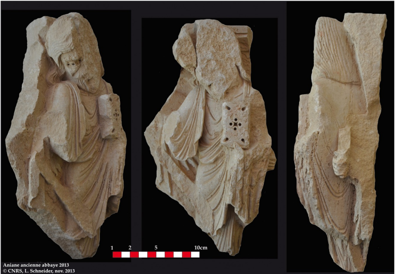
Aniane ancienne abbaye 2013 © CNRS, L. Schneider, nov. 2013