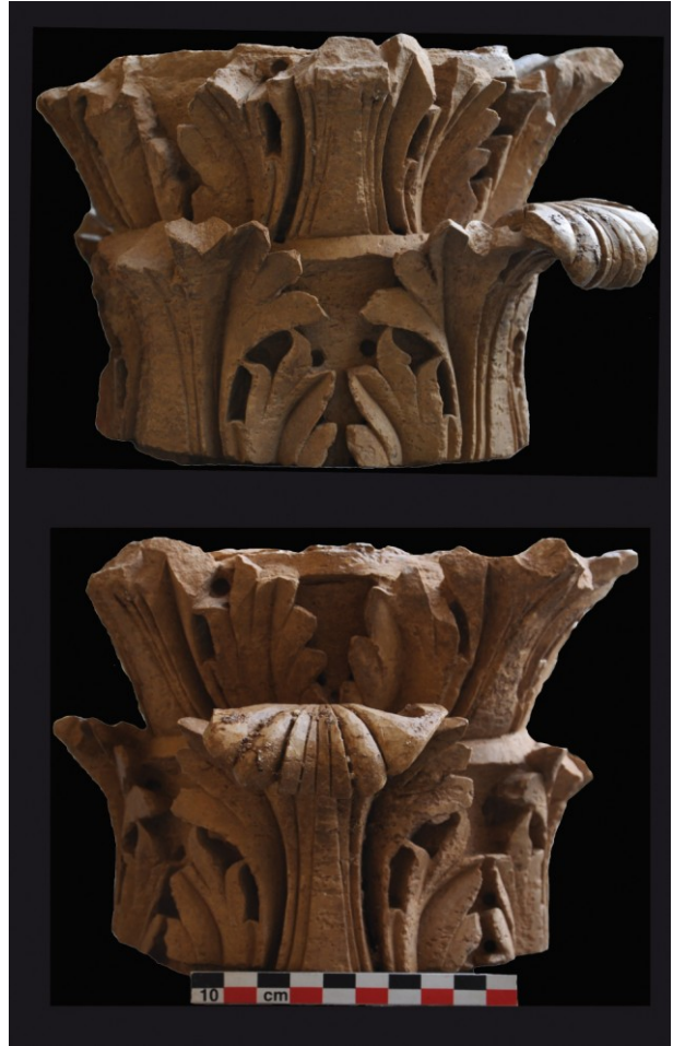
Fig. 12 : Aniane, ancienne abbaye, chapiteau corinthisant découvert en 2013 (Doc. CNRS, L. Schneider 2013).