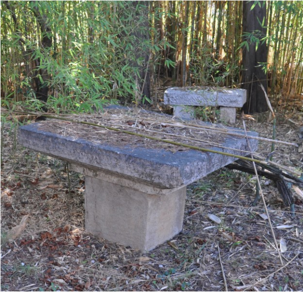
Fig. 21 : Parc de l'avenue de Gignac. Table d'autel ? (cliché L. Schneider 2013).