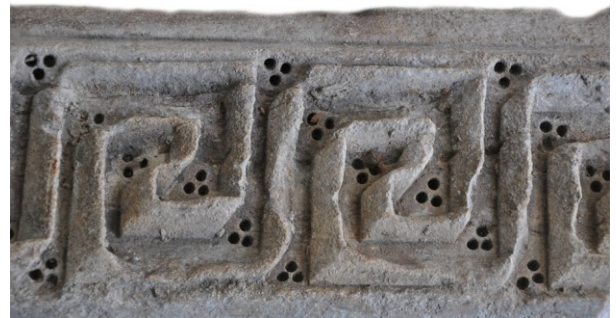
Fig. 2c : Face A, détail du ruban et de la décoration au trépan

C'est la face longitudinale la mieux conservée, même si l'angle droit est brisé. On distingue une frise grecque, finement exécutée et composée de quatre panneaux. Le ruban n'est pas traité comme un simple bandeau quadrangulaire mais il est adroitement profilé en pli et orné de fines ciselures en lignes brisées ou en dents de scie, formant des sortes d'écailles. Ce qui caractérise l'œuvre est aussi la superposition d'un décor réalisé au foret ou trépan. Trois perforations de 0,4 cm de diamètre, disposées en triangle, forment un motif répété par six fois de manière à tracer une ligne recoupant en diagonale, dans les délaissés du ruban, chaque grecque. La composition se décline ainsi en quatre lignes recoupant les quatre grecques de cette face longue. Elle est sophistiquée et élégante. Elle joue avec les profondeurs et la lumière (Fig. 2c).