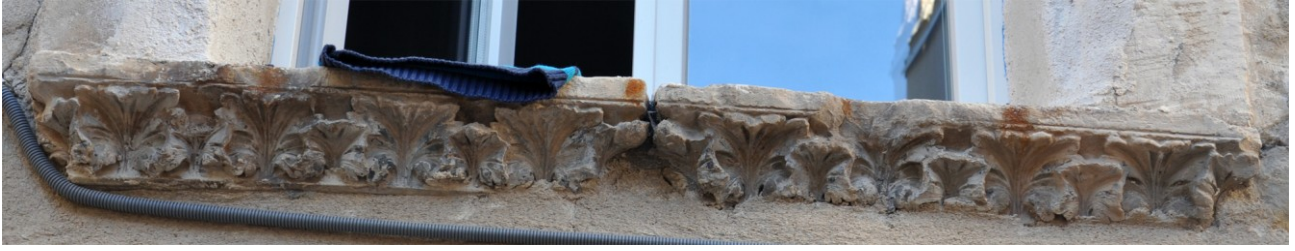
Fig. 18 : Aniane, tailleurs remployés rue du Fesc.

déploie des enroulements sophistiqués de feuilles proéminentes. Il rappelle inmanquablement l'un des pilastres conservés au musée lapidaire de Gellone, valorisé dans une récente anastylose. De fait Dominique Labrosse 30 considère que l'œuvre anianaise proviendrait de Gellone. Le décor au trépan y semble néanmoins plus abondant et, malgré la mutilation de la pièce, on signalera qu'une bordure ou plinthe, constituée d'un bandeau plat, délimite le chant des panneaux contrairement à la pièce aujourd'hui présentée à Saint-Guilhem. Plus originale est la représentation de petits volatiles (12 cm), qui viennent se nicher ou picorer dans le feuillage (Fig. 17c). On peut là encore établir des rapprochements iconographiques avec des enroulements sophistiqués de végétaux de la priorale de Souvigny 31 . La complexité du dessin fait une fois encore envisager à la suite de Ph. Plagnieux, que des carnets de modèles ont circulé et donné lieu à des transcriptions graphiques dans de nouveaux foyers artistiques, disposant autour d'Aniane et de Gellone de leur propre tradition.