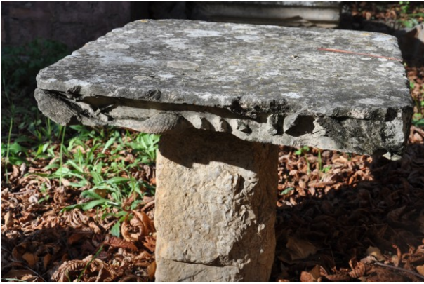
Fig. 22a : Parc de l'avenue de Gignac, fragment de tailloir.