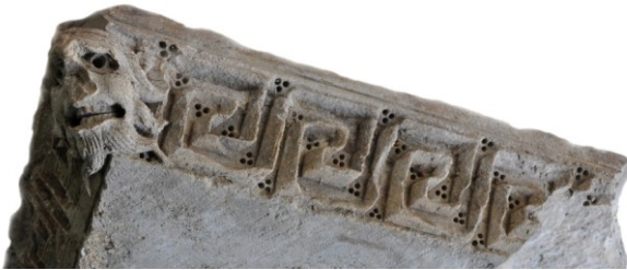
Fig. 2b : Le tailloir d'Aniane, face A.

Recherches et d'Études du Clermontais soit enfin retransférée et finalement stabilisée au sein du « pôle patrimonial » de l'ancienne abbaye d'Aniane, selon un projet attendu depuis plus d'une décennie désormais 6 . L'enjeu n'est pas mince si l'on considère que d'autres œuvres ont trouvé leur place, outre Atlantique à Manhattan mais aussi en Pennsylvanie. Elle a été présentée par ailleurs au public, à Aniane même, lors des Journées Européennes du Patrimoine en 2022 et plus récemment encore au musée archéologique Henri Prades de Lattes et de la métropole de Montpellier dans le cadre de l'exposition « Septimanie. Languedoc et Roussillon de l'Antiquité au Moyen Âge » 7 .