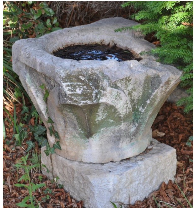
Fig. 34 : Aniane, parc du 4 avenue de Gignac, chapiteau à feuille d'eau.

Le tailloir des vieillards présente des analogies avec des œuvres décontextualisées attribuées à Gellone, mais aussi avec des fragments maintenant contextualisés découverts en fouille à Aniane. Outre le répertoire iconographique, l'usage de décorations réalisées au trépan et tout particulièrement de ce motif de trois creusements disposés en triangle ou encore de ces fines ciselures en dents de scie quasi-indécélables réalisées sur des décors végétaux, sont des caractéristiques plus discrètes de ces grands foyers artistiques du centre Hérault.