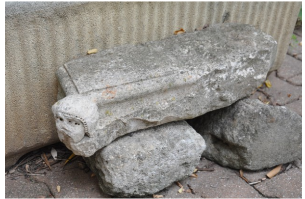
Fig. 19a : Aniane, collection particulière. Fragment de tailloir, redécouvert en réemploi dans le village à proximité de l'ancienne église Saint-Jean.