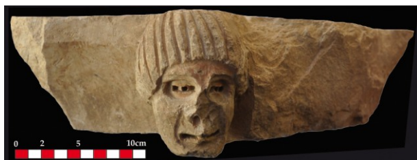
Fig. 14 : Aniane, ancienne abbaye, fragment de chapiteau n° 30810-7.

Mais c'est un plus modeste fragment de sculpture qui apporte encore une contribution possible, sinon essentielle, à une recontextualisation plus générale.