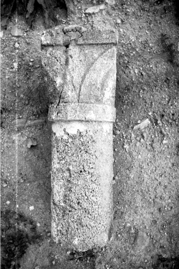
Fig. 33 : Aniane, Saint-Sébastien.

On signalera par ailleurs un vingt-cinquième chapiteau qu'il faut associer à cette série. Celui-ci se trouvait hors village, remployé dans un calvaire marquant l'emplacement de l'ancienne église Saint-Sébastien. Il a disparu depuis, mais nous avons pu le photographier en 1991 (Fig. 33).