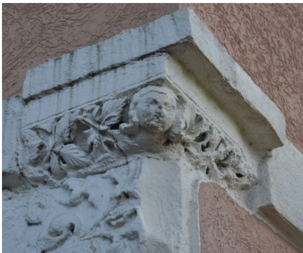
Fig. 20a : Tailloir en remploi avenue de Gignac (cliché L. Schneider 2013).

À l'angle de cette maison du début du XX e s. une composition hétéroclite remploie un très beau tailloir à décor de feuilles conservant dans l'angle une tête assez volumineuse à chevelure longue. L'œuvre sans doute plus tardive que les précédentes (XIII e s.) évoque un autre tailloir conservé au Cloisters Museum 35 . D. Labrosse a d'ailleurs suggéré que les deux pierres pourraient être assemblées 36 . Le rapprochement est lié au traitement des feuilles qui seraient possiblement de houblon. Le tailloir coiffe à Aniane dans cette recomposition de circonstance un autre bloc orné, fragment de pilastre où l'on distingue à nouveau, un enroulement de feuilles et une fleur dont le centre est occupé ici encore par un volatile, comme sur le fragment de linteau de la rue du Mazel. La pierre a été badigeonnée d'une peinture contemporaine mais l'on distingue néanmoins l'usage du foret qui anime encore le détail des feuilles.