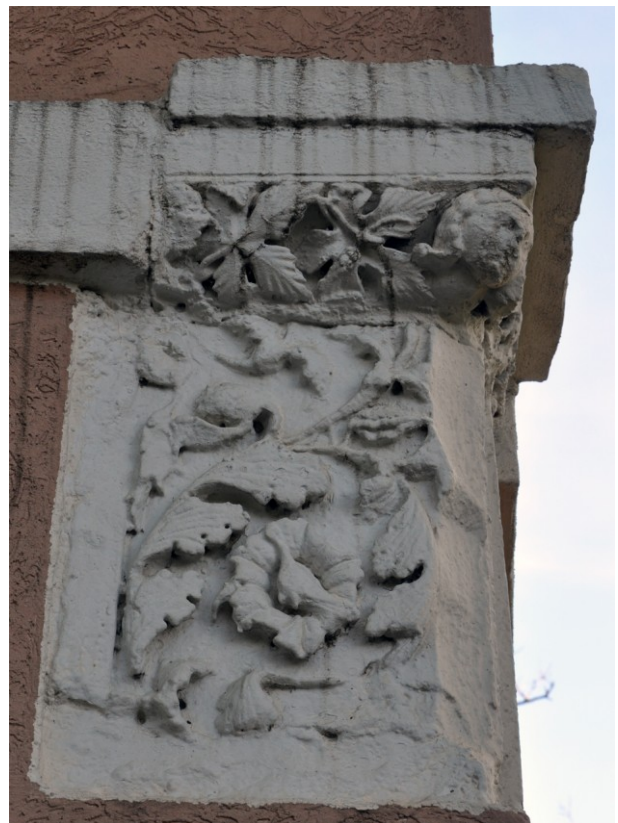
Fig. 20b : Autre bloc du pastiche du 1 avenue de Gignac.

Ce pastiche démontre, soit que toutes les œuvres de la collection Vernière n'ont pas voyagé jusqu'aux États-Unis, soit qu'il existait d'autres sources locales « d'approvisionnement », fragments de ladite collection, ou autres œuvres disposant de leur propre trajectoire.