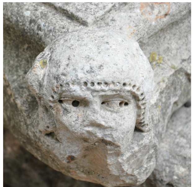
Fig. 19b : Détail du tailloir précédent