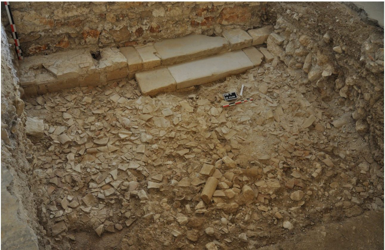
Fig. 9 : Aniane, ancienne abbaye. Aile nord du cloître roman (sondage 232), couche de destruction.

Deux marches permettaient d'accéder, depuis l'abbatiale dédiée au Sauveur, à la galerie septentrionale à quelques mètres de son angle nord-est. Le sol composé de gravillons et de petits galets noyés dans un mortier hydrofuge est relativement modeste. Mais sur celui-ci gisaient encore des