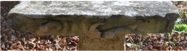
Fig. 22b : Tailloir du parc de l'avenue de Gignac. Face en opposition

erratiques longtemps inaperçus appartiennent à un second cloître (hypothétiquement situé entre la basilique Sainte-Marie et l'abbatiale Saint-Sauveur), sinon à un agrandissement ou une réfection du cloître du XII e s. Quoiqu'il en soit, ces éléments témoignent de nouvelles dynamiques et de nouveaux chantiers ouverts à Aniane, d'un changement d'esthétique et de modèle économique aussi. Ils révèlent et soulignent dans le processus de récupération qui nous occupe d'autres trajectoires, plus locales. Ici le démontage organisé est manifeste car on a pu inventorier plus d'une vingtaine de colonnes durant ces dernières décennies. Les œuvres remployées, plus modestes, ont surtout servi à l'aménagement de nombreuses pergolas, celles-ci manifestant ce goût anianais pour les jardins de ruines et la mémoire de l'abbaye ( Fig. 24 ). Elles ont échappé de fait à la prédation des marchands. Mais