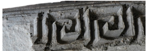
Fig. 4c : Face C. détail du décor incisé sur le ruban des grecques.

Le jeu des diagonales en triangle perforé est toujours décliné et c'est surtout sur cette face que les ciselures de lignes brisées sur les rubans sont particulièrement visibles et soulignées (Fig. 4c).