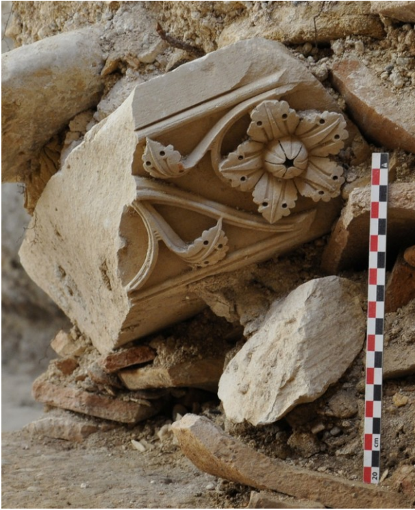
Fig. 10 : Le tailloir 23213-1 au moment de sa découverte dans les couches de destruction de la galerie. (Cliché L. Schneider 2013)