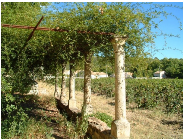
Fig. 25 : Ancienne pergola de l'avenue Louis Marres, encore visible en 2004

Il existait avant 2005, à l'emplacement de la maison de retraite actuelle, une habitation ancienne de la seconde moitié du XIX e s. Celle-ci disposait au sud d'une pergola constituée de cinq colonnes surmontées de chapiteaux stylisés trapézoïdaux ornés de feuilles d'eau simplement incisées aux angles et parfois dotées d'une nervure centrale ( Fig. 25 et 26 ). Les abaque sont lisses, l'astragale torique simplement mouluré. Bien que le traitement soit simplifié, on se situe dans la tradition cistercienne des chapiteaux à feuilles d'eau, souvent lisses qui apparaissent progressivement à Flaran et Fontfroide 39 .