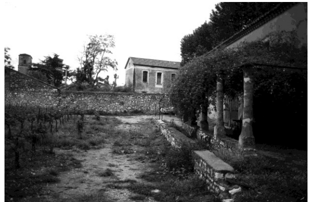
Fig. 24 : Ancienne pergola dite de la « Vigne Ramon » à l'ouest de l'ancienne abbaye, aujourd'hui démantelée.

aujourd'hui, ce patrimoine est de plus en plus dispersé. Il s'efface et devient menacé d'oubli par défaut d'intérêt général. Aussi, il nous a semblé utile de réunir la documentation que nous avons pu constituer au fil de l'eau pour en évoquer les dernières traces, ou du moins celles que l'on peut encore déceler aujourd'hui. Il n'est pas impossible par ailleurs que