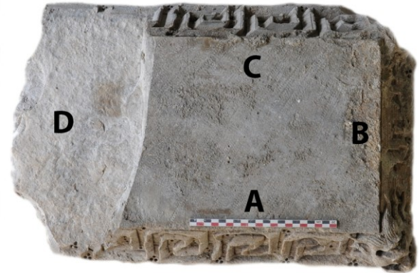
Fig. 5 : Le tailloir d'Aniane, table inférieure et arrachement de la face D

Comme on l'a dit, celle-ci est perdue. Résultat de l'arrachement de la pièce au moment de sa redécouverte.