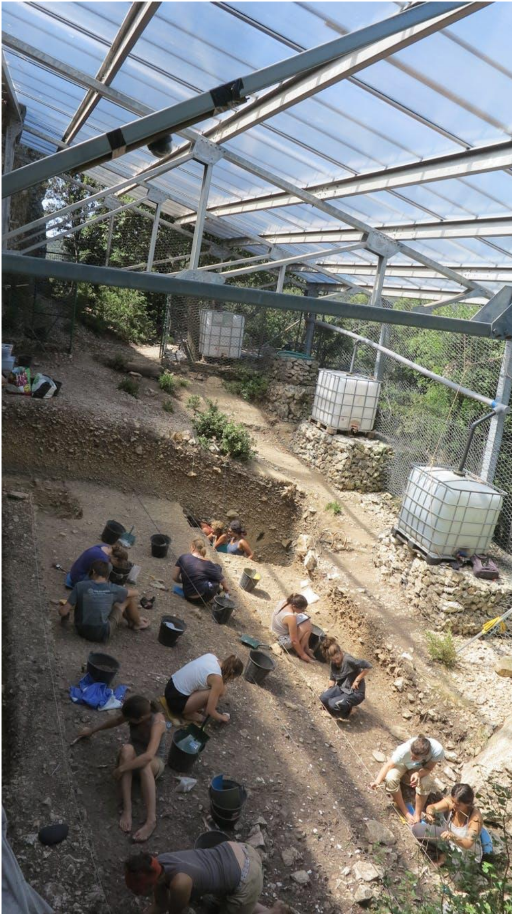
Vue des fouilles en cours dans la Grotte Mandrin.