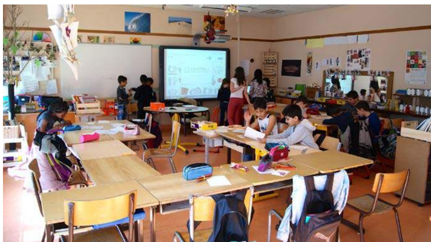
Figure 1 - Aménagement spatial d'une salle d'UPE2A en école élémentaire

Les salles d'UPE2A que nous avons observées étaient majoritairement organisées en îlots, en école élémentaire (figure 1) comme au collège (figure 2), afin de favoriser le travail en petits groupes de niveau et/ou d'âge, ou selon les affinités. Cette configuration, choisie par chacune des professeurs des dispositifs pour faciliter les déplacements des élèves dans la salle et les inciter à une autonomisation, conférait à l'enseignant une position volontairement décentrée permettant des interactions plus fréquemment horizontales que verticales : « dans ma salle, je ne contrains pas les déplacements des élèves, ils doivent pouvoir circuler s'il en ont besoin, aller consulter un dictionnaire, demander de l'aide pour un travail, ça les met en confiance » (une enseignante d'UPE2A collège). L'instauration d'une coprésence des corps et des regards, latérale plus que frontale, ou tout au moins leur combinaison, a permis de privilégier la coopération et l'entraide entre pairs. Cette coopération a été encore facilitée par l'utilisation d'outils partagés, comme en témoigne notamment le rôle central du tableau blanc interactif (TBI) (figure 1) qui, relié à un ordinateur connecté à internet, faisait fonction de ressource prioritaire pour diverses recherches dans le cadre de travaux de classe ou dans la traduction et l'intercompréhension parmi les élèves ainsi qu'entre les élèves et l'enseignante.