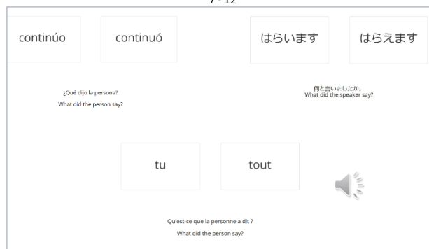
Figure 3 - Trois exemples d'écrans EPHV en espagnol, japonais et français avec options de réponse orthographique (Reaves et al. , 2022)