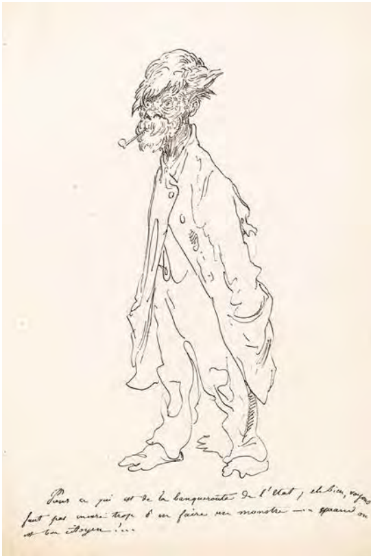
9. Gustave Doré, Versailles et Paris en 1871 . Album de 95 dessins originaux, 1871, crayon, plume et encres noire et bleue, sur papier, 23 × 36 cm, Strasbourg, musée d'Art moderne et contemporain, cabinet d'Art graphique (MG1 Z2A).

de la monstruosité psychologique dans la forme du cerveau telle qu'elle se lit dans les conformations crâniennes, tout comme la caricature les révèle par le biais des déformations expressives et anatomiques.