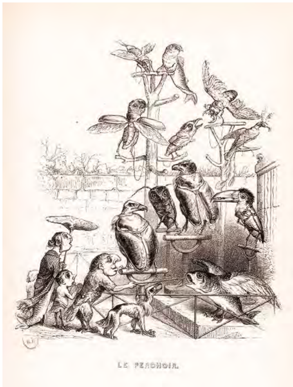
5. Grandville, Le Perchoir , gravure sur bois, dans Un autre monde. Transformations, visions, incarnations, ascensions, locomotions, explorations, pérégrinations, excursions, stations... , Paris, H. Fournier, 1844, planche hors-texte, face p. 114. Paris, Bibliothèque nationale de France, département Réserve des livres rares (Rés-Y2-1011).

moyen de monstres, manifeste sa capacité à transformer les espèces. Prouver leur variabilité permet de contester leur fixité, thèse défendue par Georges Cuvier contre Étienne Geoffroy Saint-Hilaire dans cette querelle dite des analogues. Le second voit des analogies entre les différentes espèces et dans le plan de composition de tous les organismes. Les monstres humains, quand ils présentent des parentés avec des animaux, témoignent de ces analogies. Grandville, qui a consacré une grande partie de sa production à la création de monstres sous la forme d'hybrides d'hommes et d'animaux, a plusieurs fois traité des sujets relatifs à la tératologie dans son œuvre de caricaturiste de presse et d'illustrateur. Les trois planches de la série Cabinet d'histoire naturelle 42 présentent les personnalités politiques au pouvoir, dont les visages sont entés sur le corps d'espèces animales, lesquelles, parce qu'elles sont alors inconnues ou méconnues, recèlent une étrangeté certaine. Il faut rappeler que l'animal sauvage est alors presque unanimement considéré comme un ennemi qu'il convient de détruire 43 . La curiosité du public, attestée par la célébrité de Jack l'orang-outang (transporté de Bornéo à Paris en 1836 et mort l'année suivante) ou de Zarafa la girafe (offerte à Charles X par Méhémet Ali en 1827), s'accompagne fréquemment d'agressions, ainsi qu'en témoigne le relevé des exactions commises envers les pensionnaires de la ménagerie du Jardin des plantes 44 .