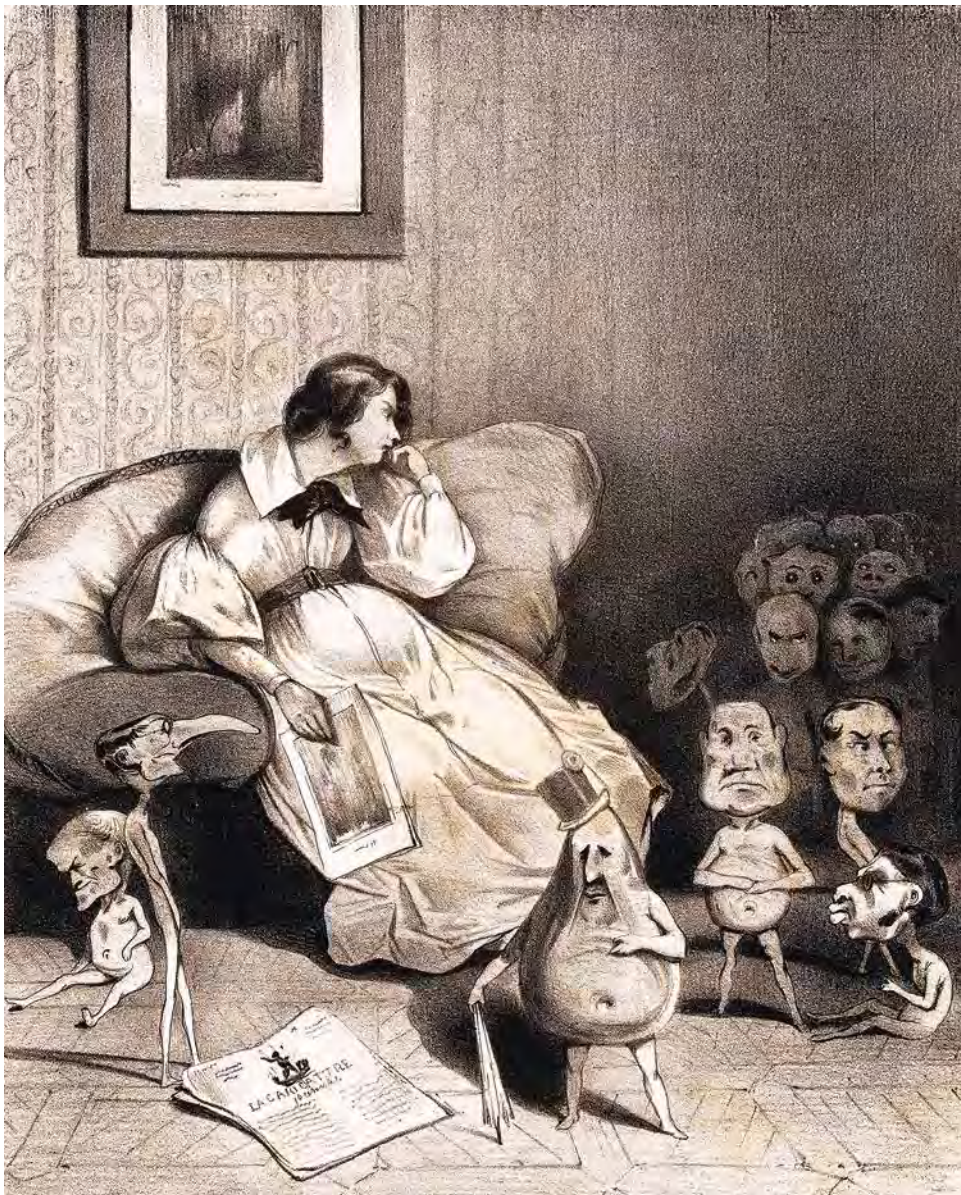
7. Honoré Daumier, Chimère de l'imagination , lithographie, 35,8 × 27,3 cm, La Caricature morale, politique et littéraire , n° 118, 7 févr. 1833, pl. 244, Paris, Maison de Balzac.

médical et populaire. Daumier le montre devant un orang-outang, intimant à sa femme enceinte, et déjà mère d'un garçonnet aussi difforme que son géniteur : « Bobonne, Bobonne ! tu me ferais un monstre comme ça, ne le regarde pas tant ! » (fig. 6).