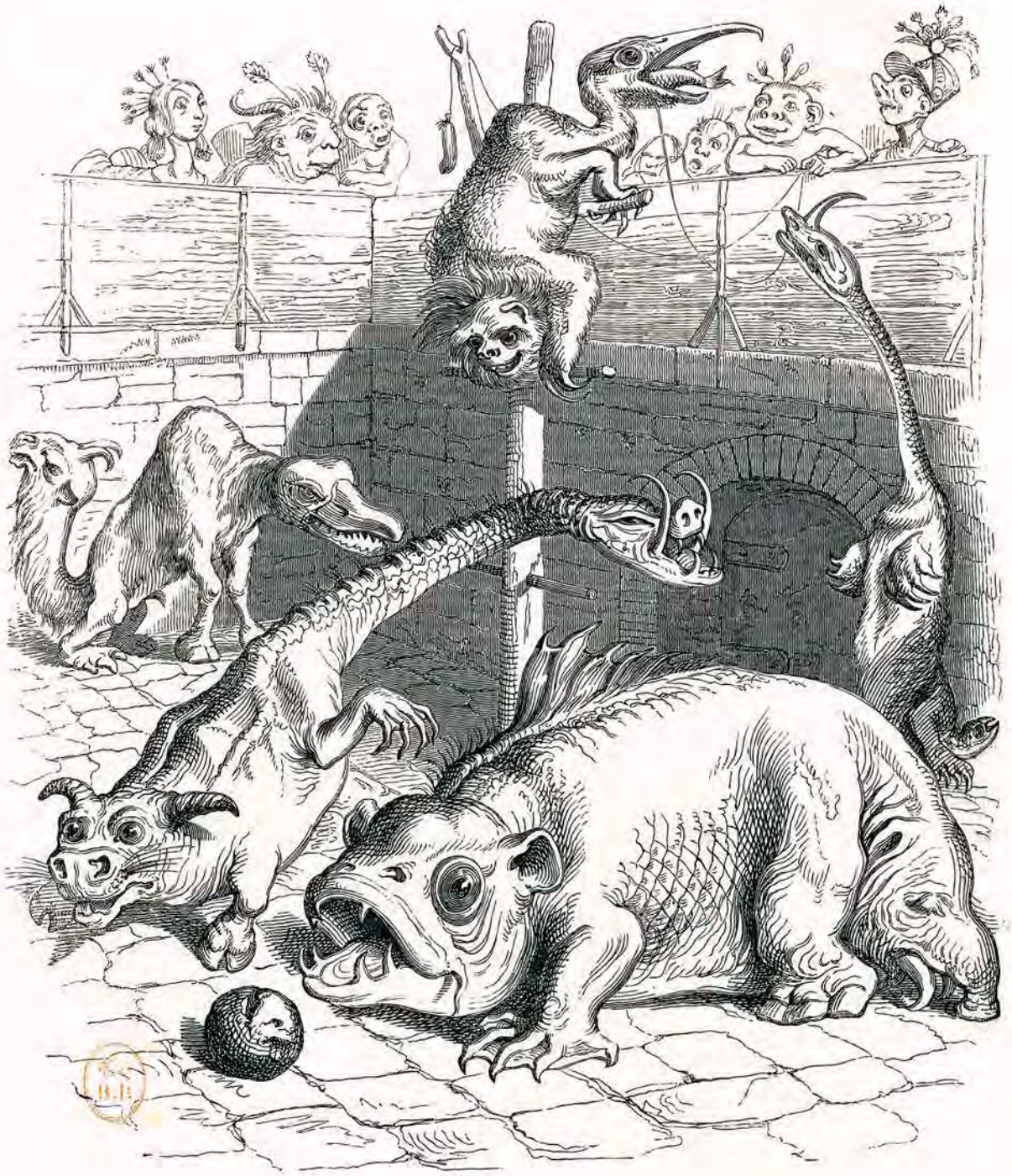
LA FOSSE /UX DOUBLIVORES.