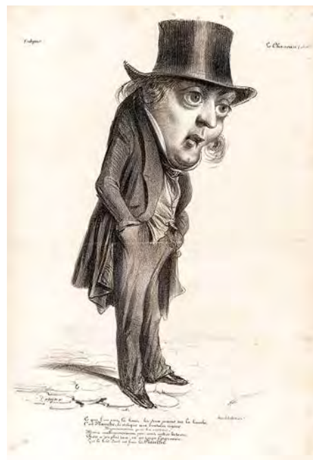
10. Benjamin Roubaud, Gustave Planche, critique littéraire et artistique , lithographie, 36 × 27,3 cm, Le Charivari , n° 28, 14 janv. 1839, Paris, musée Carnavalet – Histoire de Paris (G10242).

Les milliers de caricatures produites et diffusées au XIX e siècle ont ainsi joué un rôle ambivalent. Si elles ont pu participer à une réévaluation du monstrueux autour de 1830, elles ont aussi contribué à la dénonciation de la part monstrueuse des individus qu'elles prenaient pour cible en révélant, au moyen de la déformation expressive des corps et des visages, les monstruosité intellectuelles, morales et sociales. Elles mettaient en évidence des déviances et des transgressions, rejoignant ainsi les sciences ou les pseudosciences qui traquaient les indices des perversions et des dégénérescences. En banalisant le monstrueux, elles ont également permis de voir la part monstrueuse de chaque individu.