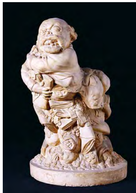
8. Jean-Pierre Dantan, Portrait-charge de Nathan Mayer von Rothschild (1777-1836), banquier, 1833, plâtre, 36 × 23,5 × 24,5 cm, Paris, musée Carnavalet – Histoire de Paris (S1129).