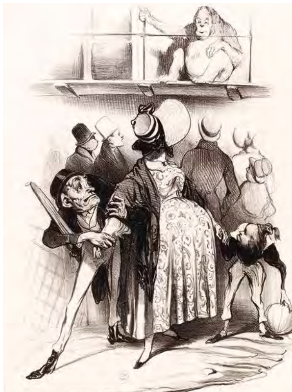
6. Honoré Daumier, « Bobonne, Bobonne ! tu me ferais un monstre comme ça, ne le regarde pas tant ! », lithographie, 37,2 × 22,5 cm, série Les Orangs-outangs , n° 3, Le Charivari , 8 nov. 1836, Paris, musée Carnavalet – Histoire de Paris (G.8131).

La théorie des envies, alors même qu'elle est rejetée par Étienne Geoffroy Saint-Hilaire et Moreau de la Sarthe, continue d'inspirer les dessinateurs, probablement parce qu'elle permet de plaisanter sur toutes sortes de sujets, mais peut-être aussi parce qu'elle offre la possibilité de tenir un propos sur la création des monstres et, par ce biais, sur la création des caricatures. Tout en admettant qu'une émotion forte puisse créer des désordres anatomiques durant la gestation, Geoffroy Saint-Hilaire consacre de nombreuses lignes 51 à combattre cette théorie parfois appelée également la « théorie des regards 52 ». Elle est pourtant encore très répandue, et même colportée par certains médecins. Joseph Morel de Rubempré en fait état en 1835 et déclare que « tous les jours on voit des femmes mettre au monde un enfant offrant la plus parfaite ressemblance avec un individu qu'elles ont souvent eu l'occasion de regarder fixement [...] sans qu'elles aient eu pour cela aucun commerce amoureux avec lui 53 ». Victor Hugo la mentionne également,