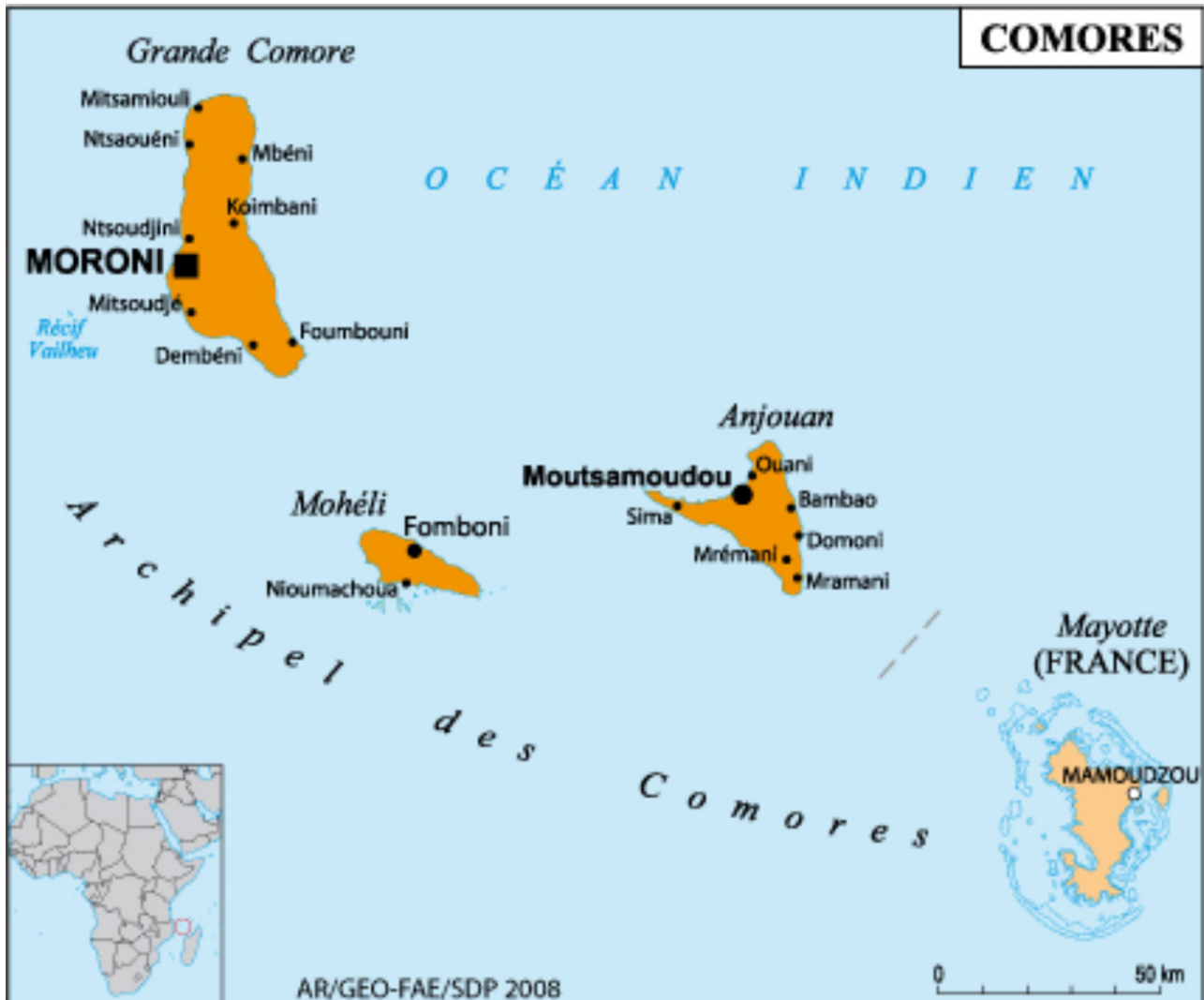
Document 2 - Carte, Mayotte au sein de l'archipel des Comores

Légende : L'archipel des Comores est composé de quatre îles : Grande Comore, Mohéli, Anjouan et Mayotte. En accordant le 24 décembre 1976 le statut de « collectivité territoriale » à Mayotte, la France a marqué une rupture avec le fonctionnement et la composition de cet espace géographique. La frontière à Mayotte a non seulement modifié la circulation dans l'archipel des Comores, mais a également transformé l'évolution globale de l'île en de nombreux points : démographie, violence, représentations et revendications de la population (Blanchy 2002, Blanchy et al., 2019). Cette frontière politique reste peu contraignante jusqu'au 18 janvier 1995, date à laquelle le gouvernement Balladur décide d'entraver la circulation des personnes dans l'archipel des Comores en imposant un visa d'entrée à Mayotte aux habitants des trois autres îles comoriennes. Cette obligation de visa apparaît particulièrement symbolique d'une insularisation visant à couper Mayotte du reste de l'archipel.