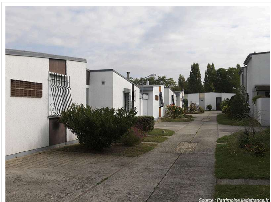
Les Chalandonnettes, dans le quartier de Beauval à Meaux (Seine-et-Marne)

Certes, la maison individuelle sous la forme dite groupée, réalisée par un promoteur dans le cadre d'un seul permis de construire portant sur un ensemble de maisons, y compris des équipements et des services, a connu une certaine vogue, celle des « nouveaux villages ». Ces derniers ont attiré un public souvent un peu plus favorisé que celui de la maison à l'unité, de culture plus internationale, séduit par l'image américaine de cette formule. Mais cette vague a été relativement passagère, et toujours très minoritaire dans la production totale de maisons, comme elle est restée également très minoritaire dans la production globale des promoteurs. Le modèle n'a pas vraiment pris.