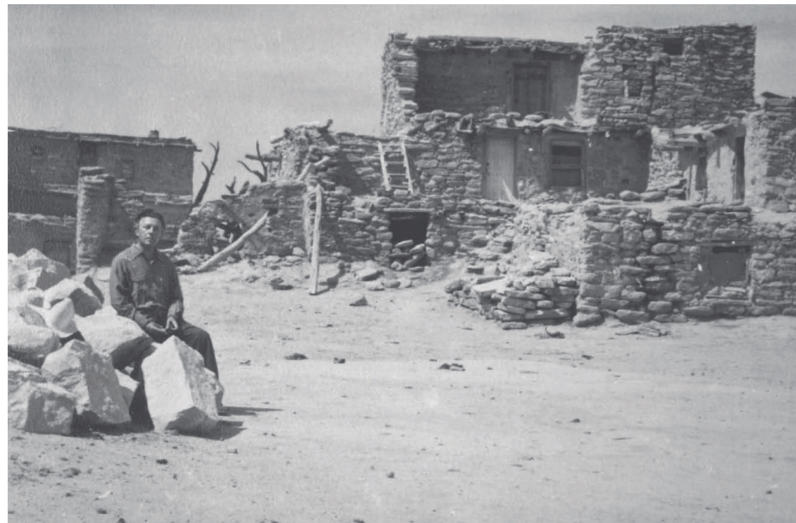
« André Breton dans un village Hopi, Arizona », août 1945 "André Breton in a Hopi village, Arizona", August 1945

Pendant la période de l'exil américain des années 1940, ils leur attribuèrent le rôle d'une présence bienfaitrice, ce qui leur permettait de s'évader de leur morne quotidien marqué notamment par l'insécurité matérielle et l'angoisse de leur avenir.