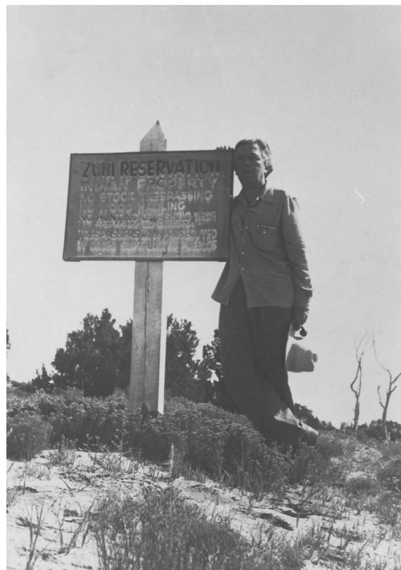
André Breton, Zuni, 1945