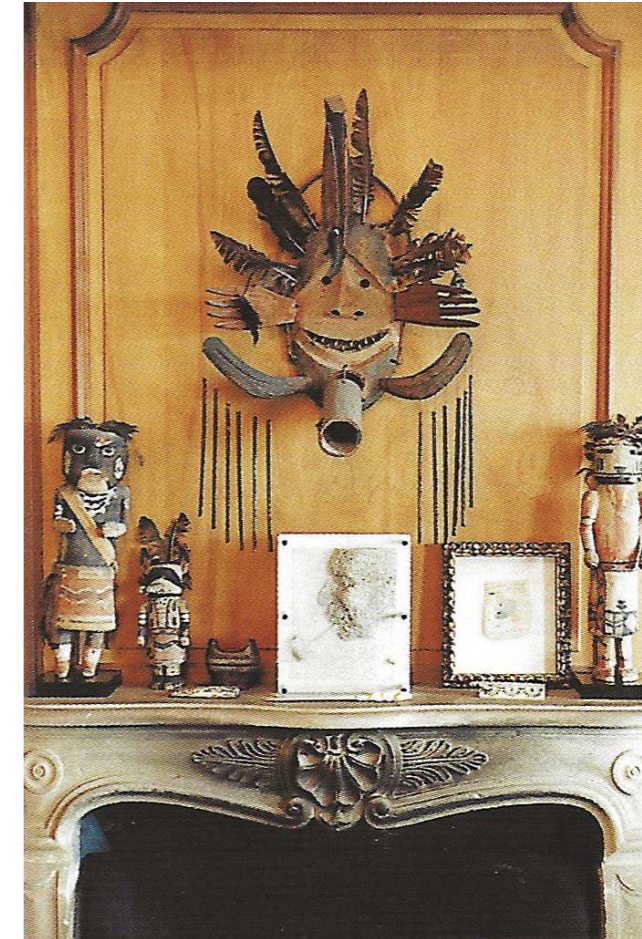
« Dans l'appartement-atelier d'Enrico Donati », New York, mars 1997 "Enrico Donati's studio", New York, March 1997

Breton, Ernst et Donati rassemblèrent d'importantes collections de Kachinas qui peuplaient leur imaginaire. Commentant une série de photographies de Max Ernst prises sur la terrasse de la Hale House, maison de Peggy Guggenheim à New York 17 , où on le voit vêtu d'une sorte veste en plumes, entouré de ses 29 poupées, les historiens de l'art ont évoqué l'idée qu'il se prenait pour un chamane 18 , à tout le moins pour un magicien 19 . Sa collection de Kachinas inspirera certaines de ses œuvres, comme La Planète affolée (1942) ou Le roi jouant avec la reine (1944). Une gouache sur papier datant de 1946-1947, intitulée Deux Peaux-Rouges s'apprêtent à danser , dont un des personnages évoque l'image d'un pétroglyphe de l'Indian Petroglyph State Park près d'Albuquerque 20 . Ernst est aussi l'auteur du poème « Dix mille Peaux-Rouges » écrit lors d'un séjour dans le Nevada en 1947 21 et dont il transcrivit l'esprit dans une petite huile sur carton Dix mille peaux-rouges et lucides s'apprêtent à faire rire la pluie (vers 1949), dont le titre est tiré de deux strophes du poème. Par-dessus tout, Ernst éprouva à un moment de sa vie le besoin de s'immerger dans l'environnement familier des