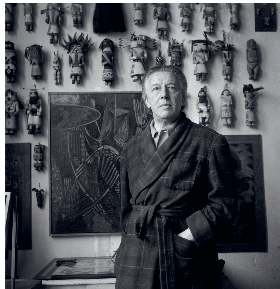
« André Breton, 42 rue Fontaine », Paris, 1950