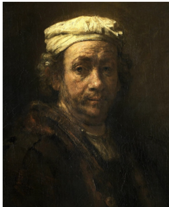
Autoportrait au chevalet et à l'appuie-main de peintre, 1660 Rembrandt, Louvre

28 janvier 2025 | par jean-marie.barbier , Martine Dutoit | Outils d'analyse | 356 visites | 0 commentaire