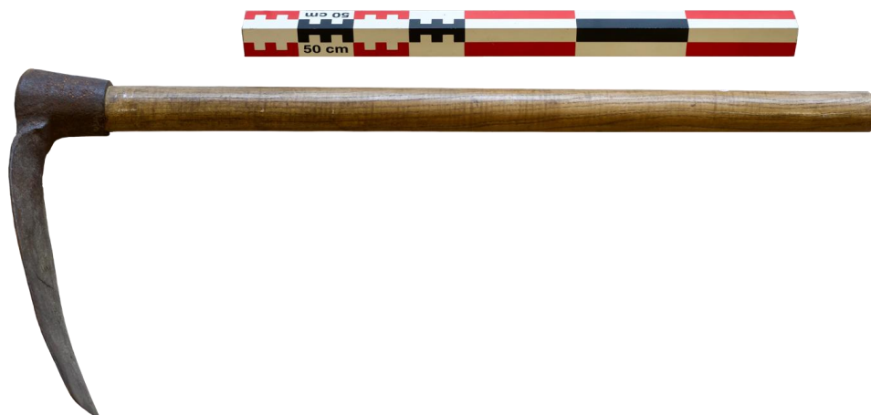
Fig. 7. La houe (« oyo » ou « hoyau »)

La houe. Sa longueur est de 0,75 m. Le manche a un diamètre de 4,5 cm au niveau du fer, 3,8 cm en son milieu ; il est en frêne, ne porte guère de traces d'usage, si ce n'est quelques-unes au niveau du contact avec la douille du fer.