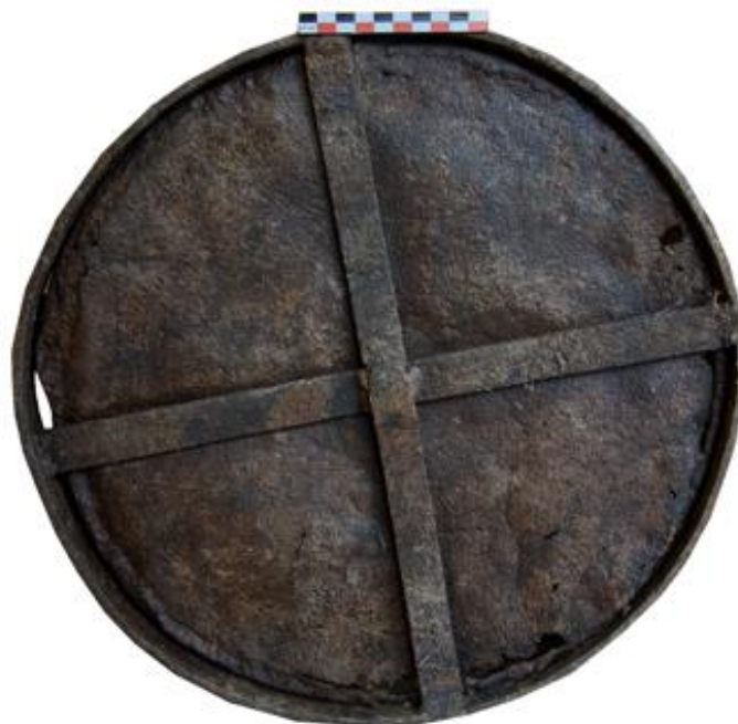
Fig. 6. Le seau, vue inférieure

Le fond est constitué d'une tôle circulaire, soudée à l'autre tôle et soutenue par deux barres plates en forme de croix, soudées entre elles et à la base du seau (fig. 6).