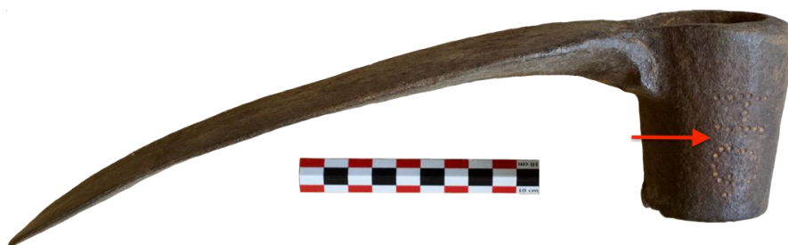
Fig. 9. Le fer de la houe, vue latérale, avec l'inscription « H G »