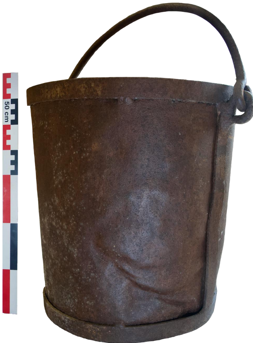
Fig. 5. Le seau en fer

Le seau. C'est un récipient à une anse, entièrement en fer, un tronc de cône ouvert vers le haut (fig. 5). Il est composé d'une armature de barres plates (3,5 cm de large pour 3 à 5 mm d'épaisseur) formant deux cercles horizontaux de chant, l'un correspondant à la base, l'autre à l'ouverture. Ces deux cercles sont reliés entre eux par deux barres plates verticales diamétralement opposées ainsi qu'une tôle de fer d'environ 1 mm d'épaisseur, reliée à ces barres par quelques points de soudure. L'anse qui mesure 1,8 cm de diamètre coulisse dans 2 oreillons de même diamètre.