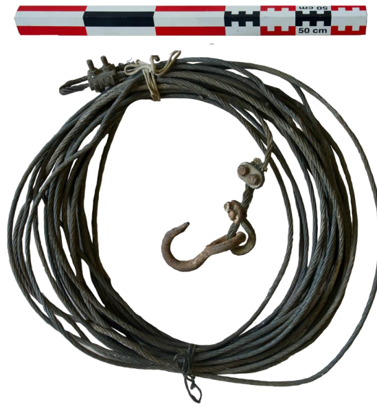
Fig. 10. Le câble

Le câble métallique. Il mesure 26,75 m de longueur et 7 mm de diamètre (fig. 11). Il est constitué de 6 brins torsadés, chaque brin étant composé de 12 fils de 0,5 mm de diamètre. Dans l'iconographie disponible, il n'y a pas d'exemple d'utilisation du câble dans le processus d'extraction. En effet, dans le témoignage, comme dans l'iconographie, il s'agit d'une corde agissant sur un treuil 12 . Le cliché du sondage au Pont qui Penche montre un treuil probablement en bois, mesurant approximativement une quinzaine de cm de diamètre, autour duquel s'enroule une corde. La rigidité du câble ne permet pas un enroulement sur un treuil d'un diamètre aussi faible. C'est plutôt sur une poulie que devait coulisser le câble, tiré alors par un animal de trait ?