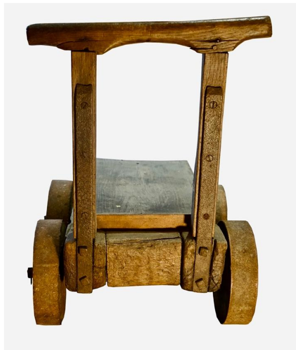
Fig. 4. Vue arrière du dossier