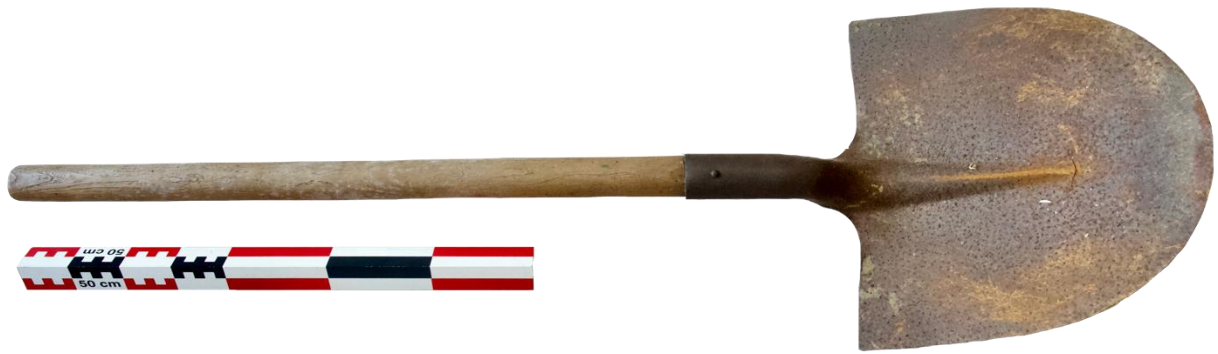
Fig. 11. La pelle

La pelle. Elle mesure 1,10 m de longueur (fig. 12). Le godet seul mesure 44 cm de long (dont 32 cm de plat) et 33 cm de large. Son poids total (godet et manche en frêne) est de 1,8 kg. À défaut de sources et d'éléments de comparaison, il semble difficile de documenter l'utilisation de cet outil large et peu épais.