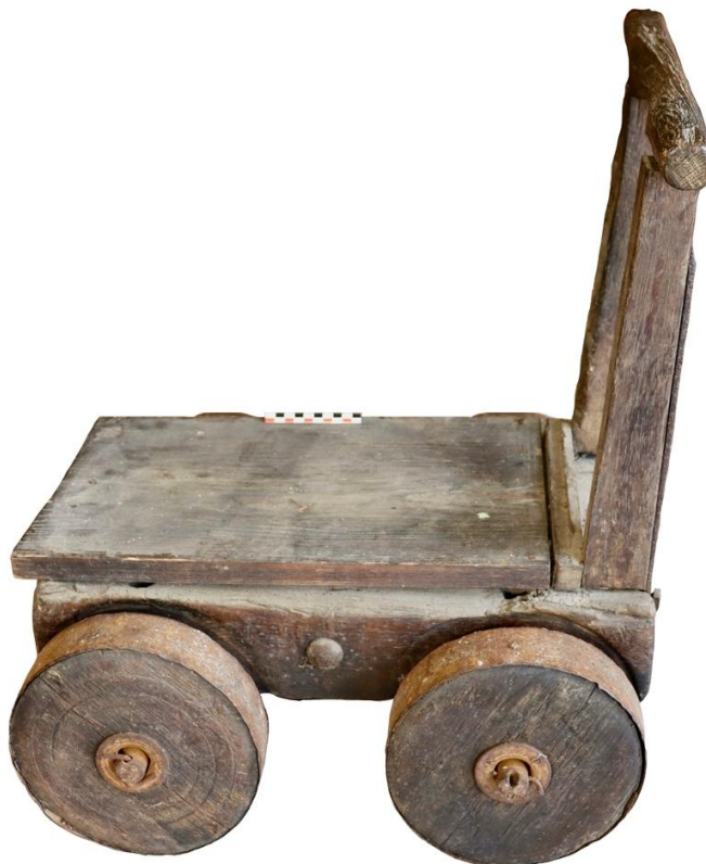
Fig. 1. Le chariot

Le chariot mesure 56,5 cm de longueur, 48 cm de largeur au niveau axial des roues et 65,5 cm de hauteur maximale, au niveau du dossier. Les matériaux qui le composent sont le bois et le fer. Le chêne est utilisé pour son châssis, ses roues tournées et son dossier ; le plateau est en résineux. Le fer est utilisé pour les deux essieux, le cerclage des roues, la visserie et la boulonnerie, pour solidariser châssis et dossier, ainsi que pour renforcer ce dernier (fig. 1 à 4).