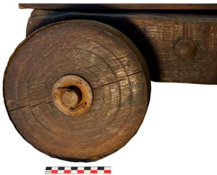
Fig. 3. Roue tournée en chêne