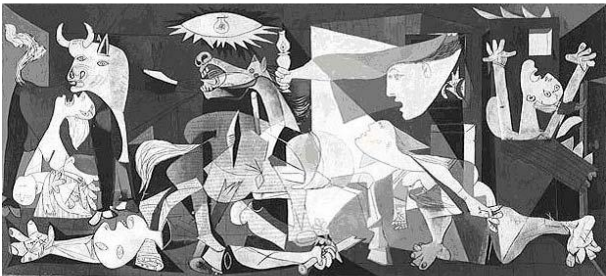
Guernica de Pablo Picasso

Le sang a coulé, pourtant, et certains sont morts. Ces héros pleurés laissent un goût amer et la communauté anémique, bien que soulagée, aurait pu se passer de la guerre : « Plus jamais ça ! ». Certes les guerriers ont été nobles dans leurs missions, mais la guerre elle-même est ignoble et appelle démission. Comment sauver les uns et condamner l'autre ?