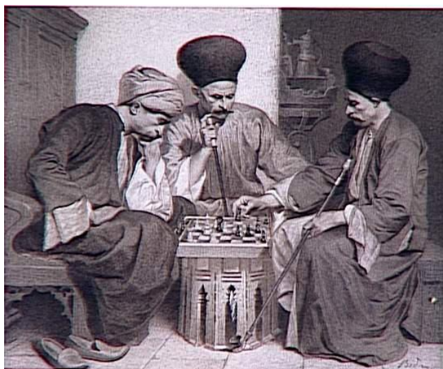
Les échecs : un jeu de stratégie 3

L'intelligence, valeur éminente du combat, se fonde sur la réflexion et une série de stratégies mentales : la ruse (tromperie, dissimulation), la prudence, la constance et la sérénité. Un combattant qui raisonne à voix haute et dit à l'autre ce qu'il prévoit lui donne des informations précieuses qui diminuent sa force. L'autre a alors une représentation plus complète et donc une meilleure prise sur l'adversaire et la réalité. « Méfie-toi de ma tour en B5 », dit le joueur d'échec bienveillant au joueur débutant pour affaiblir sa position en la donnant à l'autre et ainsi rétablir l'équilibre, la symétrie qui relance le jeu. A l'inverse, une intelligence peut consister à désinformer son adversaire pour fausser ses réflexions et donc sa force mentale. La dissimulation (je fais semblant d'attaquer avec mon fou alors que je prépare une ouverture pour ma dame) et la tromperie (je découvre ma tour pour que l'adversaire la prenne et enclenche le piège de l'échec et mat) que nous avons évoquée dans la guerre des informations est tout autant valable pour les combats pacifiques. Nombre de jeux de société, dits stratégiques, sont fondés sur de tels combats d'intelligences.