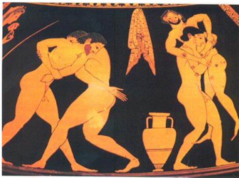
La lutte, Musée archéologique de Berlin