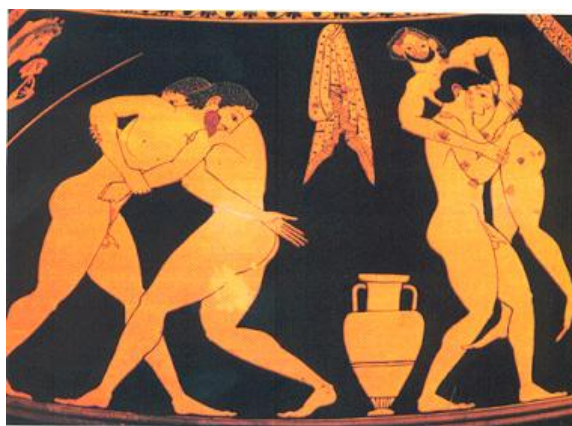
La lutte, Musée archéologique de Berlin

La synergie du combat est aussi une lutte pour imposer son énergie à celle de l'autre, sa rapidité, sa puissance. Et ceci passe par le raccourcissement des leviers : pour augmenter le moment des forces, chacun cherche à lutter avec les membres premiers ; car le tronc est plus fort que le bras, qui est plus fort que l'avant-bras, qui est plus fort que la main. La brutalité grossière des membres premiers s'impose donc face aux membres fins des extrémités. Le lutteur olympique joue de son centre de gravité pour imposer sa force à celle de l'autre.