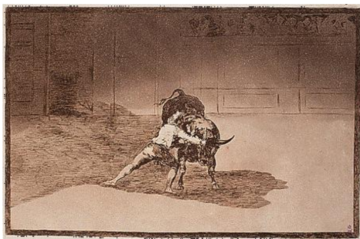
Tauromaquia de Goya : le combat du taureau

Un exemple de choix est celui de la tauromachie – étymologiquement le combat du taureau – où, loin de prendre le taureau par les cornes, le torero le maîtrise l'animal par un corps immobile et parfaitement maintenu, un calme d'esprit exceptionnel face au danger furieux et un jeu de voilements et de dévoilements à l'aide du tissu rouge. L'un trépigne avec violence et mugit, l'autre danse lentement. Le torero maîtrise le taureau, il le fait obéir au doigt qui tient la muleta et à l'œil qui décide de la trajectoire de la masse noire. Ce combat est peut-être le plus parfait car il est naturellement asymétrique et artificiellement symétrique : les règles visent à rétablir l'équilibre entre l'homme et la bête. Il pose certes la question de la cruauté, du sang versé et de la sensibilité moderne (le taureau est un animal qualifié de « sensible » par la législation européenne), mais il est tellement saisissant de maîtrise de la force par l'intelligence qu'il convient de le mentionner.