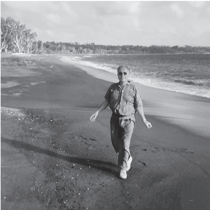
« Je suis né là-bas ! ». Photo prise sur une plage de la République du Vanuatu.

Nouvelle-Calédonie devienne ce qu'elle est. J'ai eu la chance de nouer des liens d'amitié avec Jean-Marie Tjibaou et sa famille. Il m'a beaucoup appris. Ce fut aussi l'occasion de retourner dans mon pays natal et de créer des liens avec les habitants du Vanuatu. Des collaborations se sont organisées, un musée a été créé au Vanuatu. D'autres opérations ont été montées à la Réunion, en Guyane... Cette ouverture et les liens qui se sont créés avec les DOM-TOM, furent très importants. En plus de la mission que j'effectuais au ministère de la Culture, j'avais été chargé par le Premier ministre, qui était Michel Rocard à ce moment-là, des politiques culturelles des territoires d'outre-mer. J'ai bien voyagé et ai beaucoup appris.