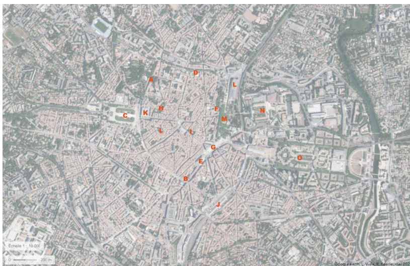
Figure 1. – Le centre historique de Montpellier. Localisation des principaux éléments de patrimoine.

fortifiée (la tour de la Babote [B], la tour des Pins [A]), la place Royale du Peyrou [C] et sa porte, les hôtels particuliers des XVII e et XVIII e siècles (Varennes, Baschy du Cayla, Richer de Belleval, Sabatier d'Espeyran), les édifices culturels (vestiges de l'église Notre-Dame des Tables [I], couvent des Ursulines [D], Mikvé médiéval [I]), les équipements culturels (Opéra Comédie [E], Musée Fabre [F]), les places (Comédie [G], Saint-Côme, La Canourgue [H]), les fontaines du XVIII e siècle (Trois Grâces, États du Languedoc), les apports du XIX e siècle bourgeois (palais de justice [K], gare [J], église Sainte-Anne [L]), etc.