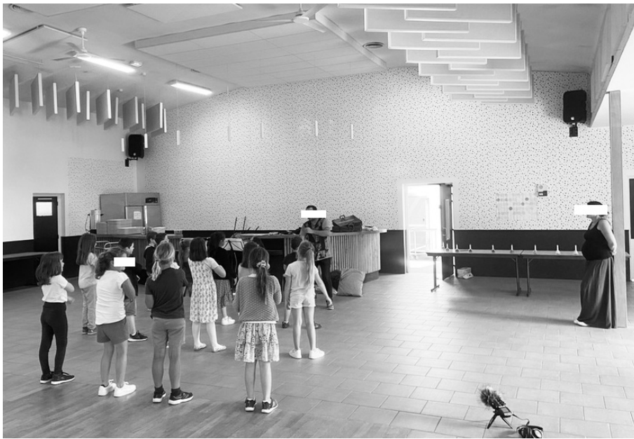
Figure 3 - Configuration 2 : enseignante en soutien passif