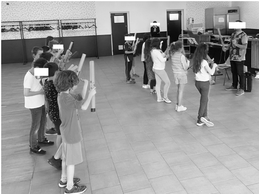
Figure 2 - Configuration 1 : enseignante en retrait