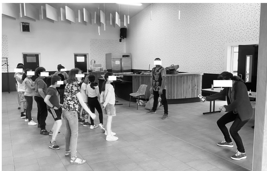
Figure 4 - Configuration 3 : enseignante en soutien actif : participation