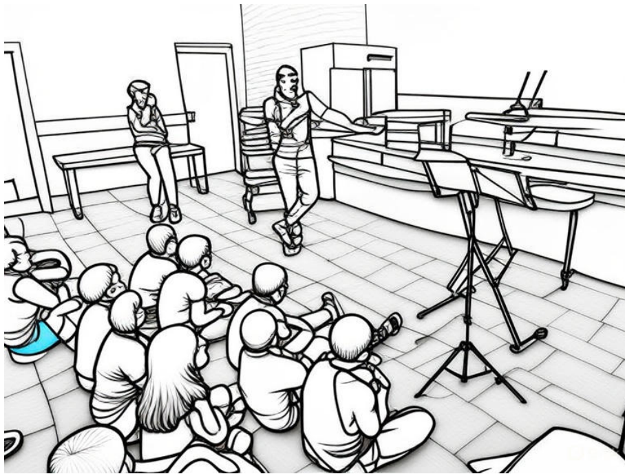
Figure 1 - Croquis d'une situation d'intervention selon la méthode du silhouettage