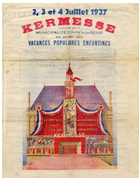
Figure 4. Affiche de 1937 de la municipalité communiste d'Ivry-sur-Seine

L'affiche invite les familles de la commune à participer, devant l'hôtel de ville, à la grande kermesse annuelle en l'honneur de la colonie de « vacances populaires enfantines »