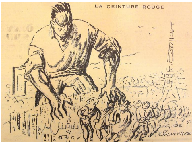
Figure 2. Caricature publiée à un an de la victoire du Front populaire, le 31 mai 1935, dans le journal La Voix socialiste de la Banlieue-Est

La grande bourgeoisie des beaux quartiers de l'ouest parisien, terrorisée car assiégée par la figure d'un ouvrier géant, sorti des usines de la banlieue rouge et industrielle, partie à la conquête de la capitale et de ses institutions.