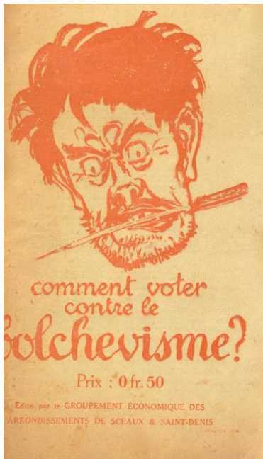
Figure 1. Affiche du patronat du Grand Paris à la veille des élections législatives et municipales de 1919 en banlieue parisienne