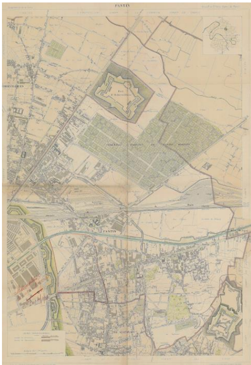
Figure 3. Plan de la ville de Pantin en 1899

La ville de Pantin est l'une des cités de banlieue les plus exposées aux emprises parisiennes. À la percée du canal de l'Ourcq qui scinde son territoire au début du XIX e siècle s'ajoute l'ouverture du chemin de fer, qui renforcera son morcellement ainsi que l'implantation du cimetière extra-muros parisien étendu sur près de 100 hectares, qui entravera son développement urbain. Pantin perdra également en 1919 le territoire de la zone fortifiée rattachée à la ville de Paris.