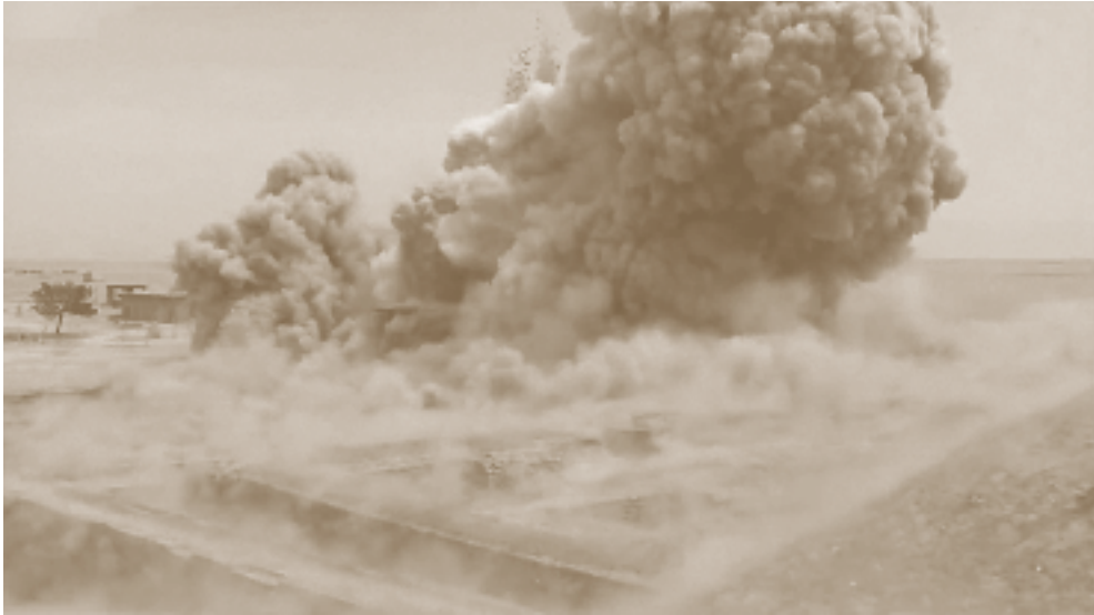
لقطة شاشة من مقطع فيديو دعائي نشرته داعش لتفجير معبد نابو في نمرود.

تُعد مدينة نمرود تاريخياً ثاني أهم العواصم الآشورية. وقد ورد اسمها في الكتابات المسمارية باسم كلخو (كالح) في حين ذُكرت في التوراة باسم كالح. كانت هذه المدينة من بين المواقع الأثرية التي تعرضت لأكبر قدر من الأضرار على يد داعش. فقد دُمّرت إلى حد كبير في خريف ٢٠١٦، كما صوره مقطع فيديو تم بثه في ١٧ تشرين الثاني/نوفمبر ٢٠١٦. وقد كان للتدمير المنهجي لمدينة نمرود تأثير مفرج على العالم أجمع. تم تحطيم الواجهة الأمامية بواسطة الاكليات، وتكسير الألواح الحجرية الجدارية. هذا وقد دُمّرت الزقورة في ٣١ آب/أغسطس ٢ تشرين الأول/أكتوبر ٢٠١٦. وقد لحق دمار كبير بالمدافن، كما بيئر كان يقع خلف إحدى قاعات القصر التي تم تفجيرها.