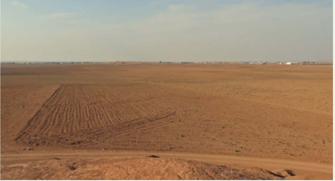
منظر للمدينة السفلى مع القلعة في البعيد عام ٢٠٢١.