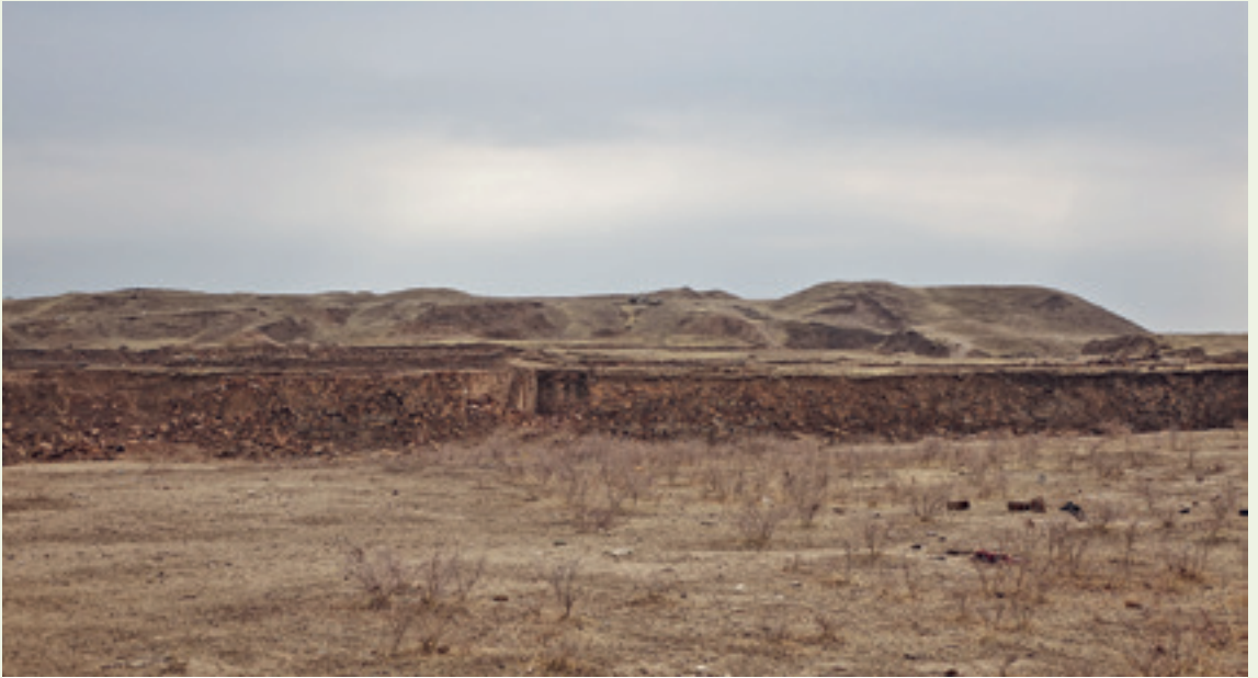
منظر عام لموقع نمرود بعد تدميره عام ٢٠١٦.

الميلاد لدى سقوط المملكة الآشورية. شهد الموقع من جديد استيطاناً جزئياً في أطلاله خلال العصر الفارسي وقامت فيه بعد ذلك قرية في العصر الهلنستي إلى حين هُجر نهائياً بعد تدميره حوالي عام ١٤٠ قبل الميلاد. أُعيد اكتشاف نمرود من قبل علماء إنجليز، وفي مقدّمهم أوستن هنري لايرد، اعتباراً من منتصف القرن التاسع عشر ميلادي. شهد القصر الشمالي الغربي بين عامي ١٩٥٦ و١٩٥٩ أعمال تنقيب عراقية بقيادة بهنام أبو الصوف. أما اعتباراً من عام ١٩٦٩، فقد ترأس فرق العمل العراقية ميسر سعيد العراقي بين عامي ١٩٦٩ و١٩٧٠، ومن ثم بين عامي ١٩٧٥ و١٩٧٧، بالإضافة إلى حازم عبد الحميد الذي كان يشغل أيضاً منصب مدير متحف الموصل الذي قام بنقل جزء من الأعمال الفنية المكتشفة، ولا سيما النقوش التي عُثر عليها في القاعتين "ل" و"م" من القصر الشمالي الغربي. بالتوازي، قام بين عامي ١٩٧٤ و١٩٧٦ علماء آثار بولنديون بقيادة يانوش ميوشينسكي بتنقيب المبنى المركزي والقصر المركزي في وسط التل. كما اضطلعت فرق عمل إيطالية بمسح للسطح وحفريات في قلعة شلمنصر بين عامي ١٩٨٧ و١٩٨٩. في عام ١٩٨٩، عاد فريق عمل من المتحف البريطاني لتنقيب المبنى نفسه. وبين عامي ١٩٨٥ و١٩٩١، اكتشف على وجه الخصوص فريق عمل عراقي بقيادة مزاحم حسين عام ١٩٨٨ تحت القصر الشمالي الغربي قبوراً لملكات تحتوي على كنوز من الصياغة تُعرف بتسمية "ذهب نمرود". يخضع هذا الموقع الذي تعرض لتدمير متعمد على يد داعش، لأعمال ترميم، تقوم بها بشكل خاص فرق عمل من المتحف الحضاري في الموصل ومن الهيئة العامة للآثار والتراث، بمساعدة مؤسسة سميثسونيان.