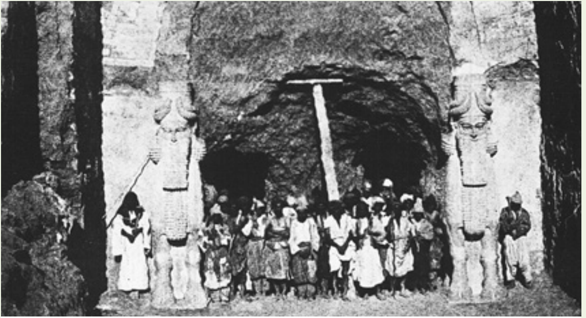
فريق التنقيب في خورسباد أمام بوابة المدينة رقم ٣ حوالي ١٨٥٢ م-١٨٥٥ م.

تشكل خورسباد التي تغطي مساحة ٣٠٠ هكتاراً على الأقل دور شروكين القديمة خورسباد، التي تأسست من الصفر لمجد الملك سرجون الثاني الذي بناها خلال عشرة أعوام. افتتحت هذه المدينة عام ٧٠٦ ق. م، ولم تكن العاصمة إلا لعام واحد، أي حتى تاريخ وفاة الملك في العام التالي. بعدئذٍ، نقل ابنه سنحاريب العاصمة إلى نينوى. وعلى الرغم من عدم اكتمال الأشغال، بقيت المدينة مأهولة مع وجود حاكم فيها. شكّل الموقع ساحة للمعارك ضد داعش، وقد عانى إلى حد كبير. وها هو اليوم يشهد أعمال تنقيب من قبل فريق عمل فرنسي.