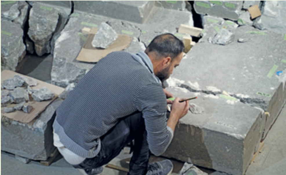
ترميم القطع الأثرية من قبل فرق عمل متحف الموصل والوفا في تشرين الثاني/نوفمبر ٢٠٢١.