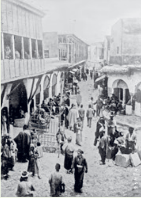
مشهد في شارع في الموصل عام ١٩٢٣.