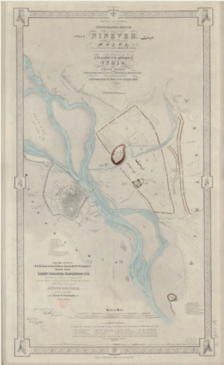
خارطة نينوى ومدينة الموصل الحديثة من تصميم فيلكس جونز، ١٨٥٥.