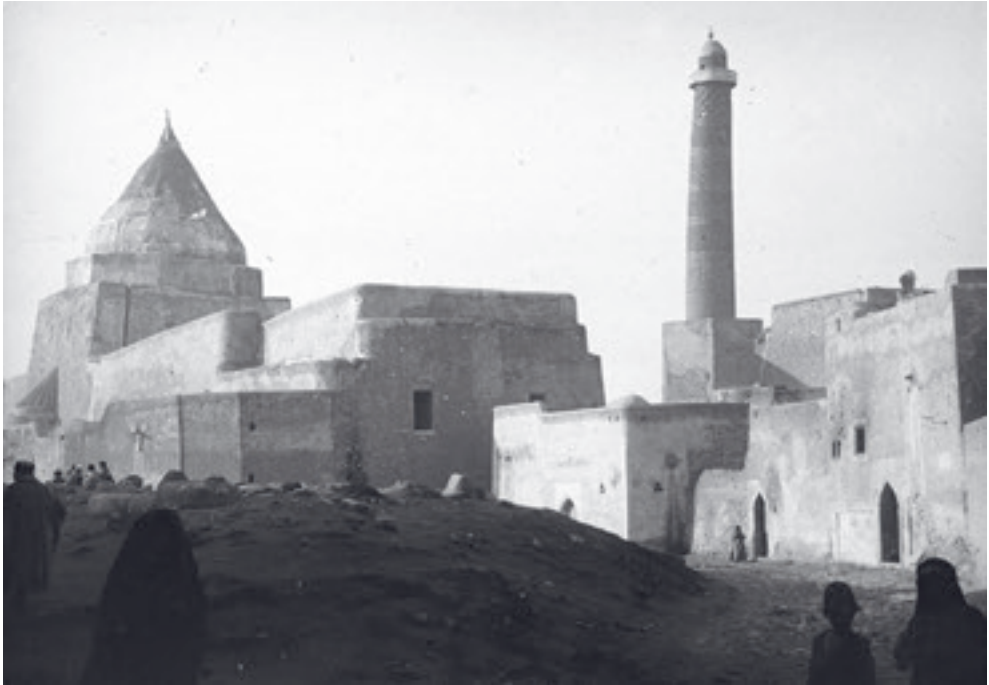
الجامع النوري ومئذنته الحداث في عشرينيات القرن العشرين.

المصلى بجر الحلان بالإضافة إلى إجراء سبر في الجهة الجنوبية من قاعدة المئذنة للتأكد من سلامة الأساسات وتكوين فكرة عن طريقة صيانتها. ولم تدم نتيجة عمليات الصيانة هذه طويلاً فقد دخلت عصابات داعش الإجرامية مدينة الموصل عام ٢٠١٤ لتخرب وتهدم عن عمد جميع معالم المدينة البارزة، ومع اقتراب تحرير المدينة عمدت العصابات الإجرامية على تفجير المصلى والمئذنة في رمضان ٢٠١٧ لتفقد بذلك مدينة الموصل أحد أبرز معالمها التاريخية والرمزية. أطلق بعد عمليات التحرير في سياق مبادرة "إحياء روح الموصل" وبدعم سخي من دولة الإمارات العربية المتحدة وبتنفيذ منظمة اليونسكو العالمية وبإشراف الهيئة العامة للآثار والتراث ومقتشية آثار وتراث نينوى وديوان الوقف السني مشروع إعادة إعمار الجامع النوري ومئذنته الحداث سنة ٢٠١٨ ويمتدّ لمدة خمس سنوات، وينطوي على عمل أثري يقضي برفع الأنقاض وفرز القطع الأثرية وتنظيفها وخبزها بالإضافة إلى رفع قطع الأعمدة الرخامية المزخرفة وتصنيفها وحفظها، فضلاً عن إجراء حفريات أثرية في محيط المئذنة وتحت المصلى للوصول إلى الطبقات الأصلية للجامع.