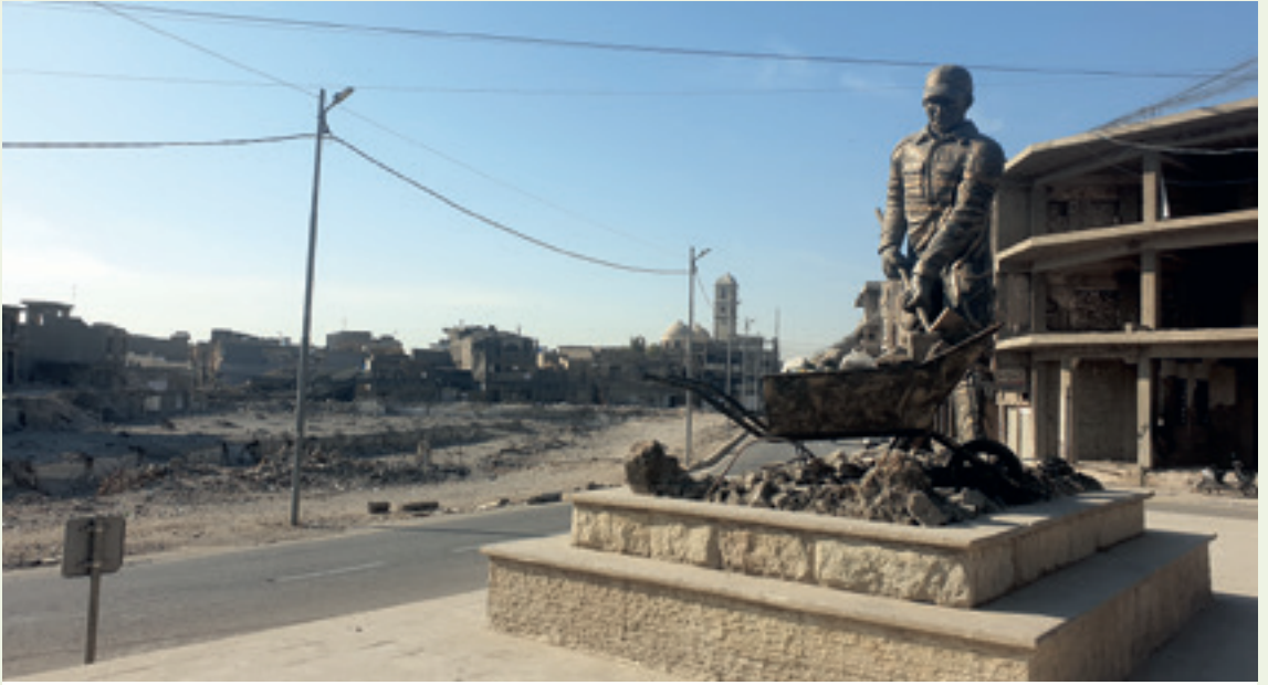
صورة لنصب تذكاري لأبطال إعادة بناء الموصل في أواخر عام ٢٠٢١.

الذي خسر أيضاً قاعدة عملياته في مدينة الرقة السورية. أظهر التلفزيون الحكومي في وقت لاحق العبادي وهو يقوم بجولة في الموصل سيراً على الأقدام في حين كان القصف من الضربات الجوية وتبادل إطلاق النار لا يزال مسموعاً في البلدة القديمة، حيث شنت داعش هجمتها الأخيرة ضد القوات العراقية. وقد شكّلت استعادة الموصل نهاية حقيقية وضربة قاضية لوجود داعش في العراق.