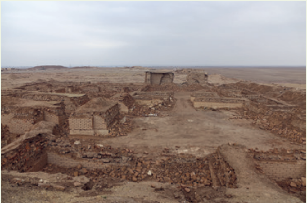
صورة في أواخر عام ٢٠١٦ لمعبد إزيديا في نمرود بعد تفجيره من قبل داعش.