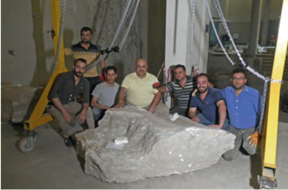
فريق عمل المتحف الحضاري في الموصل خلال ترميم القطع الأثرية في حزيران/يونيو ٢٠٢١.