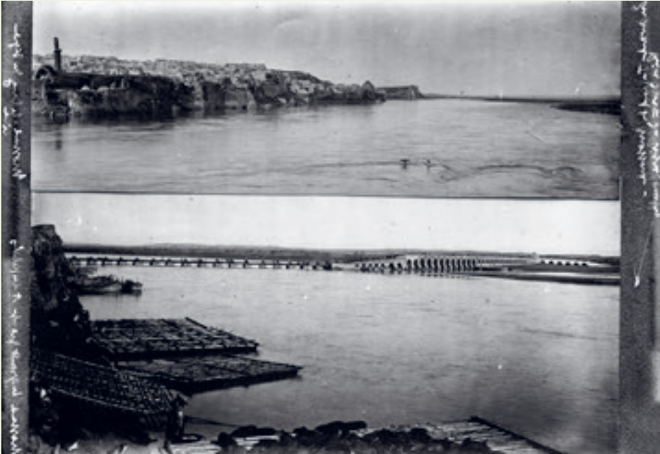
الموصل والجسر العائم على نهر دجلة في عشرينيات القرن العشرين.