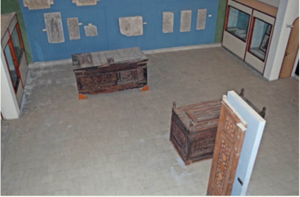
صورة للقاعة الإسلامية عام ٢٠٠٨ قبل تدميرها.