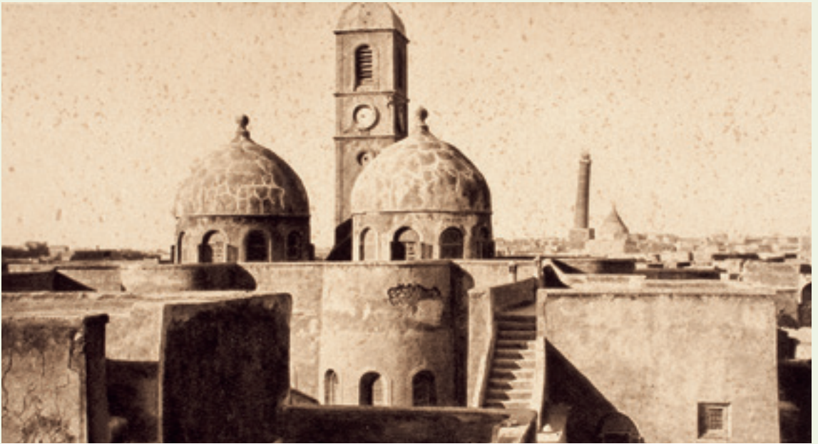
كنيسة الساعة عام ١٩٢٣.