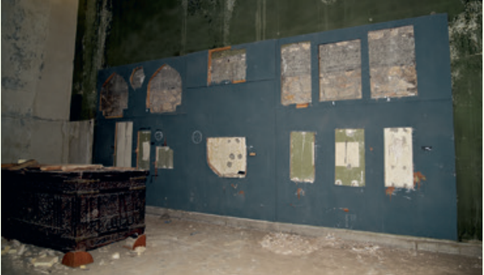
صورة للقاعة الإسلامية عام ٢٠١٧ بعد تدميرها.