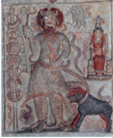
لوح الإله نيرجال