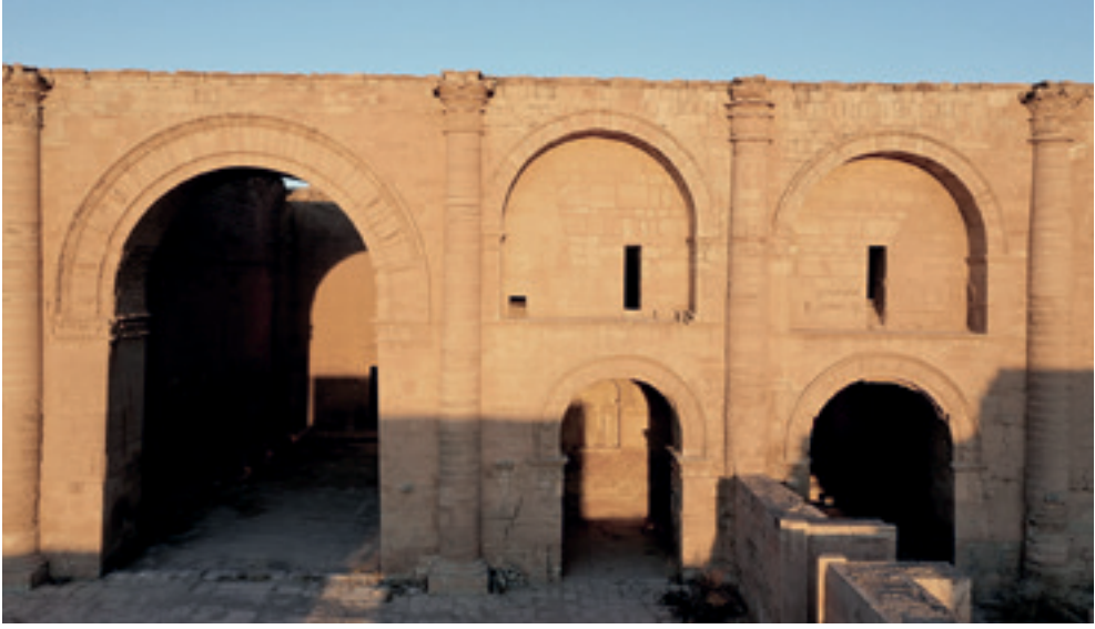
واجهة الحرم الكبير مزينة بإيوانات.

ونخبثها من رعاة الأحرام المقدسة حيث كان يتم تقديم منحوتات. إنها بالضبط القاعة الحضرية التي ظهرت بشكل مروع في مقاطع فيديو تم بثها في ٢٦ شباط/فبراير ٢٠١٥ حول تدمير داعش المتحف. وفي حين تضررت ثلاث قطع أثرية، لا تزال للأسف القطع الأثرية الأصلية الأخرى مفقودة بالكامل حتى اليوم.