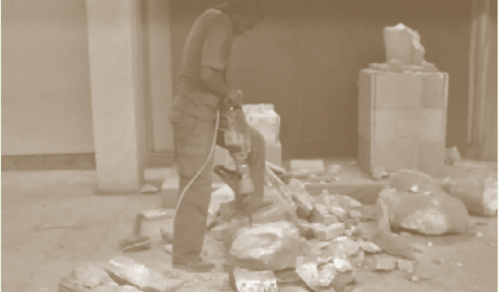
لقطة شاشة من مقطع الفيديو لتدمير القطع الأثرية بالمزارف (المطارق الناقبة) الذي نشرته داعش في ٢٦ شباط/فبراير ٢٠١٥.