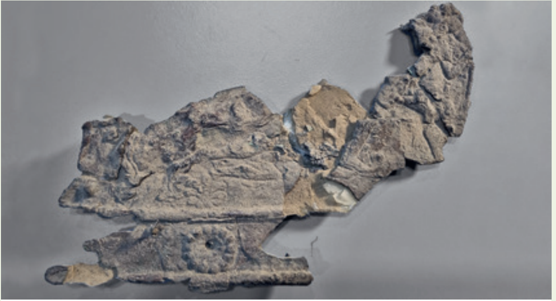
صورة مفصلة للألواح البرونزية المتضررة لإحدى بوابات بلاوات.