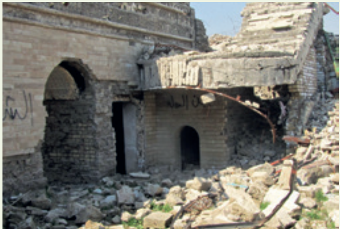
الصحن الداخلي لجامع النبي يونس المُدْمَر، عام ٢٠١٩ .