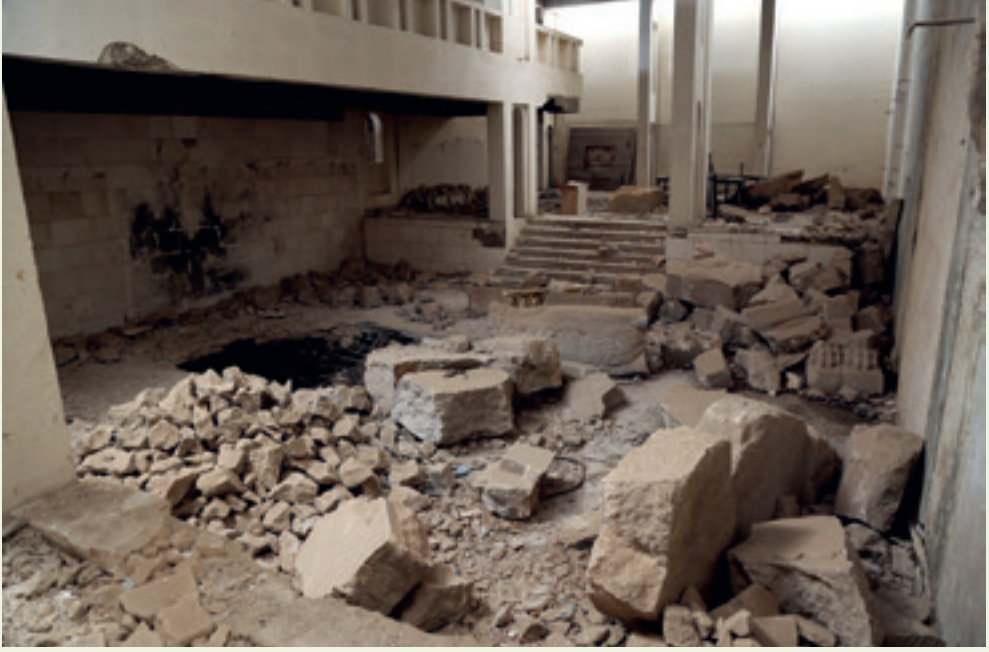
القاعة الآشورية عام ٢٠١٩ والحفرة التي خلفها الانفجار الذي تسببت به داعش.