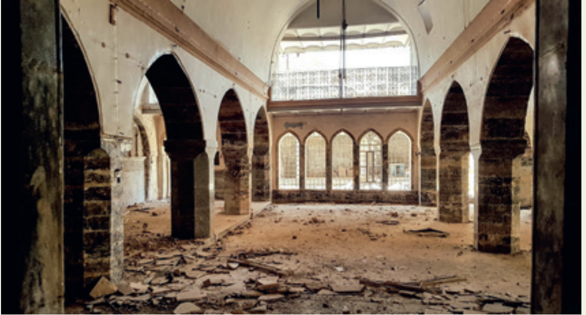
منظر من داخل كنيسة مار توما، ٢٠١٨.