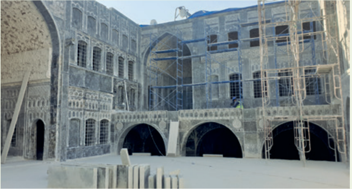
فناء بيت التوتنجي، قيد إعادة البناء، عام ٢٠٢١.