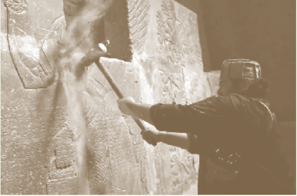
تدمير نقوش نمرود من قبل داعش عام ٢٠١٥.