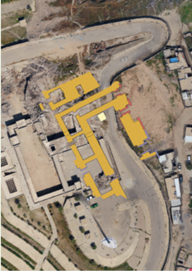
صورة جوية لجامع النبي يونس المُدْمَر مع مخطط جزئي باللون الأصفر للقصر الآشوري الواقع تحته.