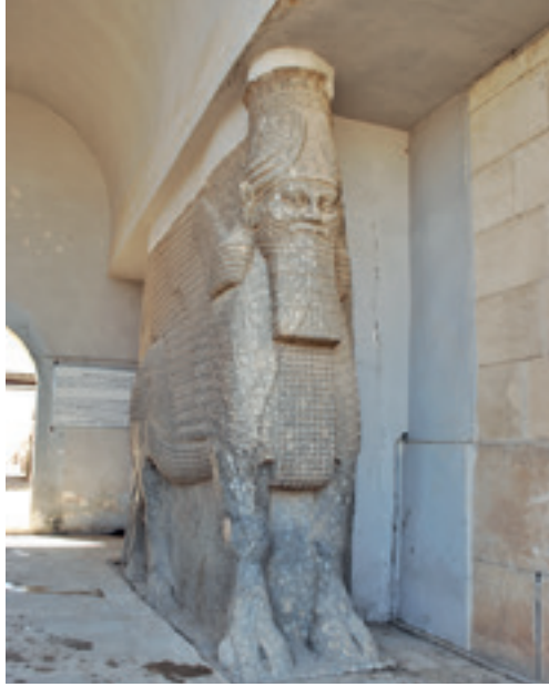
أحد الثورين المجنحين في نينوى عام ٢٠٠٨.