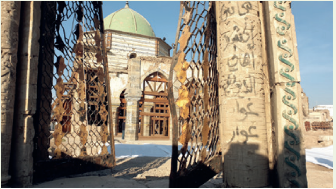
الجامع النوري قيد إعادة البناء، ٢٠٢١.